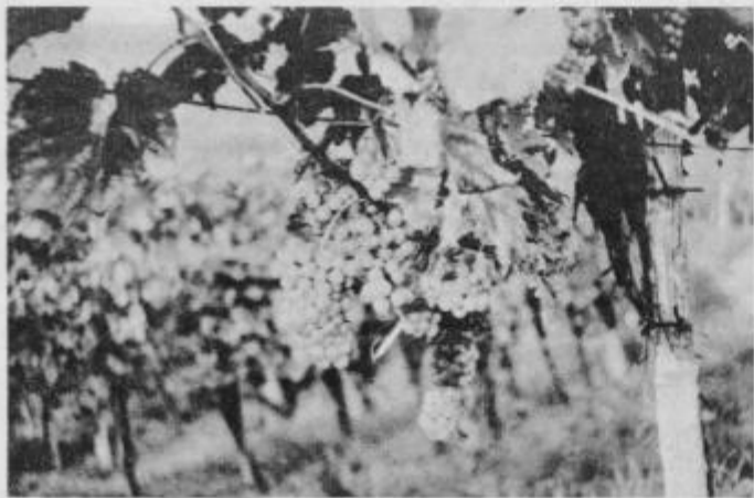
Lepo obložen trs je jeseni v veliko veselje vinogradnikov; letos je takih bolj malo.