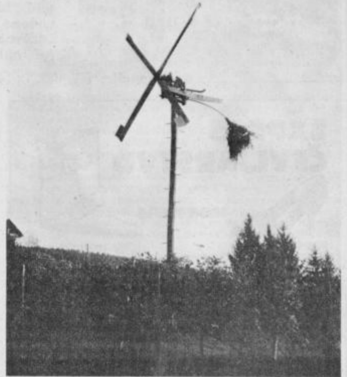
Klopotec — simbol vinorodnih krajev — poje svojo jesensko pesem.