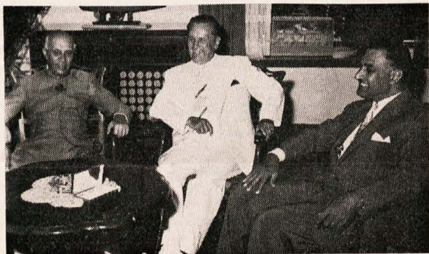
TITO — veliki državnik in borec za mir