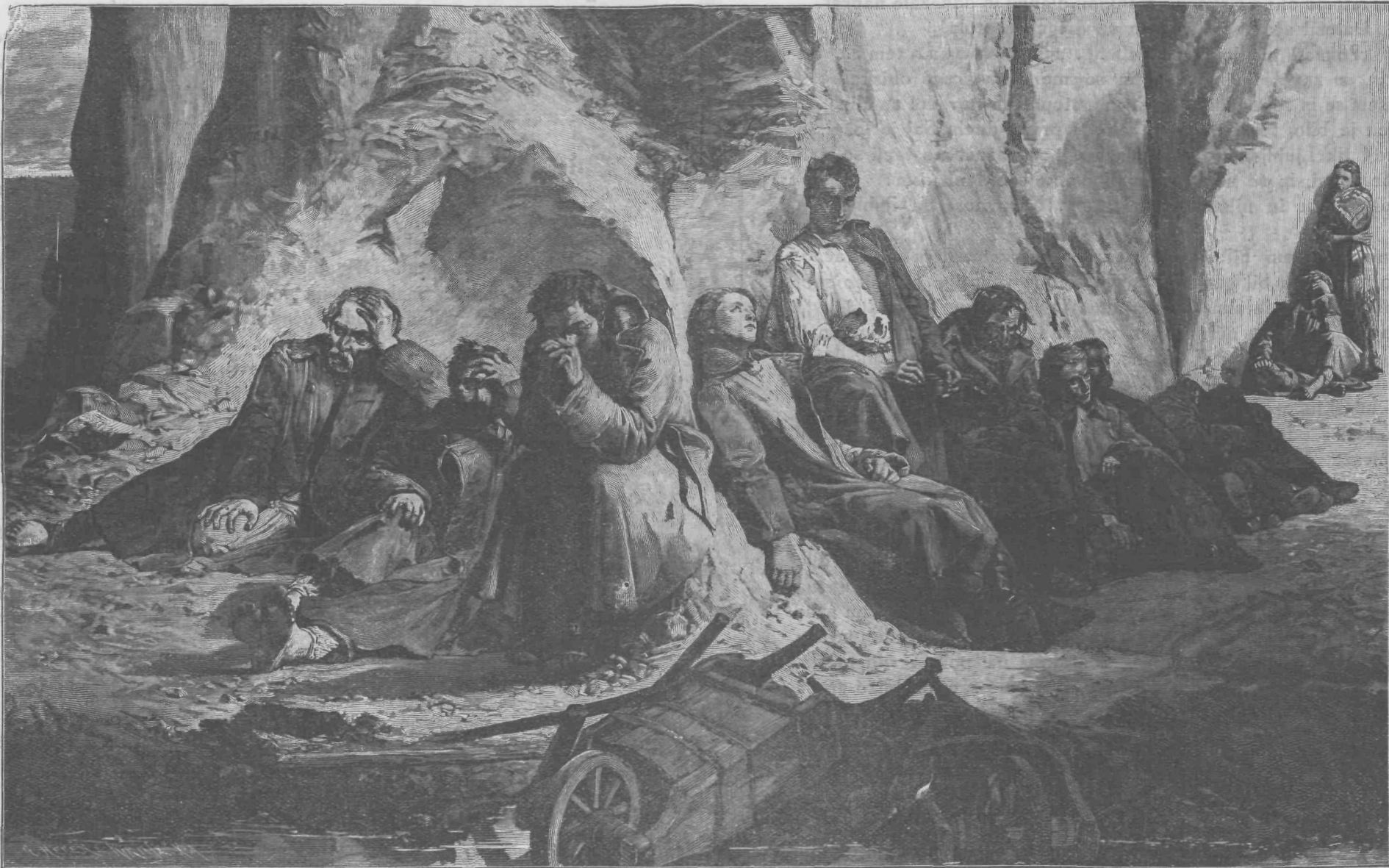
Poljaki v prognanstvu.