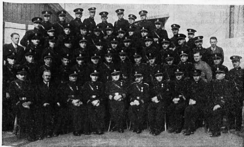
Tečajniki, predavatelji in vodstvo na strokovnem tehničnem tečaju v Ljubljani od 10. do 14. februarja 1939.