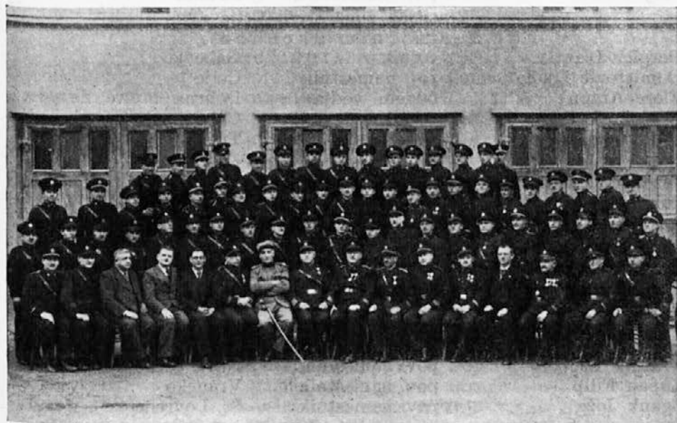
Tečajniki, predavatelji in vodstvo na strokovnem tehničnem tečaju v Celju od 24. do 27. januarja 1939.

Letošnji zimski tečaji so pokazali prav tako lepe uspehe kakor lanski. Izvršili so se vsi tečaji, ki jih je zajednica v svojem načrtu predložila, razen dveh, ki bosta prihodnjo zimo še v Mariboru.