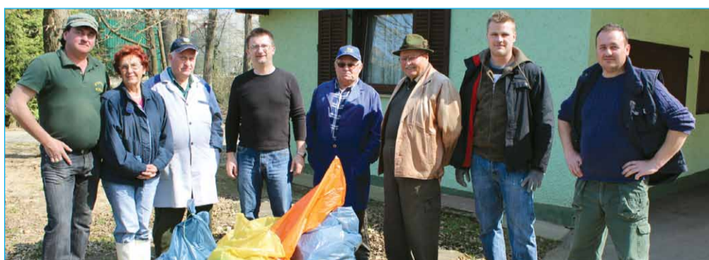
Vsako leto se spomladanske akcije čiščenja okolja udeležijo tudi člani LD Markovci.