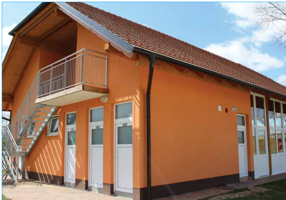
Športni park je priljubljeno zbirališče Borovčanov.

Poleg moške članske ekipe smo gasilci v Borovcih imeli pred nekaj leti tudi izredno uspešno žensko tekmovalno ekipo, ki je dosegala vrhunske rezultate. Priznanja so vidna na policah v gasilskem domu.