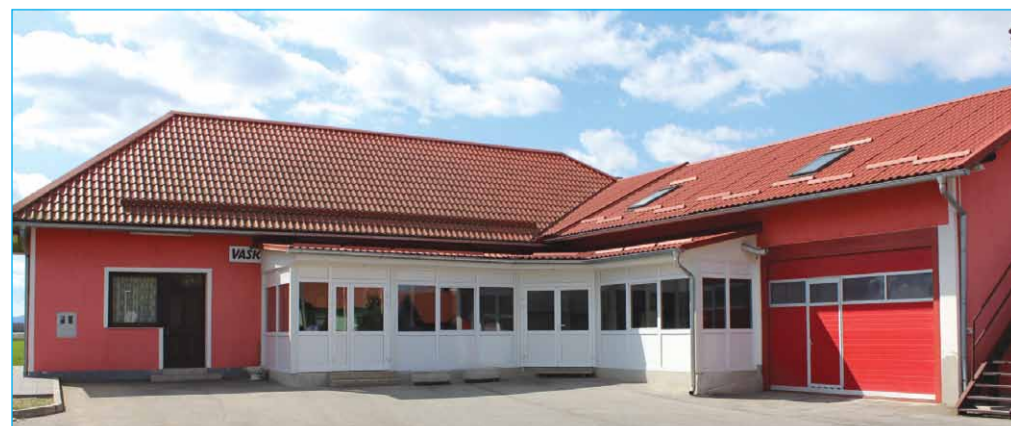
Obnovljeni vaško-gasilski dom v Borovcih