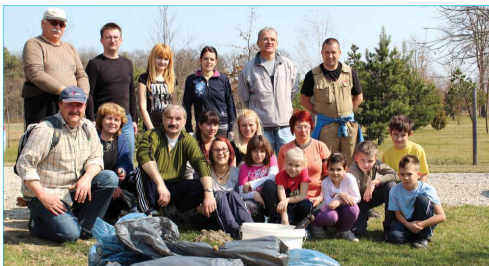
Tudi v Strelcih se je zbralo lepo število udeležencev.