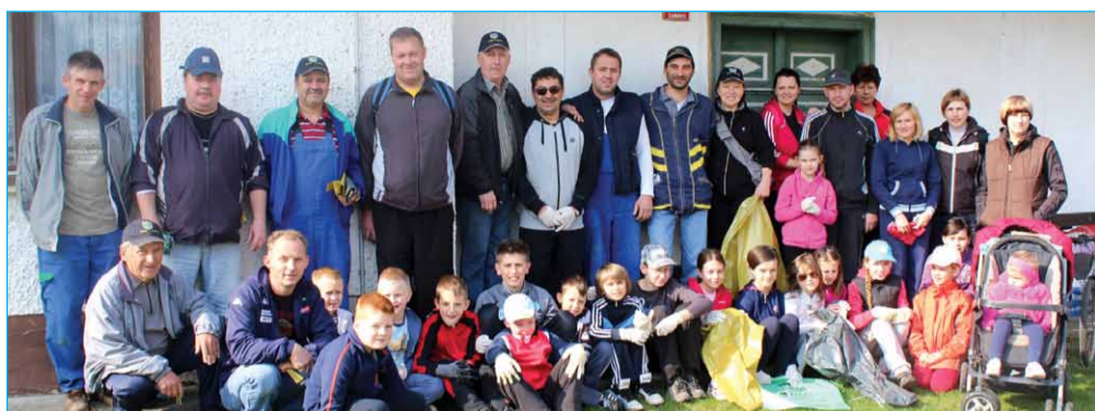
Zbrani zjutraj ob 9-ih v Zabovcih