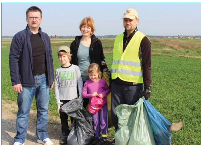
Čistili so tudi v Novi vasi.