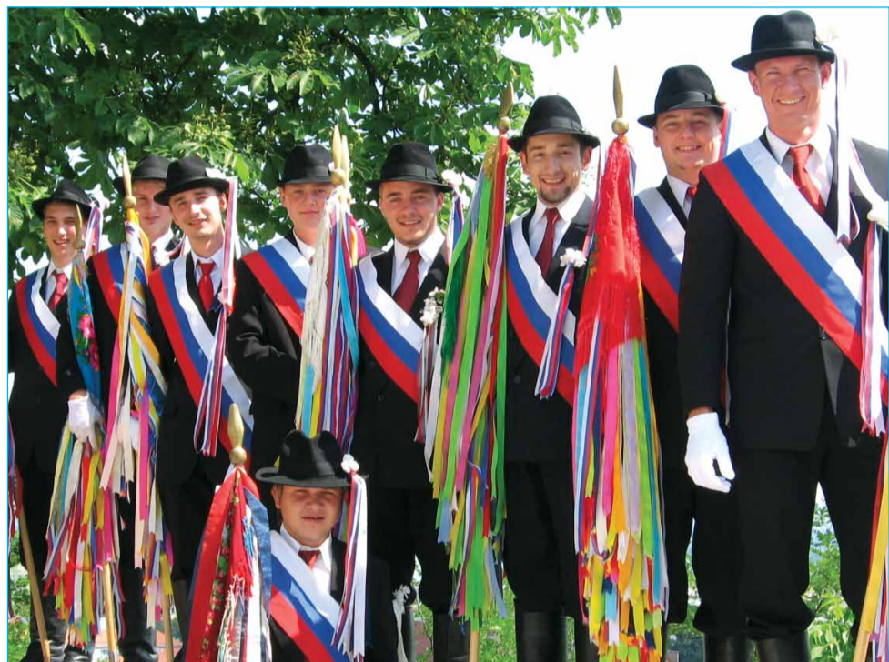
Kopjaši FD Markovci

Trenutno je najaktivnejša plesna skupina, ki se pripravlja na območno revijo odraslih folklornih skupin, ki bo meseca maja. Odpravljajo se tudi na intenzivne vaje, do sedaj pa beležijo manjši nastop, s katerim so po dvoletni pavzi prebili led. Društvo v letu 2012 čaka tudi soorganizacija mednarodnega folklornega festivala Kimavčevi dnevi, ki bo septembra potekal na Ptuj. Ker v naslednjem letu Folklorno društvo »Anton-Jože Štrafela« Markovci obeležuje 75. obletnico svojega delovanja, so misli in priprave že usmerjene tudi v ta pomemben projekt.