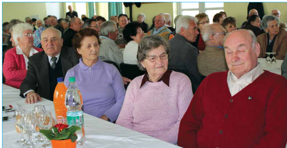
Utrinek s srečanja