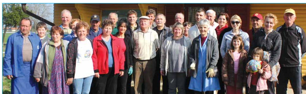
Člani Čebelarstva društva so se akciji udeležili v lepem številu.