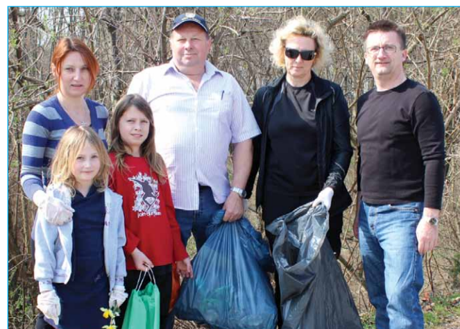
Skupina v Markovcih, ki je čistila brežino ob cesti skozi vas.