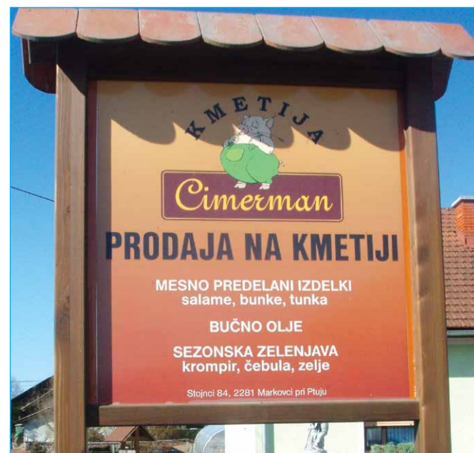
Pozdravni napis Kmetije Cimerman