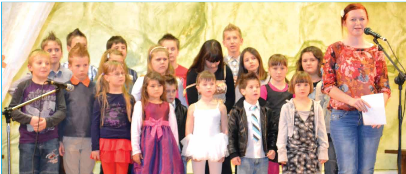
Zbrani nastopajoči na proslavi v Stojncih