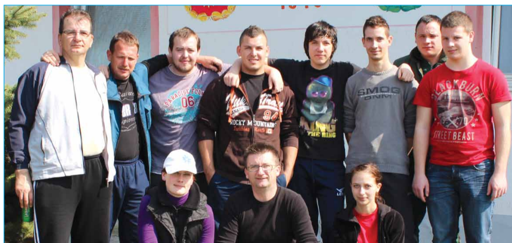
V Sobotincih so »v akcijo« stopili predvsem mladi.