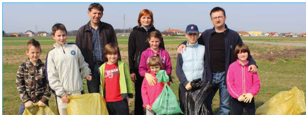
Župan z udeleženci akcije v Bukovcih ob športnem parku