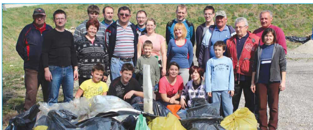
Borovčani po opravljenem delu