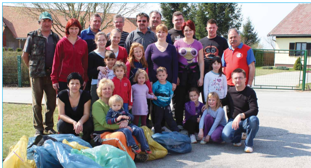
Takole so z delom nekaj pred poldnevom zaključili v Prvencih.