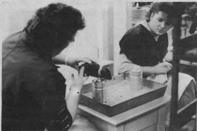
Obžiganje nitk z gorilnikom na špirit. Potrebna je previdnost.

Izredno pereč problem je kajenje na nedovoljenih mestih. Za vse kadilce smo na območju tovarne uredili posebne prostore, kjer je kajenje dovoljeno, temu pravimo kadilnice. Delavce dan za dnem opozarjamo kjer je kajenje prepovedano, na območju tovarne so nameščene opozorilne table in nalepke z ustreznimi napisi. Tudi v Čevljarju včasih potrkamo na vest kadilcev. Toda vsem našim prizadevanjem navkljub, se še vedno najdejo posamezniki, ki mirno kadijo pred skladiščem vnetljivih snovi ali pa celo sedijo pod tablo, kjer jasno piše KADITI PREPOVEDANO, NEVARNOST EKSPLOZIVJE in korajžno pokadijo eno ali dve cigareti. Cigaretne ogorki, ugašeni sicer, nekateri pa tudi ne, romajo v koš za smeti v bližini vnetljivih tekočin in drugih lahko vnetljivih materialov. Še po nekaj urah, ko delavci nič hudega sluteč odidejo, se lahko iz tako odvrženega ogorka razvije požar. Ob tem moramo povedati, da smo imeli nekaj takih požarov, ko so goreli koši za smeti, vendar pa so jih delavci pravočasno odkrili in pogasili, tako, da se požar ni razširil. Nekajkrat smo torej imeli srečo, lahko pa bo že naslednjič drugače. Zato razmislimo, kje bomo prižgali cigareto ali kam bomo odvrgli cigaretni ogorek.