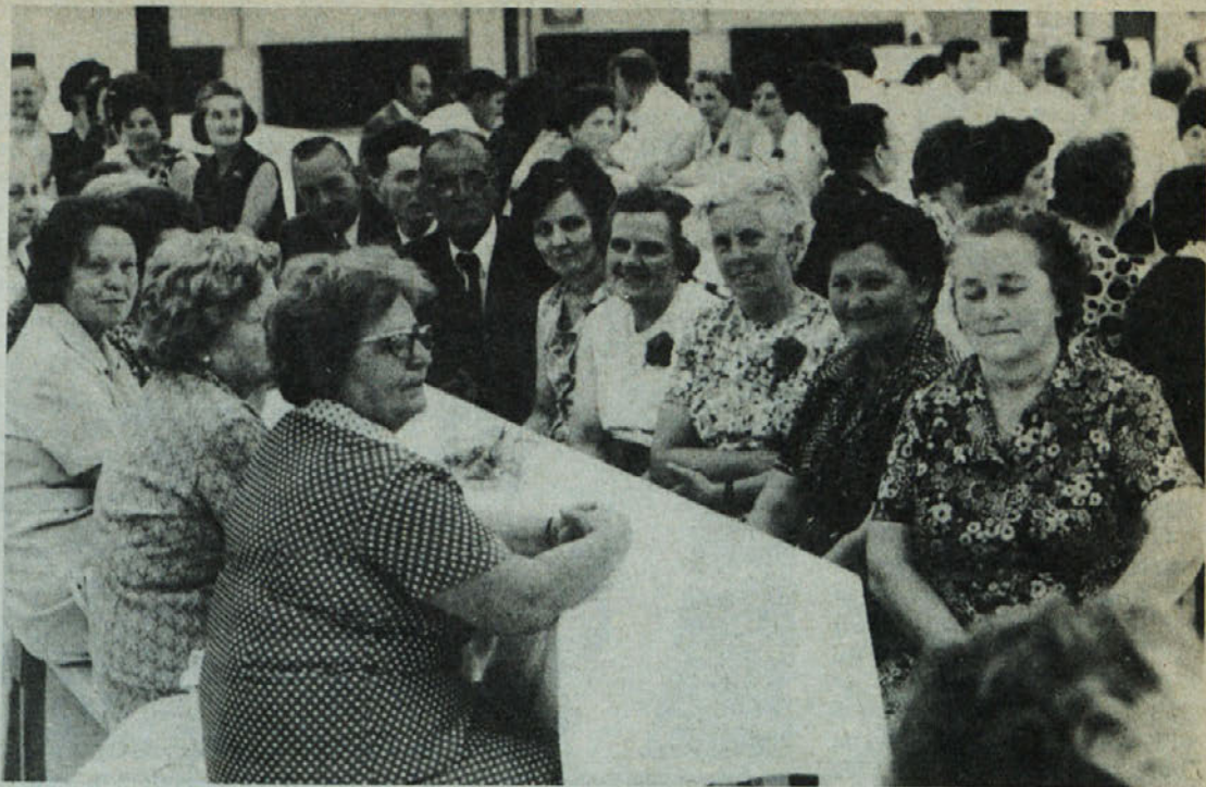
Kadar se zberejo upokojenci iz Delte