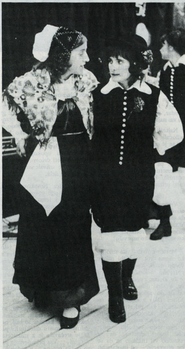
Folklorna skupina Delte je ob prazničnih programih nepogrešljiva!

Po zaključnem računu so TOZD porazdelile sredstva tudi za stanovanjsko izgradnjo oz. za nakup stanovanj. V posameznih sredinah so ta sredstva kaj različna, usmeritev teh pa seveda primerna višini. Tako v TOZD TEMENICA tudi letos ne bodo d odeljevali posojil za individualno gradnjo. Lanskoletna in letošnja sredstva pa bodo vezali pri Ljubljanski banki z namenom nakupa družbenega stanovanja. V preteklih letih je bilo veliko zanimanje za posojila, čemur so v Temenici tudi prisluhnili, v zadnjih dveh letih pa so se odločili za nakup družbenega stanovanja.