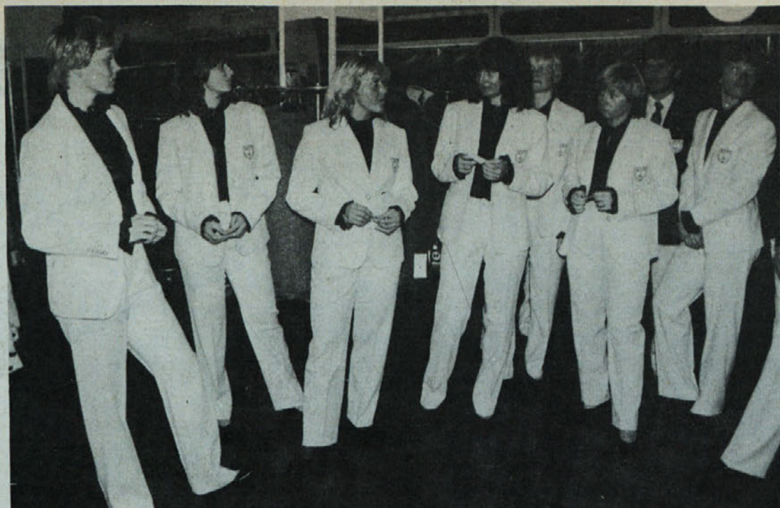
Jugoslovanska ženska smučarska reprezentanca v Labodovih oblačilih

Člani združene delegacije za: kulturo, telesno kulturo, izobraževanje, raziskovanje