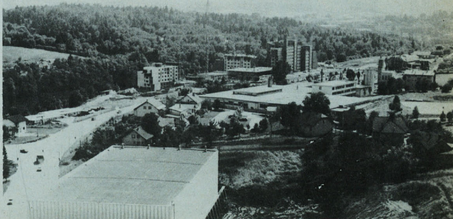
Takole rastejo nova stanovanja pred pragom novomeškega Laboda