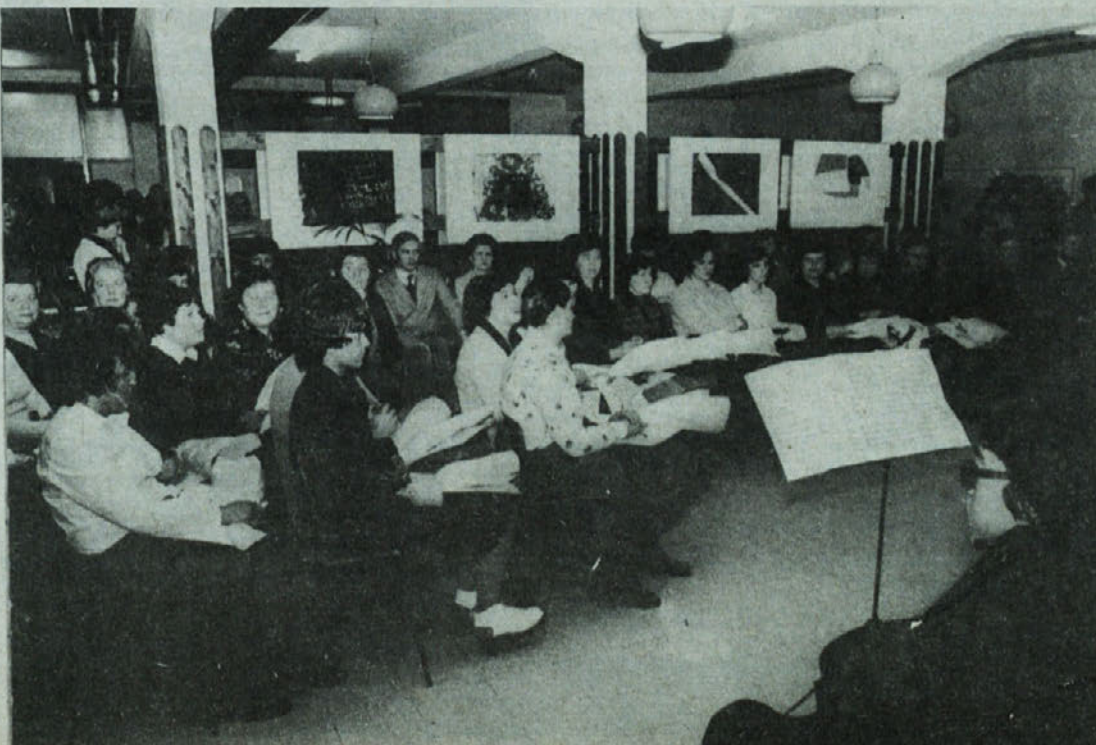
Ko prisluhemo ubranim zvokom . . .