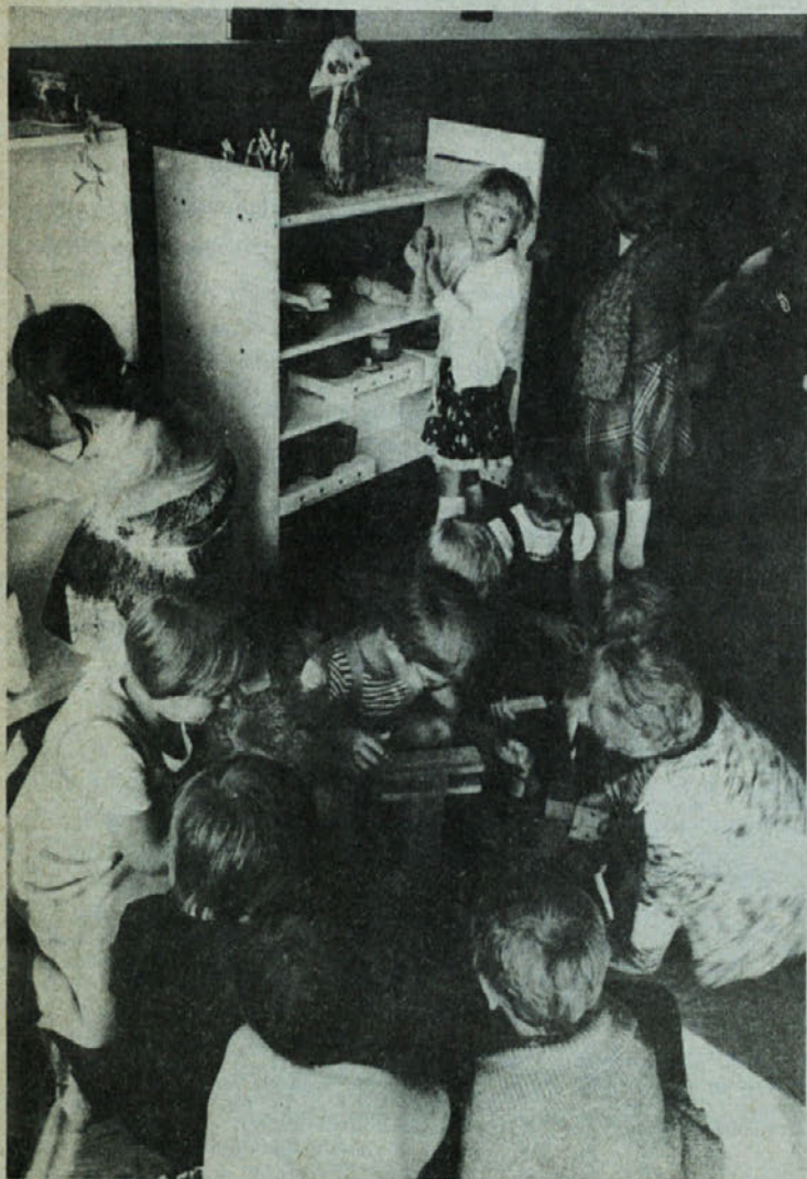
V otroškem varstvu