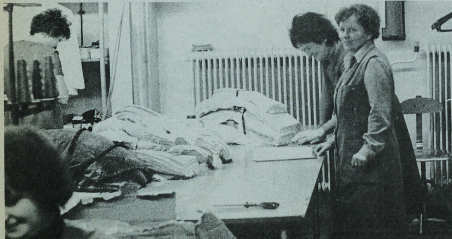
Brigadirki iz TOZD Zala