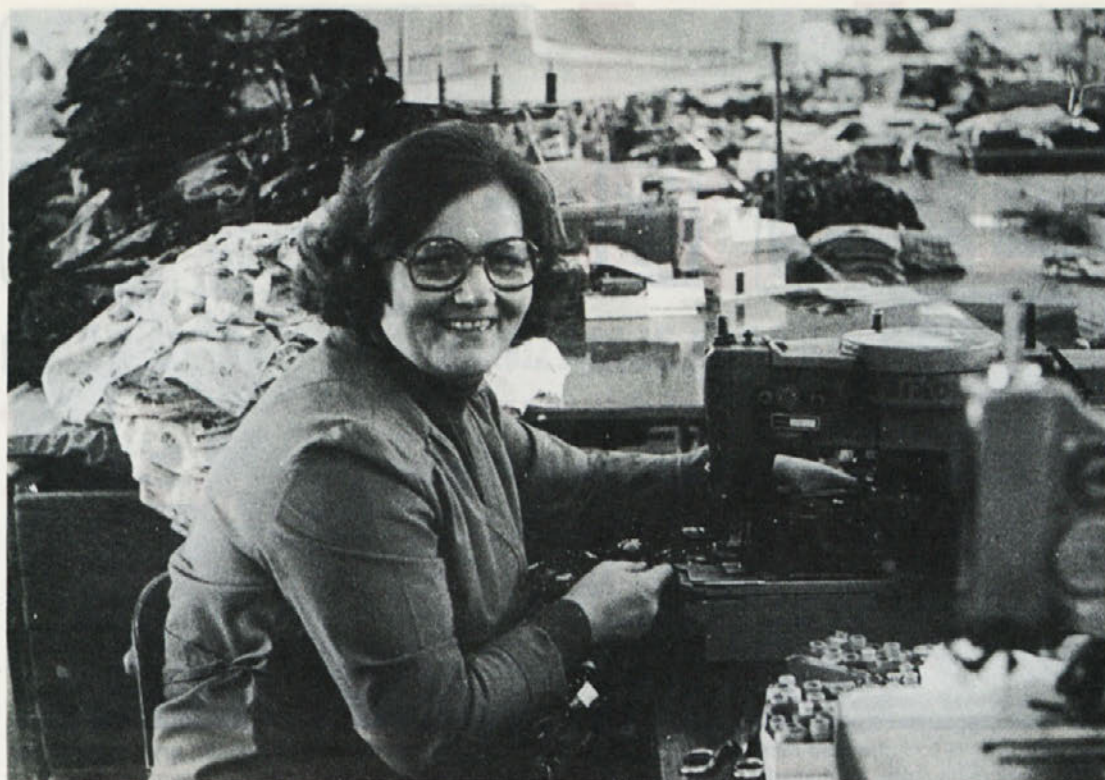
Posnetek iz TOZD TIP-TOP