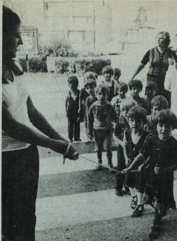
Z otroci varno čez cesto