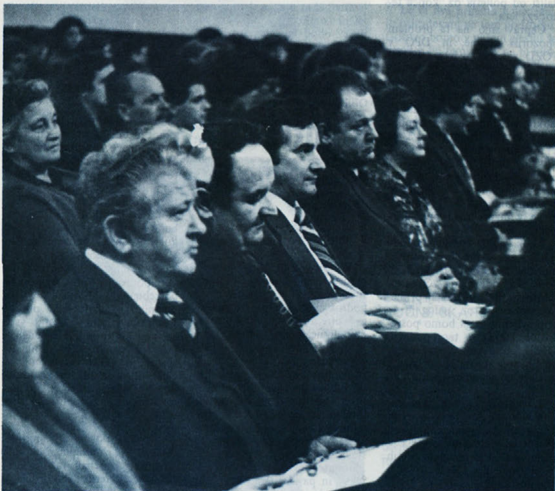
Nekaj jubilentov na prireditvi v Novem mestu

Pozabili smo na nekaj in sicer na to, da smo že v pravilniku navedli, da je način ugotavljanja rezultatov dela na delih, ki niso normirana začasen, dokler ne izoblikujemo sistema ugotavljanja rezultatov dela z objektivnimi merili, ker le takšen sistem zagotavlja uveljavljanje načela delitve OD po delu. Poleg tega smo se dogovorili, da moramo do ustreznega sistema čimprej priti, kar je praktično pomenilo v letu dni. Prav tako smo bili enotni v tem, da so objektivna merila za delitev OD specifična za vsako delovno enoto — službo in da jih ne moremo določiti nobena služba iz pisarne, ampak da jih bodo določili delavci posameznih enot oz. služb, pri čemer je razumljivo, da v teh primerih ima najvažnejšo vlogo vodja enote, ki je tudi plačan zato, da organizira in vodi delo v enoti.