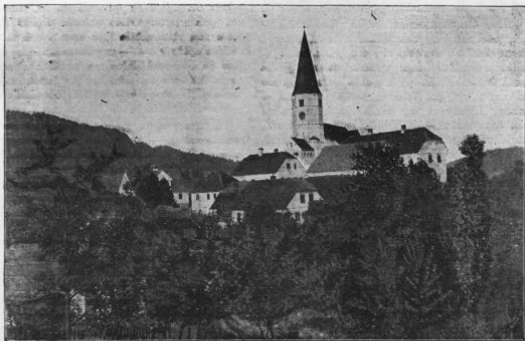
Sv. Marija Zagorska.

sta to še mlada fantiča od kakih 16—18 let. »Iz Ribnice.« »Ja, pa prav odkod, le natančno mi povejta, ali menita, da jaz ribniške doline ne poznam?« Malo čudno sta gledala, kako da tukaj v Gorici en gospod hoče vsako luknjo na Kranjskem poznati, da mu ni zadržati Ribnica in hoče natančneje vedeti. »Prav izpod Nove Štife.« »A tako, potem sta pa iz sodraške fare!« Fantiča sta se mi zdela nedolžna in dobra. Zato ju vprašam: »V Sodražici imate Marijino družbo za fante, ali sta