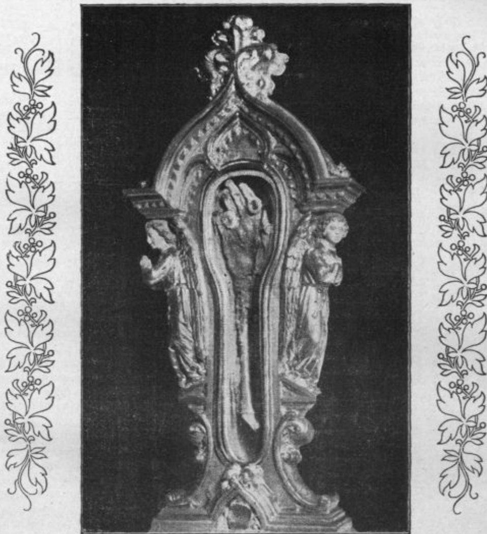
Relikviarij z roko sv. Frančiška Ksaverija.