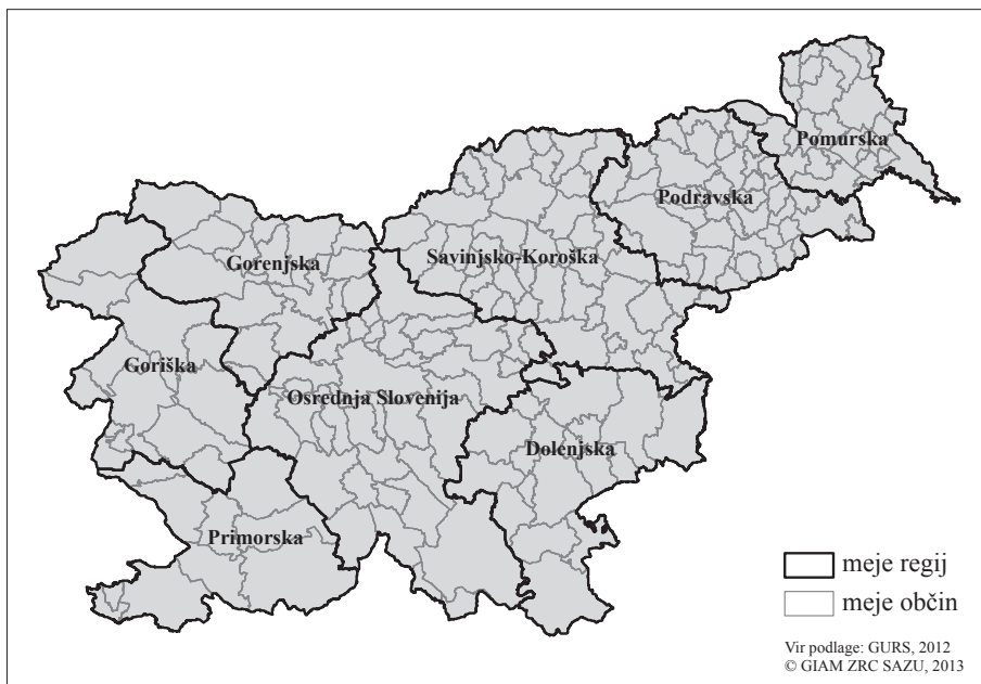
Slika 1: Izbrana regionalizacija Slovenije na osem funkcionalnih regij.

1,9 % celotne populacije. Število vrnjenih in pravilno izpolnjenih anket ocenjujemo kot ugodno, saj Blejec (1976, 341) trdi, da je za velike populacije dovolj, če velikost vzorca dosega od nekaj promilov do nekaj odstotkov celotne populacije.