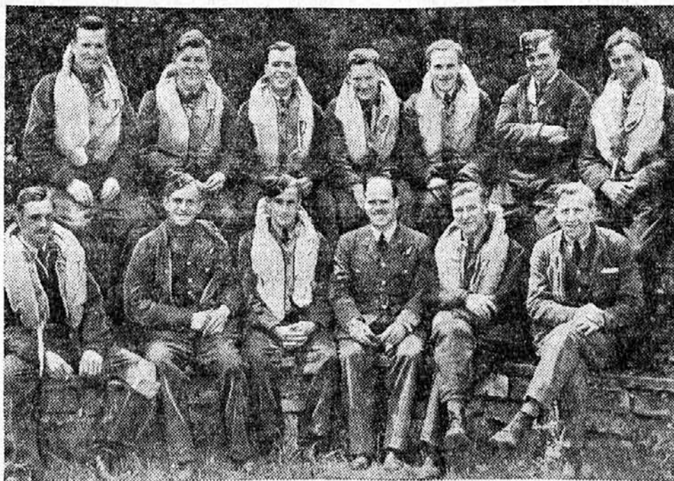
Skupina poljskih letalcev, ki so se po porazu Poljske priključili angleški armadi. Kot pravišo poročila so poljski letalci izredno drzni v najbolj nevarnih položajih v zračnih bitkah