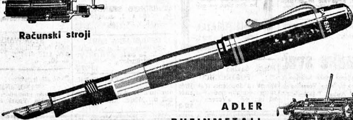
ADLER RHEINMETALL pisalni stroji