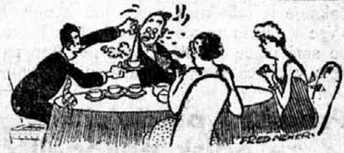
Čarodej si nataka čaj