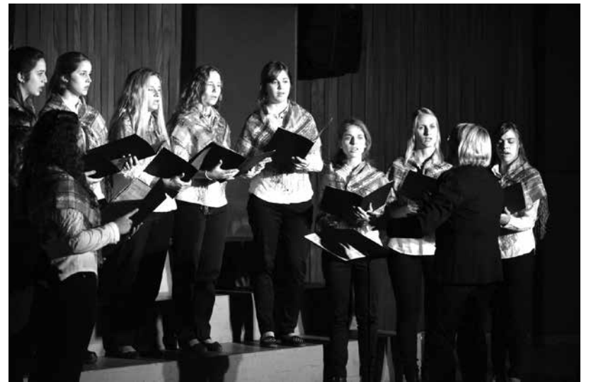
Dekliška vokalna skupina »Mučičas«. Spomin se nadaljuje ...

Naj v priznanje in zahvalo navedemo imena tistih, ki so akademijo pripravili in izvedli.