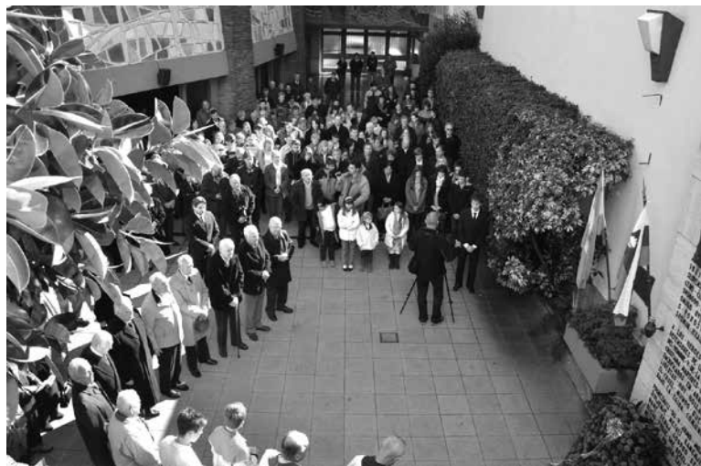
Molitev pred spomenikom