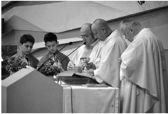
Sveta daritev za žrtve

Letos pa je malenkostna sprememba vnesla nove okoliščine. Verjetno je bilo prvič, da je spominsko slavlje potekalo dopoldan. Ideja, sad mladih voditeljev, se je porodila na Medorganizacijskem svetu. Na to nedeljo ni