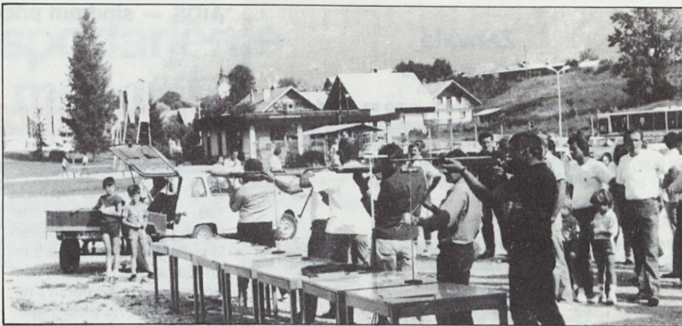
Mirna roka, dobro oko, pa še malo sreče in dober strelski rezultat je bil tu