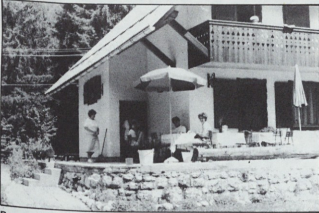
Brezskrbno posedenje pred domom v Bohinju. Le kdo se ne bi pridružil?