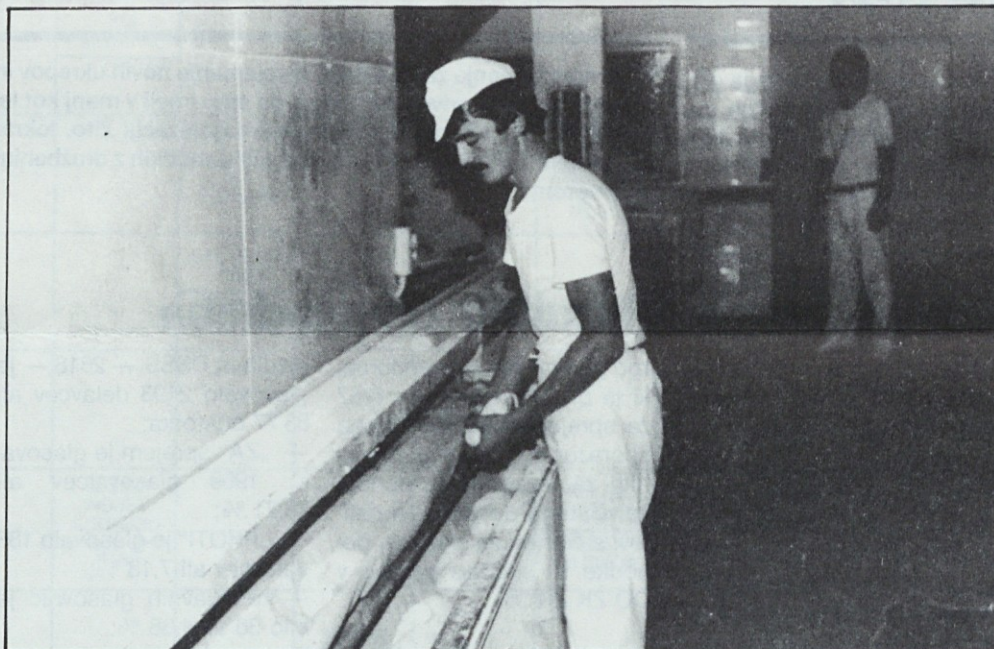
Bo klasična linija v pekarni Bežigrad kmalu razbremenjena?

V tabeli je prikazano stanje naše delovne organizacije, ki je trenutno negativno in otežuje izvrševanje plačil za uvoz blaga, kakor tudi vse neblagovne odlive, med katerimi so glavna postavka dnevnic za stroške službenih potovanj v tujino. Te bomo lahko zagotavljali le v primeru pozitivnega salda EDP, za kar pa bo treba ustvariti večji devizni priliv.