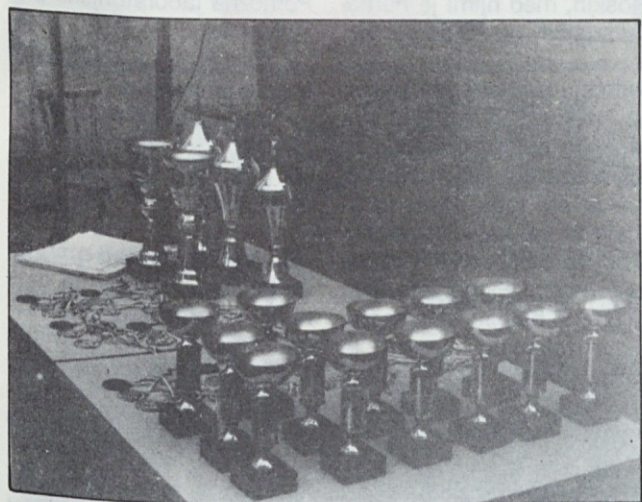
Nagrade čakajo najboljše