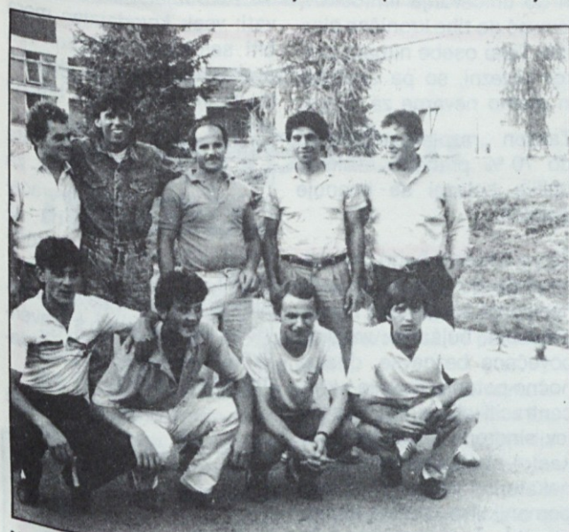
Nogometaši tozda Pekarstvo in testeninarstvo (na sliki 'v civilu' so bili prepričljivo najboljši.