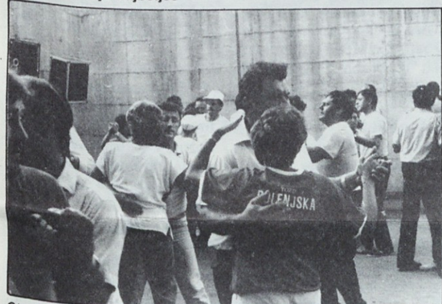
Ob dobri glasbi ansambla Obzorje se tudi pesalcev ni manjkalo