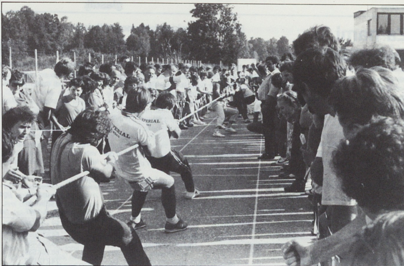
Športne igre so letos v vseh pogledih uspele. (Več o tem na straneh 6 in 7)