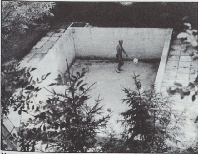
Mar bo bazen v Ukancu klavno propadel? Nekaj razpok ne bi smelo predstavljati nerešljiv problem.