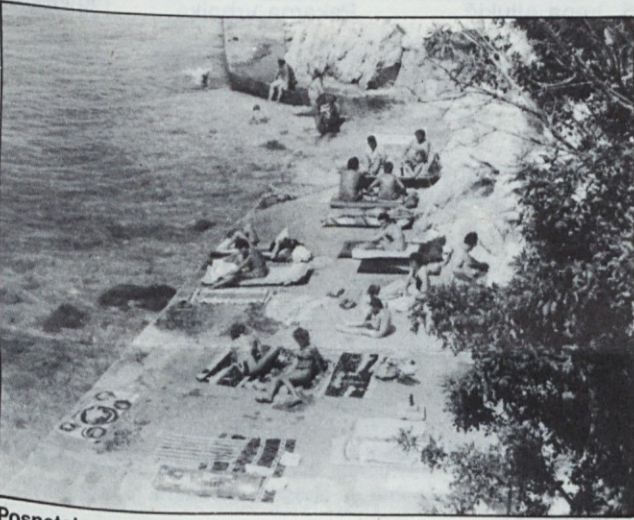
Posnetek z dramaljske plaže