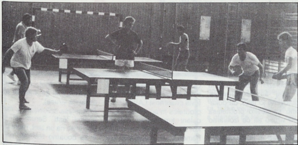
Mojstri male bele žogice med tekmovanjem v telovadnici osnovne šole