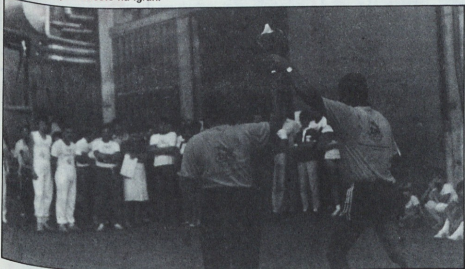
Pozdrav gledalcem. Zastopnika Pekarstva in testeninarstvo s pokalom za prvo mesto na igrah.