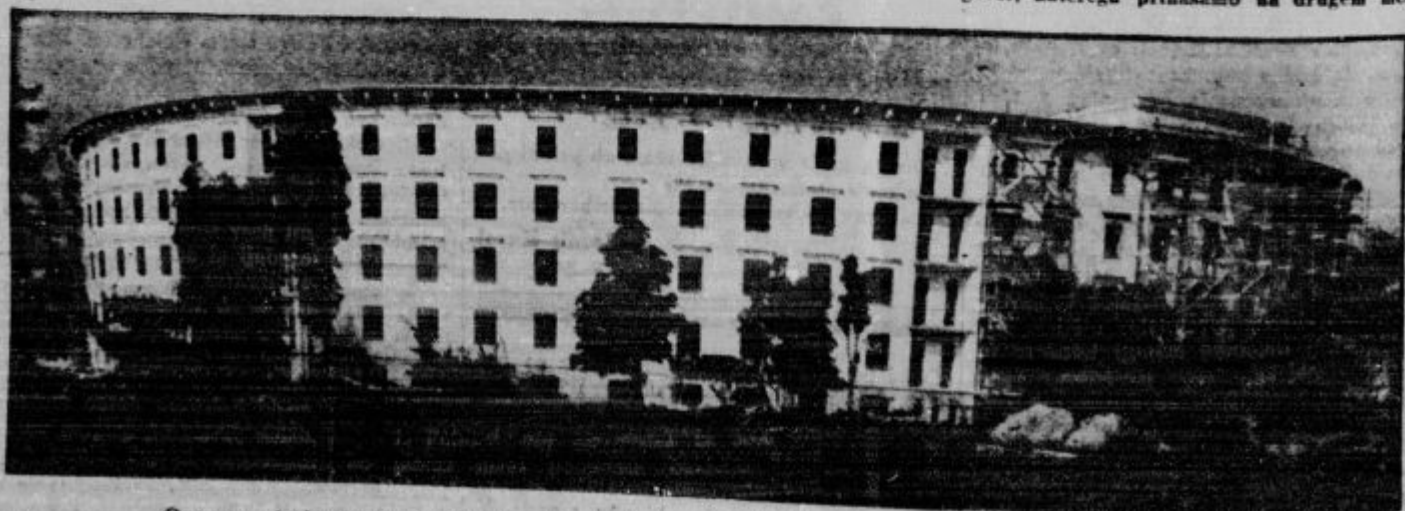
Ogromna stavba novega bogoslovja v Ljubljani hitro napreduje in se bodo prihodnje leto že vselili vanjo.