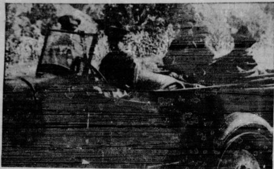
Kraljev obisk v Nišu prejšnji teden: Nj. Vel. kralj Peter II., kneževič Aleksander in predsednik vlade Cvetković v železniškem avtomobilu na izletu skozi Sičevačko sotesko.