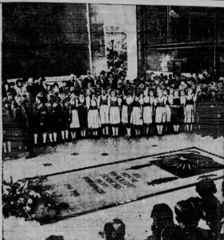
Hitlerjeva mladina na grobu neznanega vojaka v Parizu.