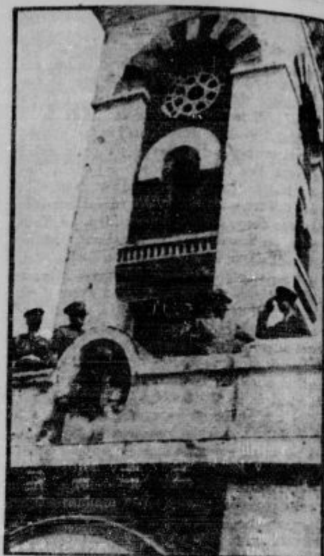
Nj. Vel. kralj Peter II. in predsednik vlade ogledujeta spomenik na Čezru.