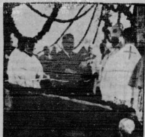
Ban dr. Natlačen je imel pri odprtju mosta lep govor, katerega prinašamo na drugem mestu.