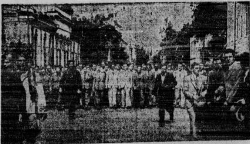
Pohod romunskih legionarjev. Na čelu koraka vodja železne garde Horia Sima.