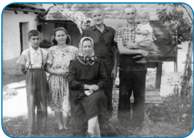
S starišami od moža, njegovim bratom, steri je bijo 15 lejt mlajši, z možaum pa starejšim sinaum