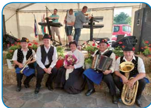
Člani Porabskega tria in ansambla Što ma čas

Te zadvečerek smo doživeli folklorno obarvani program, v sterom sta gorastaupili dve folklorni skupini Slovenske