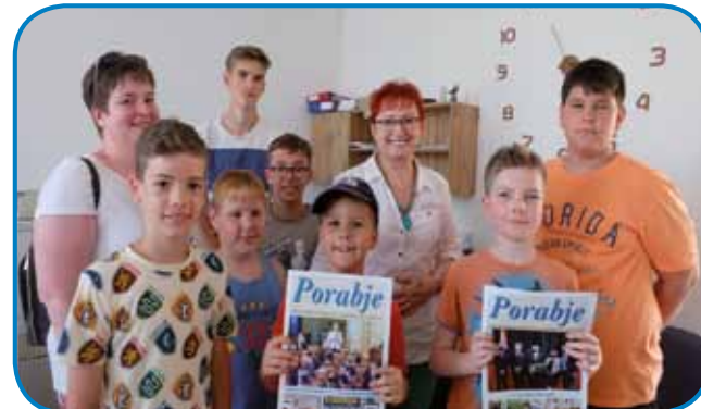
»Fantovski« del tabora v uredništvu časopisa Porabje

Prvi dan tabora, ki je potekal konec junija, smo imeli spoznavalni dopoldan, po kosilu pa smo se odpravili v Slovenski kulturni in informacijski center, kjer smo v dveh skupinah obiskali Radio Monošter in uredništvo časopisa Porabje. Otroci so z velikim zanimanjem poslušali