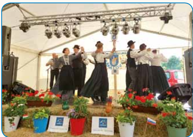
Slovenski den v Sakalovcaj stran 5