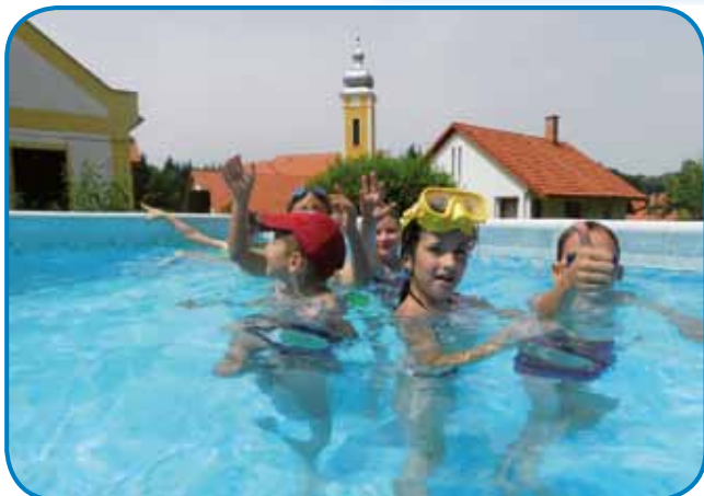
Po ogledu Kuharjeve spominske hiše na Gornjem Seniku so se veselo namakali v bazenu

Zadnji dan je bil namenjen obisku znamenitosti v Prekmurju: udeleženci so si najprej ogledali Expano v Murski Soboti, nato pa še Vulkanijo na Gradu na Goričkem. »Vse naše aktivnosti smo prilagodili dinamiki starostne skupine. Veliko so ustvarjali in se tudi gibali, saj je poletje. Vmes pa smo se seveda veliko pogovarjali v slovenščini,« je za zaključek sekretarka Nikoletta povedala o 2. Poletnem slovenskem taboru, ki sta ga finančno podprla Sklad Gábor Bethlen in