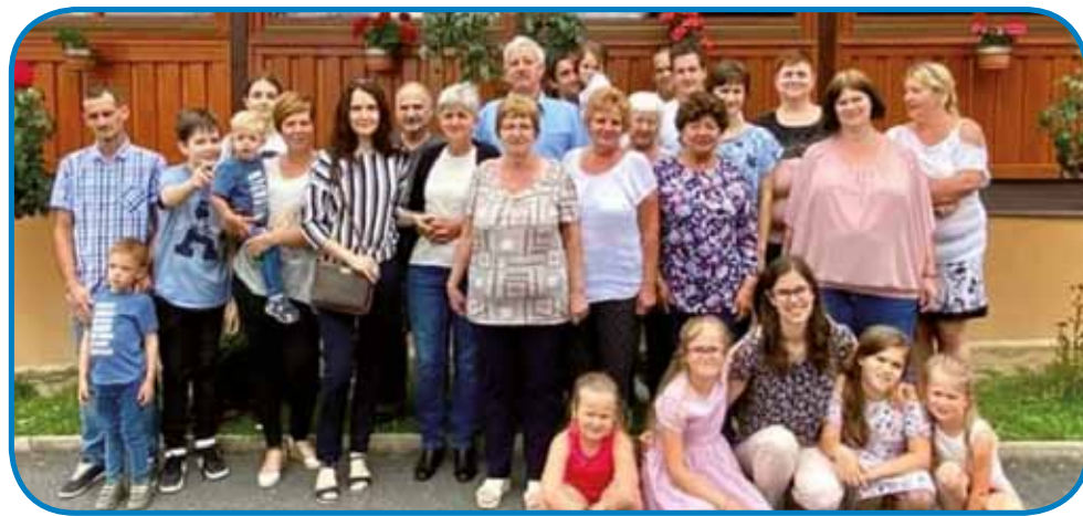
Domiter - Žókš familija je z veseldjom vküper svetéjla Eržikin 60. rojstni den

čiti. Ne morejo se zanesti. Furt njim pravimo, vas je vsevtjüper šest vnukov, vi ste vsi gnatji, eden ne more več dobiti pa nej menje. Sploj radi so vtjüper vsi, razmejo se tü lepau pa se radi majo, depa tašno tü djeste, ka se svadijo. Aj, kak se nakovejo! Té malo ne gončejo, za eno malo tá pozbijjo pa je že pa vse vreda. Tej vekši, tak pri sinej kak pri čeri, pa že morajo pomagati pri dela. Trno radi