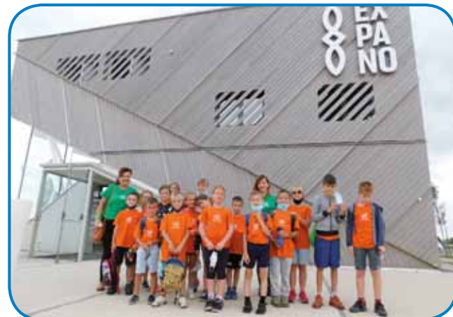
Zadnji dan so bili na izletu po Prekmurju, med drugim so obiskali tudi Expano v Murski Soboti

Pri Zvezi Slovencev so podobni lanskoletni tabor ocenili kot uspešnega, zato so se odločili