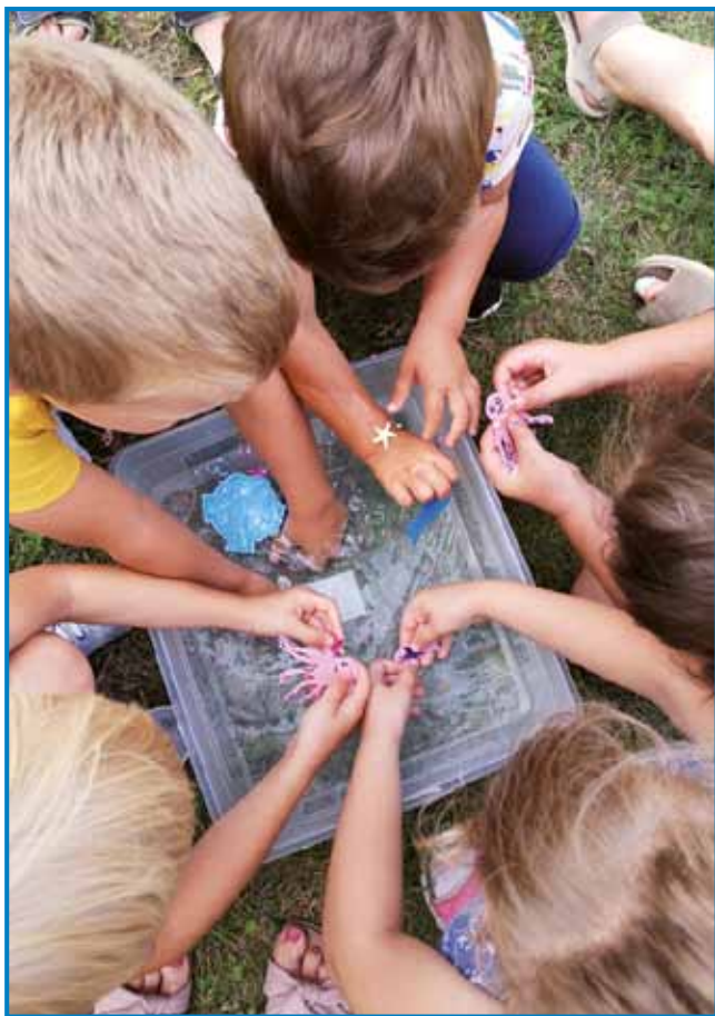
Senzorična škatla Morje in morske živali