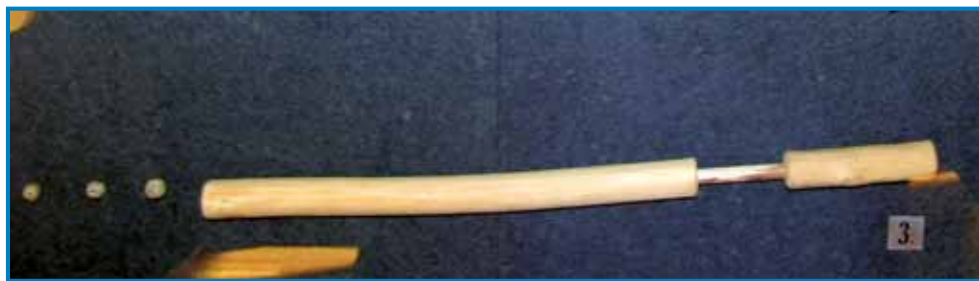
Pükša z bozonovca in golaubiške v varaškem Muzeji Avgusta Pavla

čom vrejmeni najbole s odov prija. Leko ga damó cuj k šalatam ali bejlím ribam tö, pravi küjarski majstri pa z