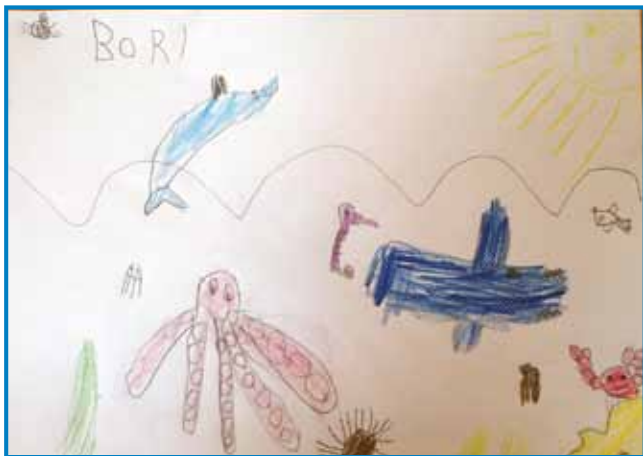
Spoznali smo morske živali. Narisala Boróka Császár

Igrali smo se različne gibalne igre in se zunaj zabavali s senzorično škatlo, ki smo jo poimenovali Morje. V njej je bilo namreč polno morskih živali.