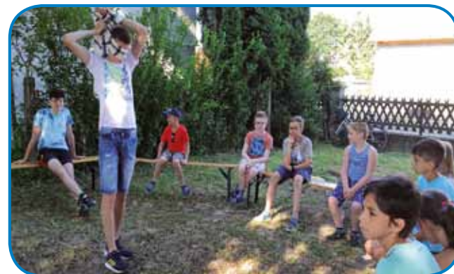
Otroci med družabnimi igrami

Naslednji dan smo se odpravili v središče mesta, kjer so se otroci razdelili v tri skupine in zbirali gradivo o treh temah, in sicer tehnika, hišni ljubljenci in moda. Zbirali so slike, zapisovali svoje opombe ter s pomočjo mobilnih telefonov naredili intervjuje z mimoidočimi. Popoldne so imeli kratko uvajanje v to, kako napisati članek, nato pa so nastajali pisni izdelki posameznih skupin.