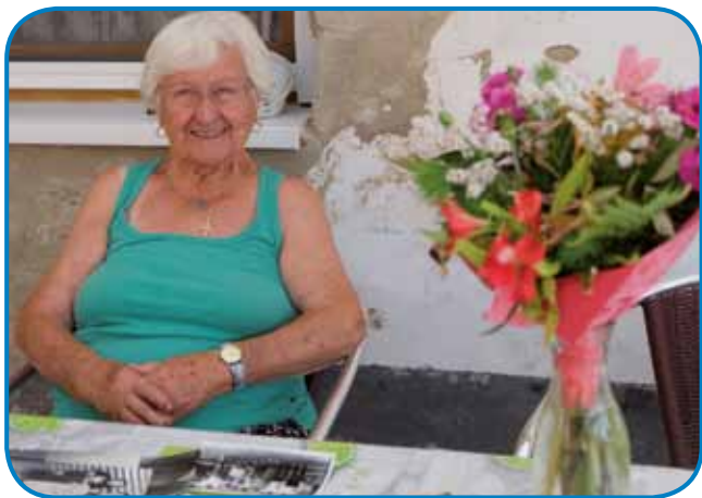
Lasuna Marika neni so vsigdar koražni

delali, ka zakoj dja tau ne ličim ta. Dja tau pravim, ka nej slobaudno je tazlūčati, zato ka dosta vse tašo je na tjejpaj, ka bi človek pozabo, pa nej samo tjejpe, lejpe spomine tō. Etak, gda tjejpe naprevzmem, dostavse tašo mi na misli pride, ka bi že ovak pozabila. Tak ka preveč dosta spominov mam v tej škatüli.«