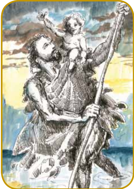
Gda ga je pejški prejk reke neso, je grtūvalo Dejte na rami Kristošu vsikdar žmetnejše – tak ga je Jezoš Kristoš vpelavo v misterij krsta v vodej

Brigita se je v visikoj držini naraudila kauli leta 1302 blūzi varaša Uppsala (gde gnes deluje erična univerza), njena familija je bila v