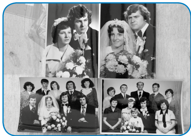
»Mali« družinski fotoalbum - zdavanijski kejpi od sinaum

»Dja velke lampe mam pa rada se veselim pa fejst rada poslušam muziko. Moja sneja že tak več-