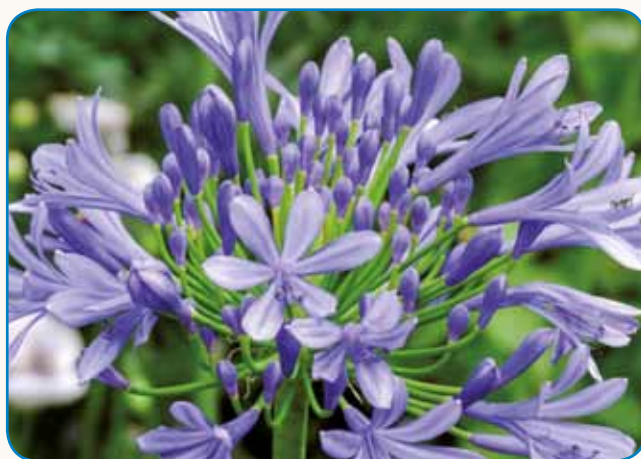
Modro cvetje stran 7