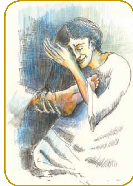
Grejšna ženska, štera je s svojimi skuzami polejvala, z vlasami brisala in s svetim olinom namazala Kristošu nogau, v Svetom pismi nema ime – donk pa tak držimo, ka je tau bila Marija Magdalena

Legenda pripovejda: gda je Kinga s svojimi apaticami bejžala pred Tatari, je prej nazajčilca eden pantlik – s tistoga je gratala reka Dunajec. Prejk vodē so Mongoli eške leko prišli, gda pa