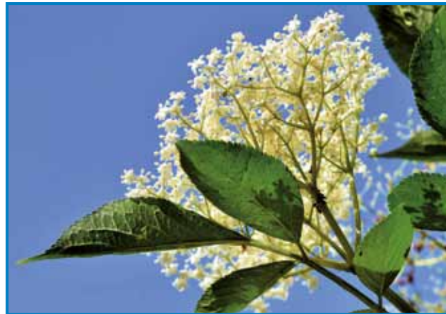
Bezeg zraste na 3 do 10 mejtov visiko - tau grmauvdje má drauvne cvejte v formi držence

Bezeg pa donk zavolo toga najraj mamó, ka fajno dene po medi in dober žma má. Kak smo že napisali, z njegovoga cvejta največkrat sirup naredimo, štéri nam v vrau-