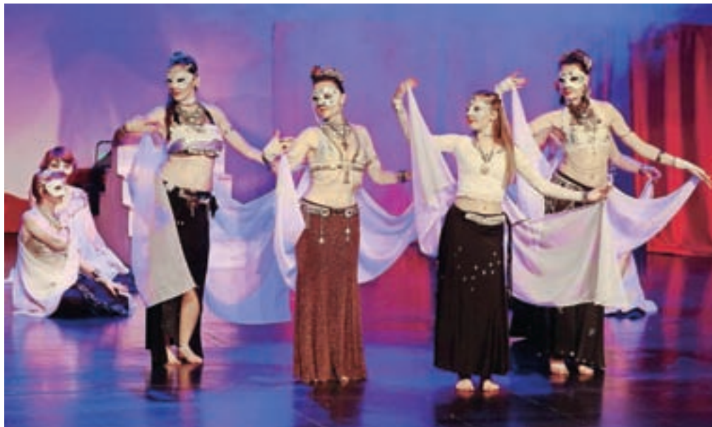
Na odru se zvrsti lepo število plesalk, kostumi prevzamejo.

Vse lepo tvori celoto, povezano s prehodi, oder ni prazen. Koreografije so mešanica tribal fusion stila, sodobnega plesa in hip hopa. Znotraj plesne zvrsti zasledimo lahko tudi ameriški tribal stil. Za izjemno bogato kostumografijo so poskrbele plesalke same. Pa še primerno močan mejkap, pričeske, igra luči, zvokov in glasbe, ples in nekaj manjših, a močnih scenskih kosov, na odru ustvarjajo zgodbo, ki je doživljala aplavze občinstva že med samo predstavo.