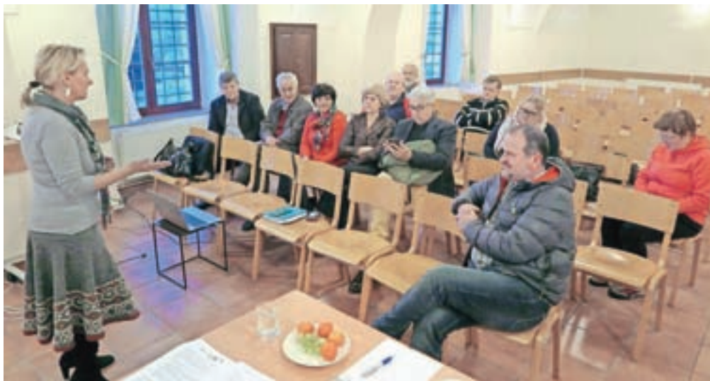
V nekdanjem mekinjskem samostanu so minuli teden pripravili prvo delavnico v sklopu projekta speciAlps v Kamniku.

»Velik del alpskega območja predstavlja neokrnjena narava, ki privablja številne turiste. Vse bolj se namreč razvijajo pohodništvo, kolesarjenje in priložnostni turizem. Regija se hitro razvija v vse bolj priljubljeno in pogosto obiskano turistično destinacijo. Težave, ki vznikajo v soju takšnega razvoja, se porajajo predvsem na po-