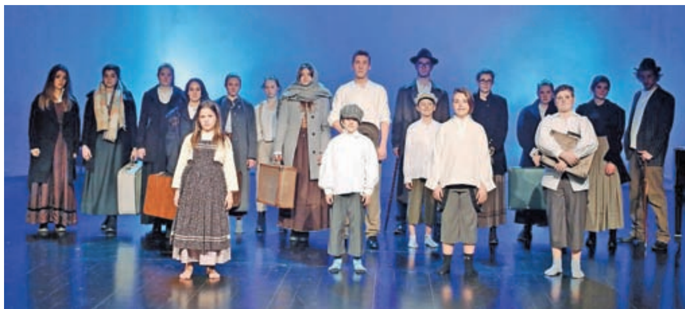
Eden od prizorov s proslave, ki jo bodo noč na odru Doma kulture Kamnik uprizorili dijaki Gimnazije in srednje šole Rudolfa Maistra Kamnik

Osrednja občinska proslava ob slovenskem kulturnem prazniku bo noč v Domu kulture Kamnik, v teh dneh pa je kulturi posvečeno še veliko drugih prireditev. Še posebej razveseljuje dejstvo, da za številnimi kulturnimi projekti stoji vse več mladih.