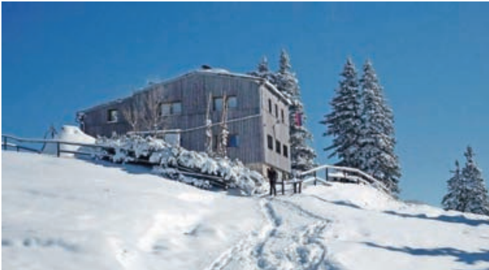
V veliko pomoč naravnemu okolju bodo primerne male čistilne naprave, ki si jih prizadevajo urediti v vseh planinskih domovih, tudi na Veliki planini.

Velika planina je občutljivo kraško območje, pod njo se nahajajo vodni viri s pitno vodo za vse nas, in to naravno vrednoto bomo ohranili le s pazljivim ravnanjem in čim manjšim vplivom.