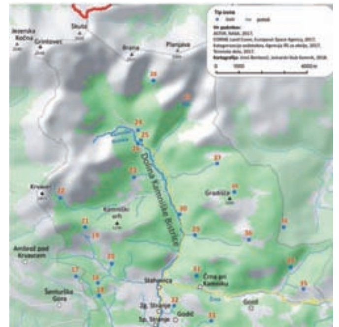
Karta izvirov na območju Kamniško-Savinjskih Alp

Izvire smo izbrali na osnovi vodnatosti, stalnosti, čistosti vode, uporabe v preteklosti in bližine že obstoječih pohodniških (romarskih, planinskih, drugih) poti. Tako v seznamu niso samo zelo vodnati, veliki izviri (npr. izvir Kamniške Bistrice, izvir pod Kraljevim hribom ...), ampak tudi izvirkčki, ki so bili že v preteklosti zaradi stalnosti, odlične vode in lokacije dobro poznani in pogosto obiskani (npr. Izvir v