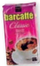
kava Barcaffe, 250 g