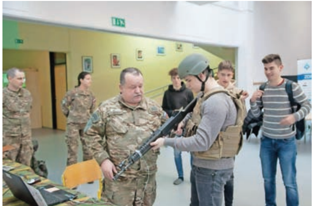
Dijakom se je predstavila tudi Slovenska vojska.

vpisali največ tri zelene študijske programe, pa bo potekal med 12. februarjem in 18. marcem.