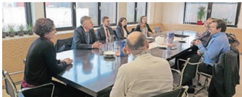
V CCN Domžale - Kamnik so gostili predstavnike Evropske komisije.