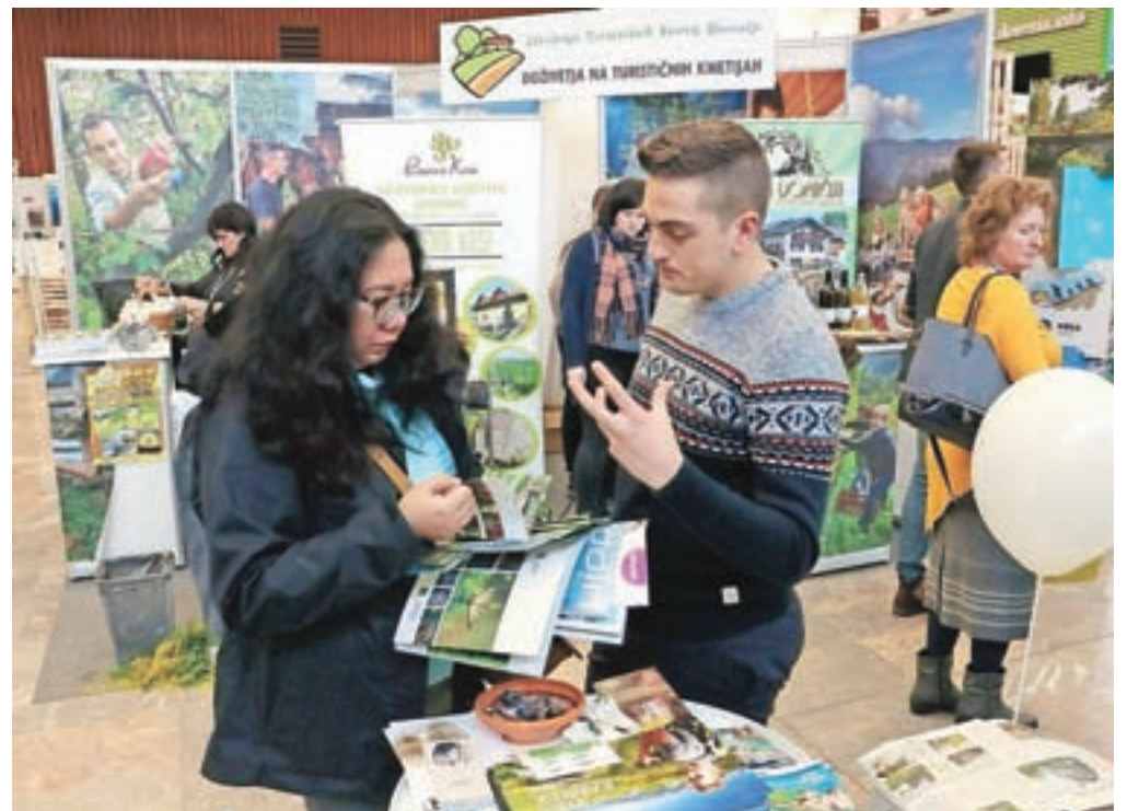
Predstavitve Kamnika kot turistične destinacije je na osrednjem turističnem sejmu pri nas požela precej zanimanja.

»Obiskovalci sejma so najpogosteje prepoznali Veliko planino in Arboretum Volčji Potok, največ zanimanja pokazali za Kamnik kot pohodniško destinacijo. Informatorji so na tem sejmu prvič delili tudi nov zemljevid pohodniških poti v dolini Kamniške Bistrice, ki so ga obiskovalci pohvalili in sprejeli z navdušenjem. Hkrati je bila to tudi priložnost, ko so obiskovalci sejma na enem mestu lahko spoznali vso raznoliko turistično ponudbo Kamnika. Na predstavitvi Kamnika so se sicer pogosto ustavljali posamezniki, ki jih zanima turistična ponudba kraja, kot tudi predstavniki turističnih agencij in šolarji.