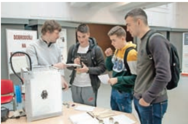
S Karierno tržnico na Gimnaziji in srednji šoli Rudolfa Maistra Kamnik dijakom omogočajo, da se približe spoznajo z nadaljnjim študijem in delom.

ližati izzive dela in študija ter odgovarjajo na številna vprašanja srednješolcev. Časa za prijavo je namreč vse manj. Prihodnji konec tedna bodo namreč fakultete in visoke strokovne šole organizirale informativne dneve, prvi prijavi rok, v katerem bodo dijaki lahko