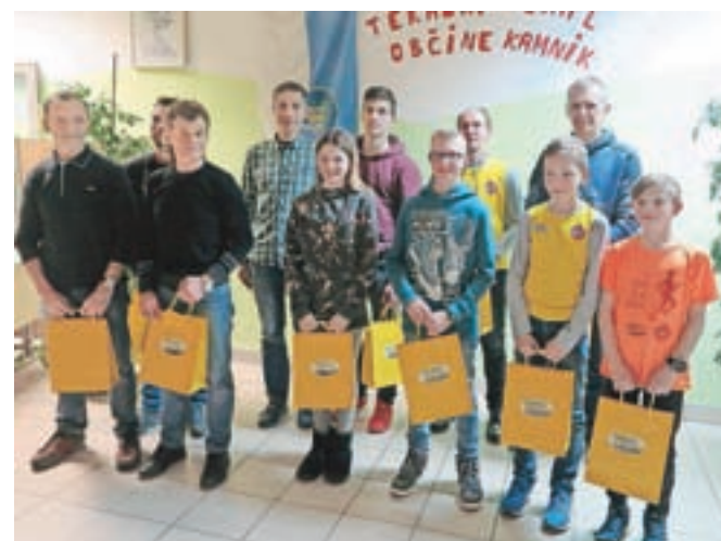
Udeleženci vseh sedmih tekov lanskoletnega tekaškega pokala Občine Kamnik