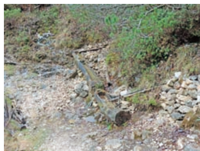
Izvir za Vrati

Povečan obisk turistov na Veliki planini in z njimi povezane dejavnosti bodo prav gotovo pomenile še večji pritisk na okolje in posledično na vodne vire. Čim prej je treba najti rešitve, ki ne bodo omejevale turističnega razvoja in obenem ohranjale naravno čisto. Rešitve vidimo v izgradnji kanalizacijskega sistema, ki bo dolgoročno ohranjal Veliko planino čisto, in tako Kamničane še vedno oskrboval s kvalitetno pitno vodo, kar je v tem času že ena redkih naravnih danosti, zato je ne smemo izgubiti. Pomembno vlogo pri oskrbi občanov s pitno vodo ima tudi upravljavec, v tem primeru Komunalno podjetje Kamnik, ki upravlja več kot 160 km primarnega in sekundarnega javnega vodovodnega omrežja v občini Kamnik in po Odloku o oskrbi s pitno vodo v Občini Kamnik oskrbuje in prevzema skrb nad pitno vodo, ki priteka iz naših pip. V letnih poročilih o zdravstveni ustreznosti pitne vode je večkrat opaziti, da posamezni vzorci niso skladni s pravilnikom o pitni vodi. Zakaj je to tako, bodo lahko vsaj delno odgovorili izsledki dosedanjih raziskav in nadaljnje raziskave, ki jih izvajamo člani Jamarskega kluba Kamnik.