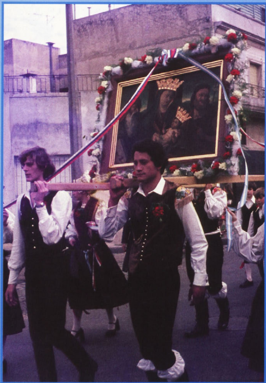
Svetogorska Kraljica med izseljenci