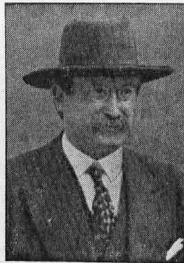
Sodrug Leon Blum

Stranke ljudske fronte so obdržale svoje pozicije. Socialisti so znatno napredovali. — Dne 17. t. m. bodo stranke ljudske fronte glasovale za