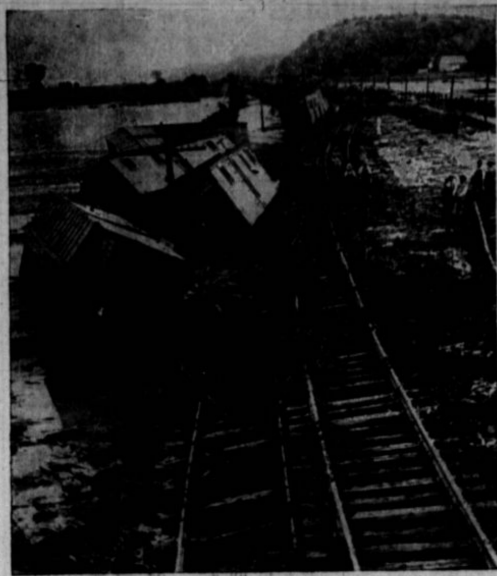
V Honey Creeku, Ia., so se dogodili veliki nalivi, ki so napravili mnogo škoda. Izprijedli so tudi železniško progo, kakor vidite na tej sliki.