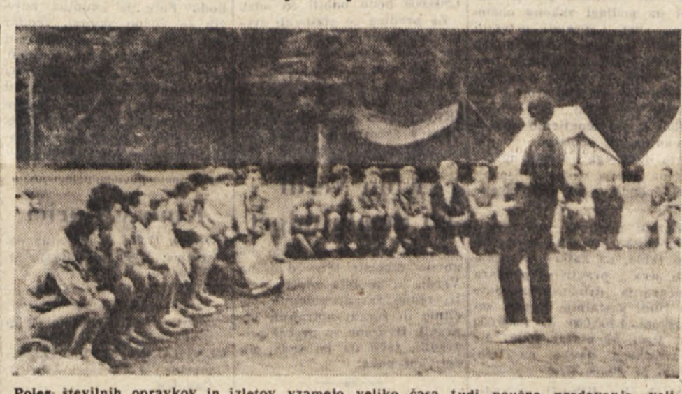
Poleg številnih opravkov in izletov vzamejo veliko časa tudi poučna predavanja, velikokrat pa se zberejo tudi k zabavi in petju

Ko pustiš za seboj zakajene Jesenice, kjer se med gorami noč in dan iz številnih dimnikov dvigajo gost dim, si tako rekoč že na cilju: še osemnajst kilometrov poti in pred teboj je Gozd Martuljk. Ni to nikakoli mesto, skoraj niti vas ne. Le nekaj čudovito planinskih hiš, lep hotel, nekaj manjših domov in kmečkih hiš. Vse pa je tako lepo in čisto, tako čudovito, kot nisi bili le na Gorenjskem. In čeprav ni bilo našim gozdovnikom že prej objavljeni, da jih bomo obiskali, bi si bili prišli ponovno ogledat ta čudoviti kotiček severne Gorenjske.