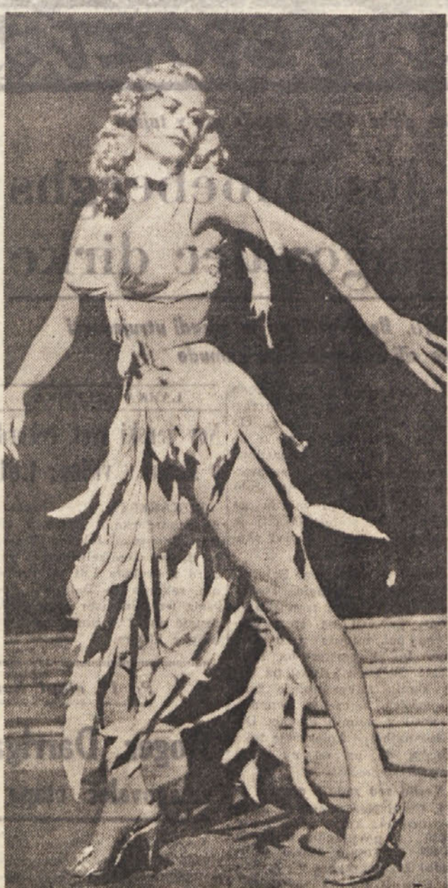
Anita Ekberg preizkusa svoje plesne sposobnosti

Grob je bil v sadovnjaku, v predmestju. Ozka steza se je tod začela širiti, kot se širi prodnato korito potoka, ki teče mimo otoka. Leseni križ so leta že razmajala, crke R.I.P. pa je dez izbral. Jekleni šlem je bil nekoliko ukrivljen... jokajoci smeh na obrazu Smrti je bil kot stražar. Vrček za zalivanje, grablje in lopata so ležali ob grobu. Dekle, po imenu Karla, je spustila na tla kosarico, v kateri je bilo nekaj cvetja, ki ga je nameravala posaditi na grob. Nato se je obrnila k spremiljevalcu, k mladeniču, na katerega obrazu se je razbiral dolgočasje in ki se je med opazovanjem tega trudi, da bi si prizgal cigareto, ki mu je visela iz kota ust.