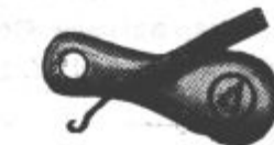
Zlica in kljukica Din 4.—.

Otroški visoki čevlji iz rujavega ali črnega boksa in trpežnim usnjatim podplatom. Isti v raznih kombinacijah za isto ceno.