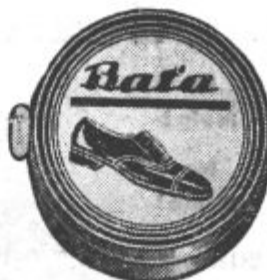
Snažite svoje čevlje z našo kremo 1 škatljica Din 5.—.

Za gospodinje: Za vsakdanjo uporabo praktičen, močan in udoben čevlji iz boksa, ki je potreben vsaki gospodinji.