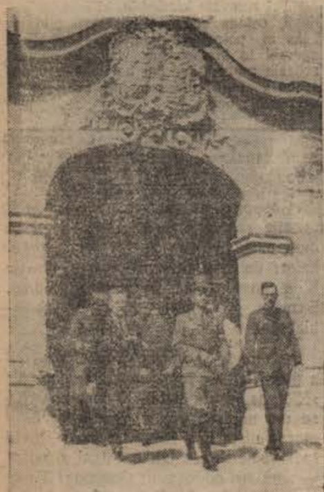
Gauleiter je pravkar zapustil grad ter se podal na zborovališče