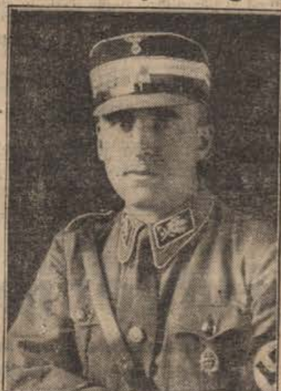
Führer je imenoval SA-Gruppenführerja Siegfrieda Kasche za prvega poslanika pri vladi neodvisne Hrvatske.

je z dimom ves prostor. Skorja, ki se nabere, na koži prebivalcev šotora, ščiti ljudi pred piki mušic in pred mrzom.