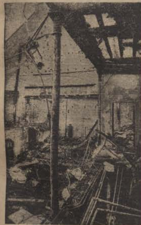
Dvorana Sv. Jurija v Londonu. V tej dvorani so prenašali radijske koncerte. Sedaj je samo še kup razvalin.