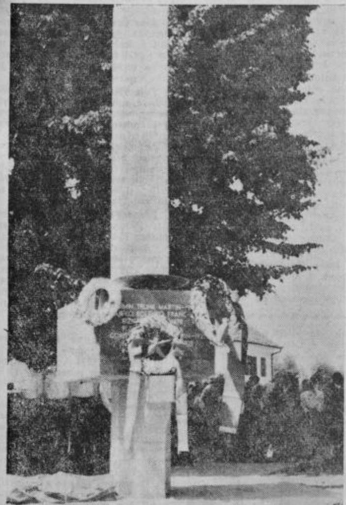
Spomenik padlim borcem in žrtvam fašističnega nasilja v Gorišnici

V najusodnejših dneh smo se dvignili na klic Komunistične partije, večali smo borbeno skupino in prerasli v monolitno silo delovnih množic. Te so se