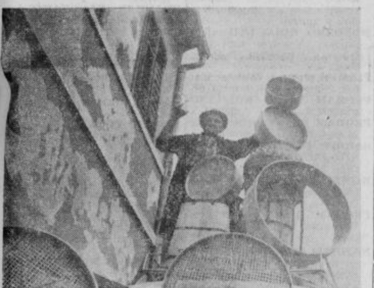
•Ribničani Urban, po celem svetu znan...« je obiskal ob zadnjem sejmu Ormož in je poskrbel poleg dobre prodaje suhe robe tudi za zabavo ljudi, ki so prišli do njegovega prodajnega mesta. Zapel je pesem o Ribničanu Urbanu, ki se mu je dobro podala, zraven pa je še povedal kakšno smešno.

upoštevati pomen besed v direktnem smislu. Na mesto inkvizitorjev so stopili sedaj zastopniki mnogostevilne sekte zaklinjalcev. Težko je verjeti, vendar dejstva ostajajo dejstva v zahodni Nemčiji parazitsko živi blizu 10.000 čarovnikov na račun nezabranosti in praznoverja ljudskih množic.