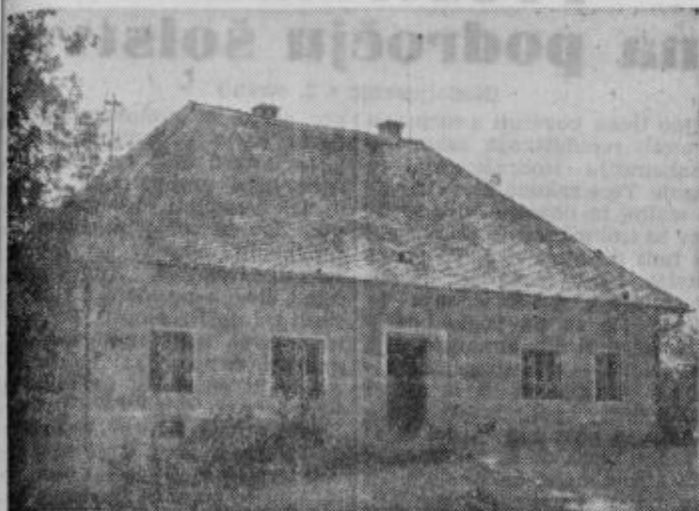
Zgoraj in spodaj: zgradbi, v katerih je pouk poleg šolskega splotja

sredstev namensko izločil določeno vsoto za gradnjo nove šole v Miklavžu. Tudi občinska skupščina je prispevala svoje. Projekt, ki je izdelan za dozidavo šole, predvideva štiri učilnice, dva kabineta, delavnico za tehnični pouk, šolsko mlečno kuhinjo z jedilnico, ki bo hkrati služila za pionirsko sobo. Načrti so zelo skromni. Ob 17 oddelkih bi imela šola