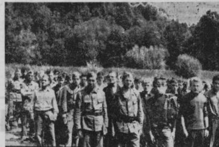
Četrta izmena mladincev PVV pred razpustom