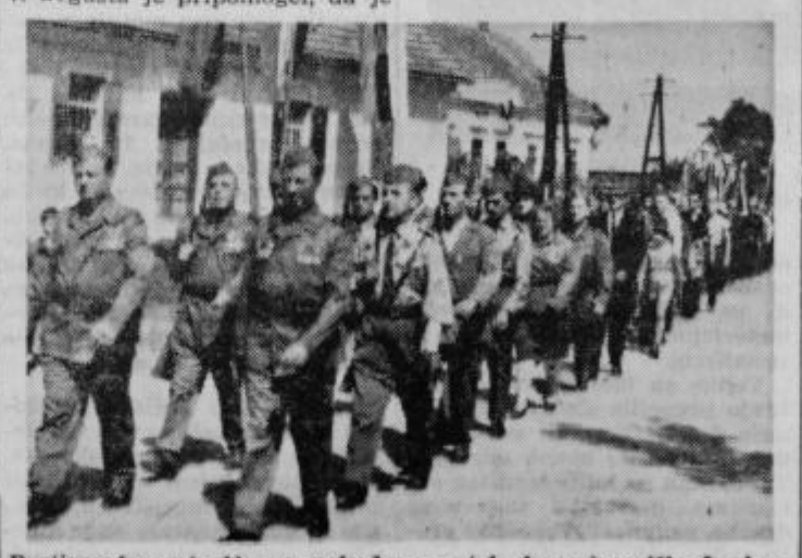
Partizanska patrulja po pohodu po poteh slovenjgoriške Lackove čete in kurirske postaje TV 14 S

Izredno lep dan letošnjega 7. avgusta je pripomogel, da je