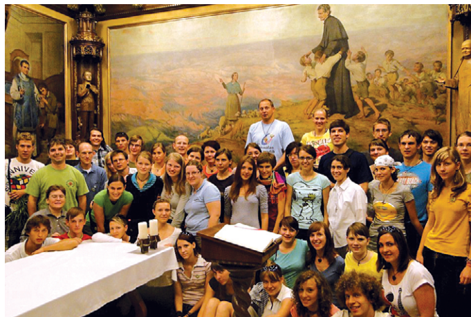
V »don Boskovi sobi« v salezijanskem zavodu v Barceloni