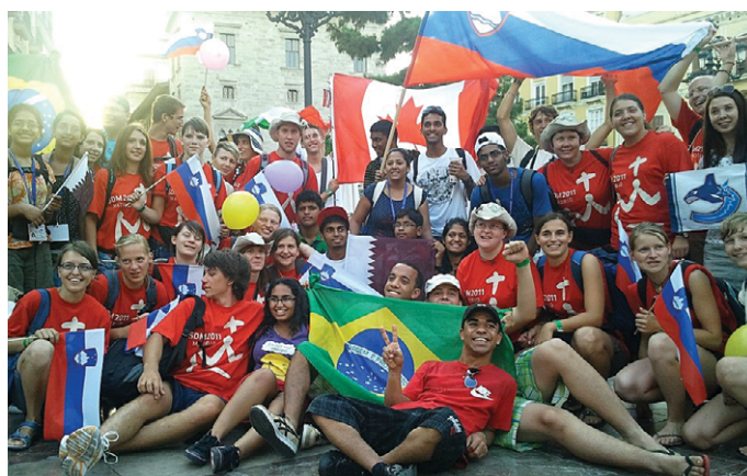
Fotografiranj s skupinami mladih iz drugih držav ni manjkalo ...