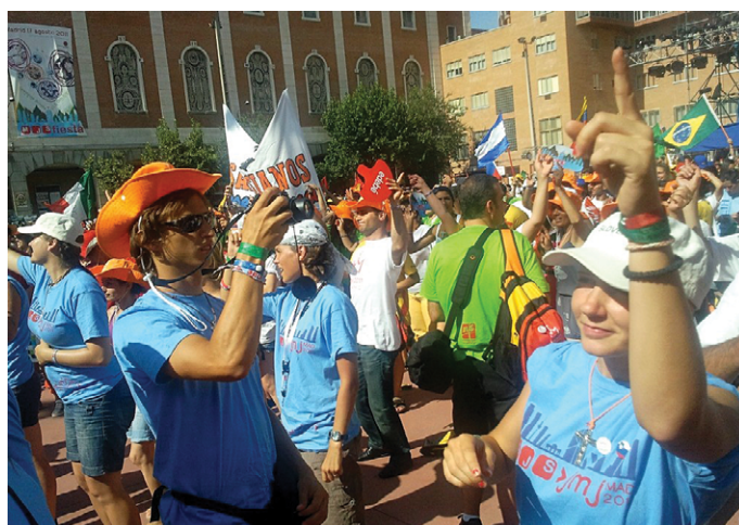
Praznovanje na srečanju Salezijanskega mladinskega gibanja