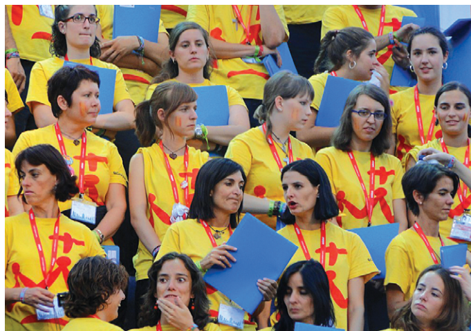
Znani obrazi med dvestočlanskim pevskim zborom SMG