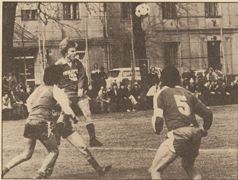
Kljub trudu ni uspelo zmagati

P.S: Daljše poročilo bomo objavili v naslednji številki Našega tedičnika!