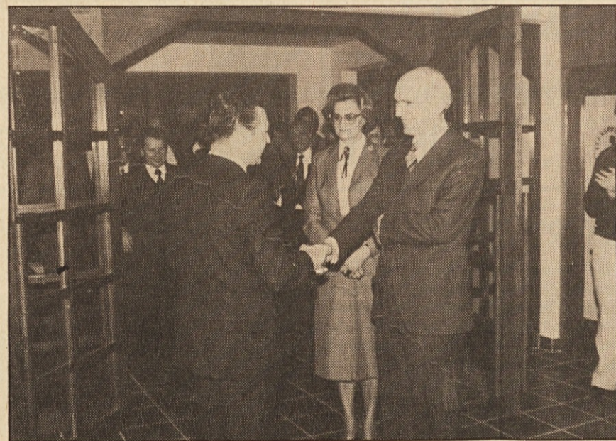
Prisrčen sprejem v Domu v Tinjah.

ga določena skupina, npr. manjšina, iz gotovih razlogov ne more upoštevati („Am Bekenntnis soll man Freude haben“) in končno: srečali smo zveznega predsednika, ki je v razgovoru z avstrijsko televizijo poudaril, da Avstrija ni zadostno rešila manjšinskega vprašanja. Prišel je k nam uradno in kot človek, kateremu ležijo manjšine pri srcu.