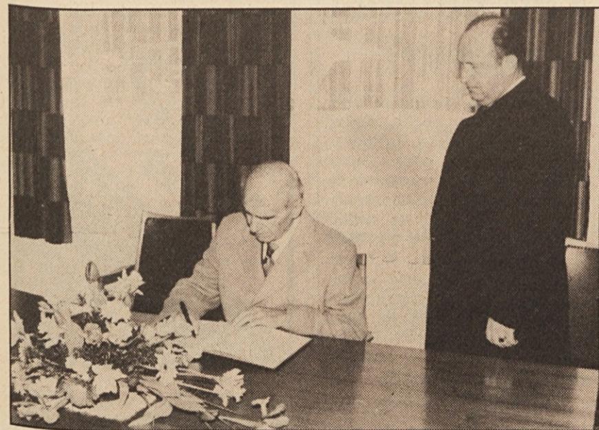
Kot prvi se je vpisal v spominsko knjigo selske občine zvezni predsednik dr. Rudolf Kirchschräger.

(Zvezni predsednik dr. Rudolf Kirchschräger v Selah)