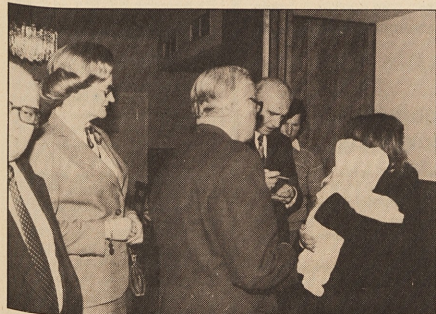
Zvezni predsednik v pogovoru z mlado mamo, ki ga prosi za pomoč.