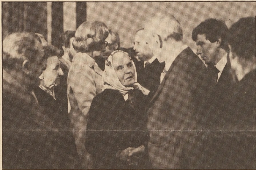
Zvezni predsednik se je rad pogovarjal s selskimi domačini, ki so ga pri zadnjih volitvah široko podprli.