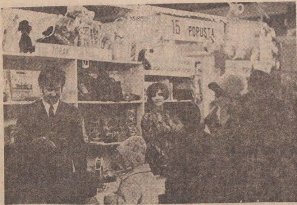
Novoletni sejem na Gospodarskem razstavišču