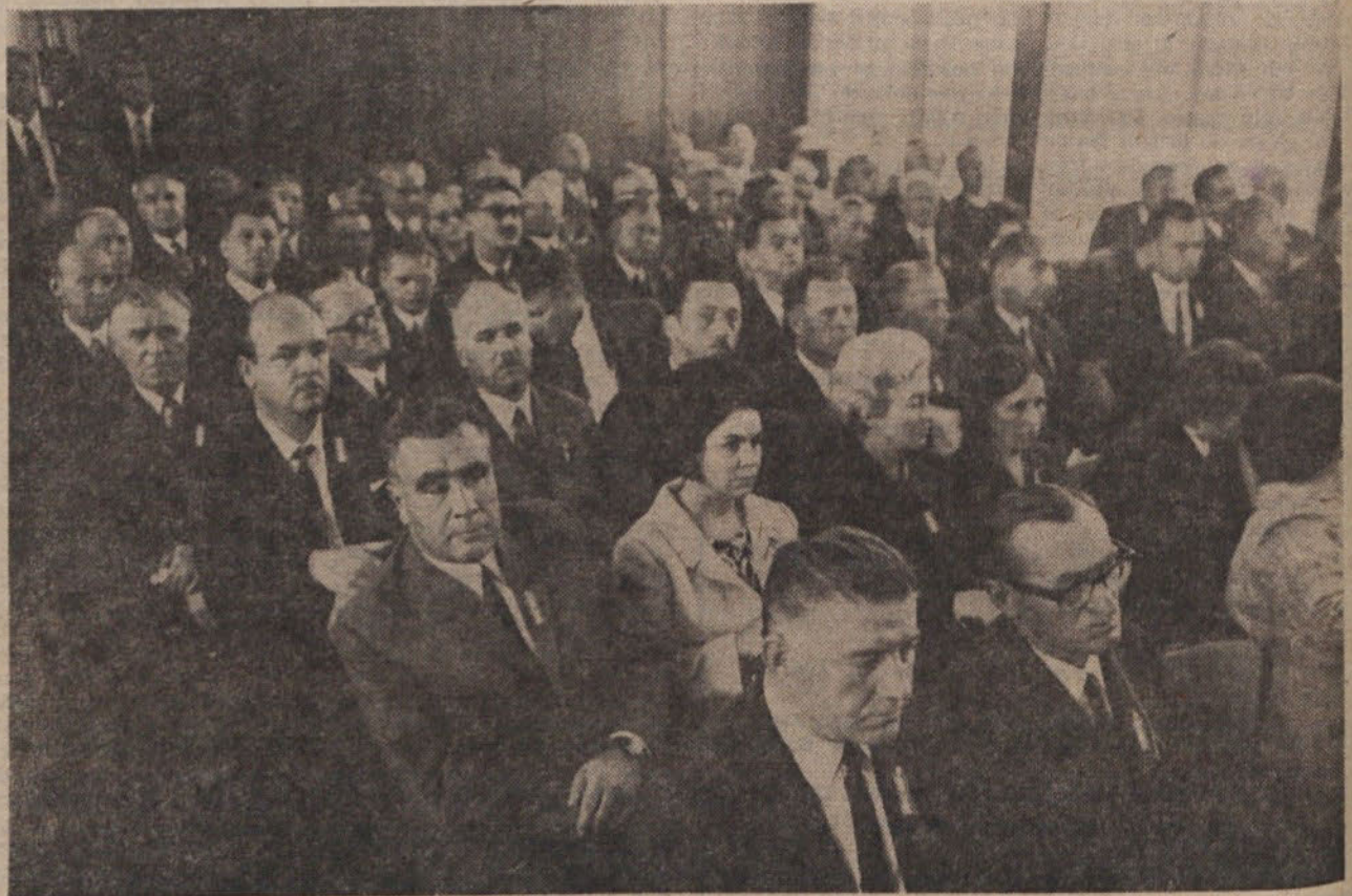
Delegati na kongresu Zveze združenj borcev Jugoslavije v Ohridu