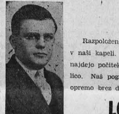
LOUIS FERFOLIA SLOVENSKI POGREBNIK 3515 E. 81st St. Michigan 7420 —Dnevna in nočna postrežba—

Naročite vaše obleke in suknje pri nas. Največja zaloga vzorcev Chas. Rogel 6526 ST. CLAIR AVE.