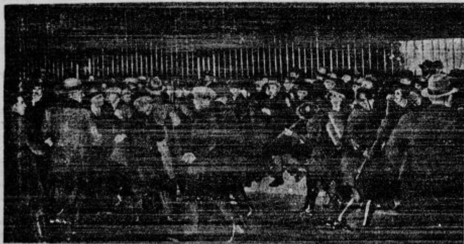
Tudi francoskim kmetom trda prede. Te dni se je v Parizu zbralo na veliko zborovanje nad 10.000 kmetov. Ker so glasno dajali duška svojemu nezadovoljstvu, je policija s silo razgnala njihov demonstracijski sprevod.