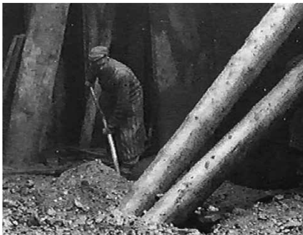
Delo na predoru.