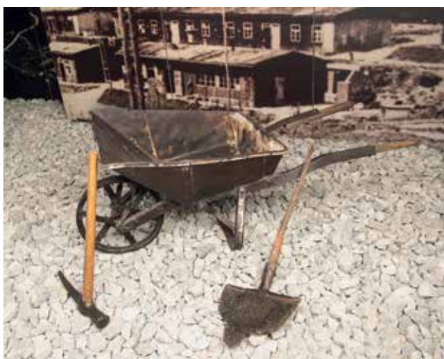
Orodje, ki so ga vsakodnevno uporabljali interniranci.