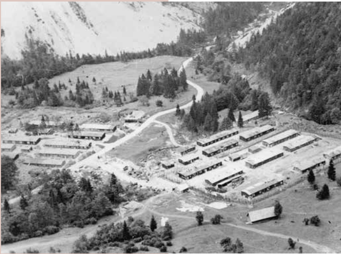
Fotografija dograjenega koncentracijskega taborišča Ljubelj jug.