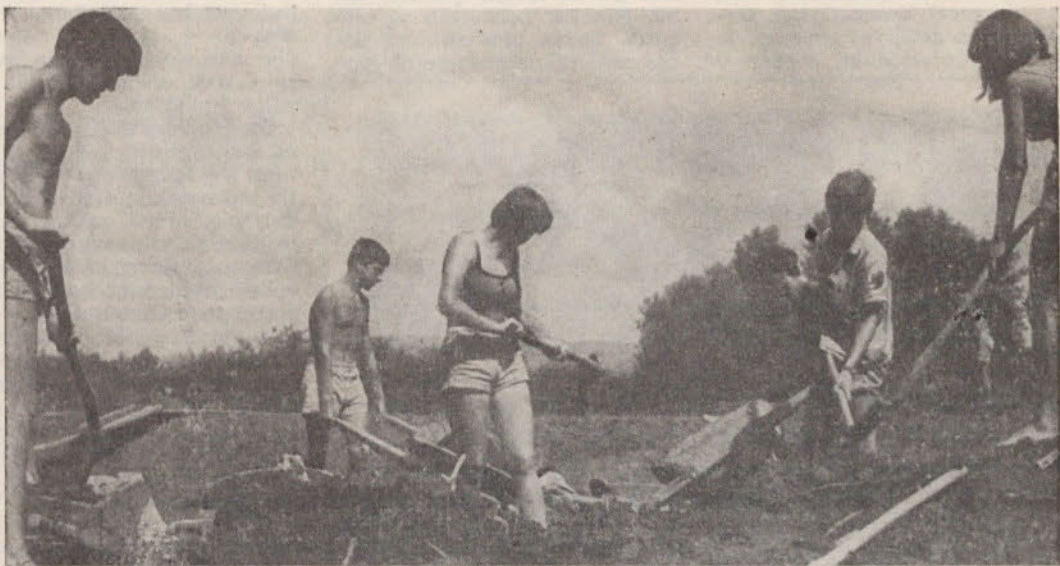
Brigadirji ljubljanske delovne brigade »Ane Zihlerlove«, ki jih vidite pri delu, so si priborili največje priznanje na delovni akciji »Sava 66« — trak sedem sekretarjev SKOJ

Podatki kažejo, da so ljubljanski brigadirji dosegli zares lepe uspehe. Tako so npr. v prvi dekadi presegli načrt za 142 % in imeli opravljenih 95 % učinkovitih delovnih ur (v nadaljevanju ef. del. ur), v izredni dekadi za 167 % in 99 % ef. del. ur, v drugi dekadi pa 148 % in 99 % ef. del. ur, kar znese v povprečju 156 % preseženega načrta in 98 % ef. del. ur.