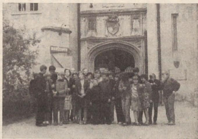
Z izleta mimo Brna v Lednice, češki Schönbrunn. Posnetek je narejen pred vhodom v muzej

Na Češkem smo bili sprejeti zelo pristrčno in se tak odnos ni spremenil do zadnjega dne. Skoraj se bojim, da češki učenci niso bili deležni tolikšne vsestranske pozornosti. Seveda prav do vsake podrobnosti ni šlo vse v najlepšem redu, toda to so prve izkušnje, na katerih sodim, da lahko samo naprej gradimo in poglobljamo naše stike. Kako bo prihodnje leto? Morda bi kazalo skrajšati čas izmenjave, organizacijsko jo poenotiti pa spet prilagoditi vsak svojim specifičnostim. Važno pa je, da so bili tako češki kot naši učenci