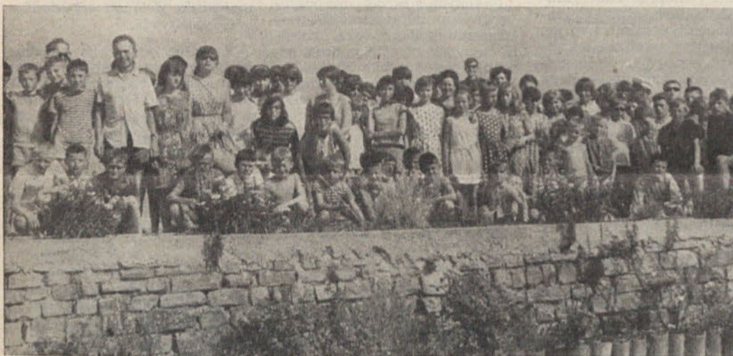
Češki in naši pionirji na skupnem letovanju v Pacugu