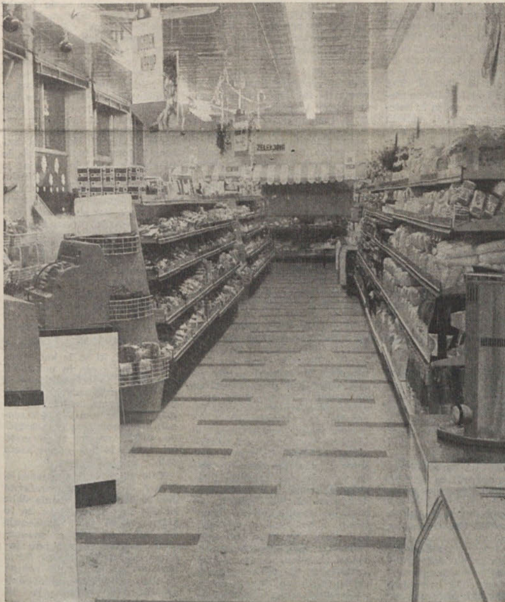
Mercatorjeva samopostrežna trgovina ob Pokopališki cesti

ščine Ljubljana Moste-Polje Pavla Šefica, ki nas je na kratko seznanil s perspektivami razvoja trgovine na območju občine: