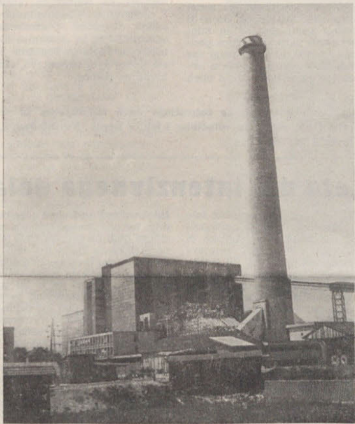
Pogled na toplarno z jugovzhodne strani. Na levi strani, pri dnu dimnika, se vidijo čistilne naprave

Občane, ki vstopijo na avtobusni postaji, kjer je vitrina, pa je nemalo začudilo, da se nihče ni spomnil te vitrine prekriti s streho in tako urediti hkrati vsaj zasilno avtobusno postajo. Bržkone stroški za to streho ne bi bili tolikšni, da bi se je ne splačalo urediti? Kaj menite?