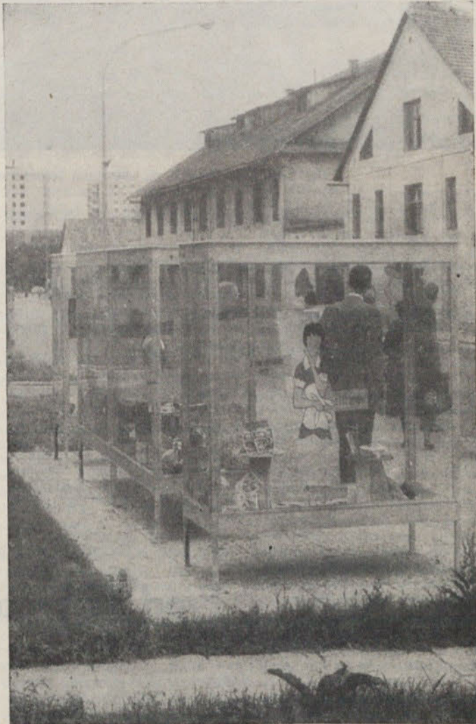
Pogled na vitrine v katerih razstavljajo nekatere moščanske delovne organizacije svoje proizvode. Le škoda je, da vitrine niso pod streho

Ta stalna razstava je vsekakor koristna novost za moščanske potrošnike, ki vsakodnevno hodijo tod mimo. Trenutno v vitrinah razstavljajo naslednje gospodarske organizacije: Kolinska, Saturnus, Teol-Oljarna in GIP Gradis.