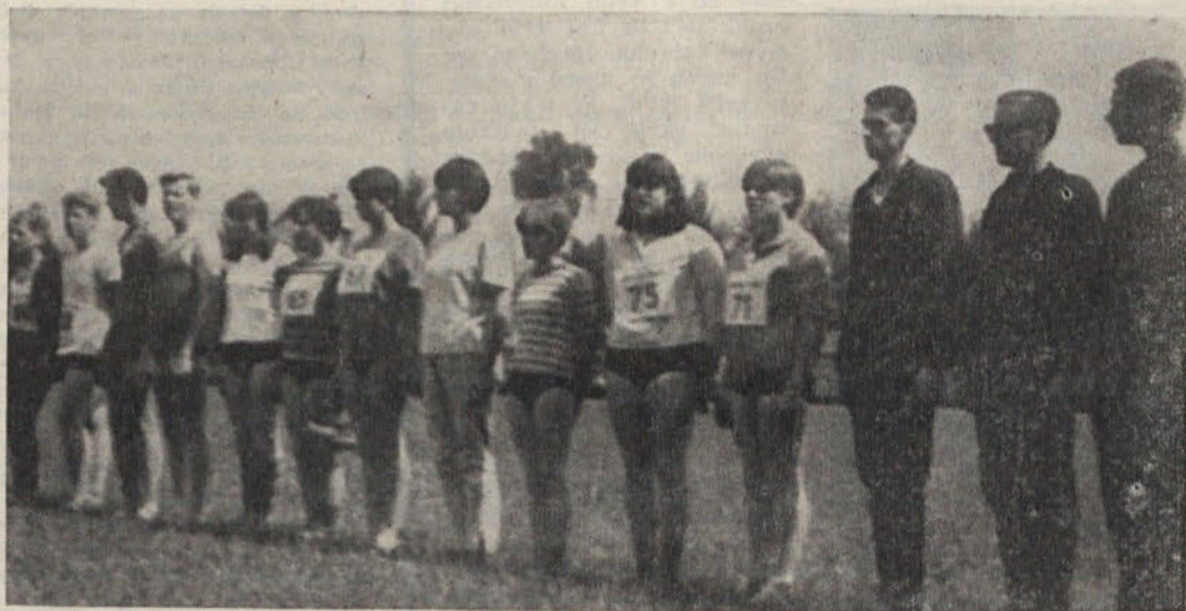
Začeli so iz nič, toda že po enem mesecu obstoja so se prebili v finalni del republiškega prvenstva za mlajše mladince. Med sto nastopajočimi edino naši atleti niso imeli trenirk

Rokometni klub se je pripravil na novo sezono morda najresneje. Skupne priprave, ki sta jih imeli tako moštvo kot ženska ekipa, so bile uspešne kot še nikoli doslej. Udeležba igralcev na pripravah je bila 100%. Startajo torej z močno voljo — toda s starimi težavami. Moški vsake pol leta menjajo tretjino ali celo polovico ekipe — vse zaradi odhoda v JLA. To traja sedaj že tretje leto in nič ne kaže, da bi se kmalu ustavilo. Zato pripravljajo novo generacijo mladincev, ki naj bi skupaj nastopili svoj igralski staž v prvi ekipi. To je tudi edina rešitev. Ženska ekipa bo