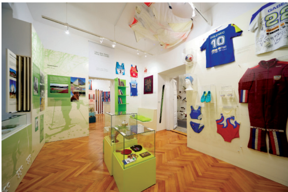
Postavitev tretje sobe.