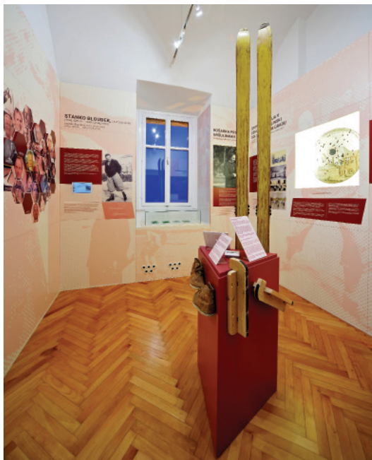
Postavitev prve sobe razstave Šport na Loškem .

Pri postavitvi športne zbirke smo izhajali iz prostorskih možnosti. Izkoristili smo vsako okensko nišo, kote in stene, da smo smiselno umestili panoje z besedili ter vitrine s predmeti.