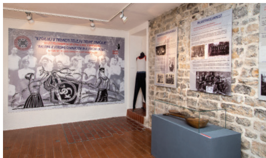
Razstava Vzgajaj v trdnem telesu trdne značaje – 110 let Telovadnega društva Sokol v Škofji Loki .

Poleg razstav smo v muzeju pripravljali tudi predavanja (Telovadno društvo Sokol, Razvoj Sokolov in Orlov v Škofji Loki). V letu 2017 smo sodelovali tudi pri projektu Umetnost, šport in dediščina , ki so ga organizirali Ministrstvo za kulturo RS, Ministrstvo za izobraževanje, znanost in šport RS (Direktorat za šport in Urad za razvoj izobraževanja), Zavod RS za šolstvo, Olimpijski komite Slovenije – Združenje športnih zvez in Fakulteta za šport Univerze v