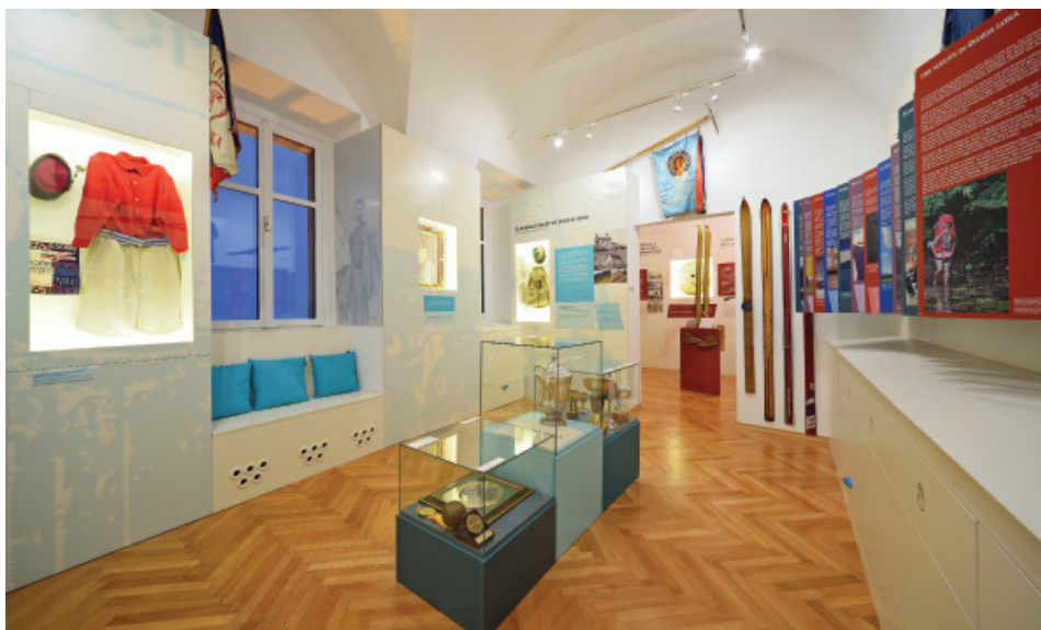
Postavitev druge sobe razstave Šport na Loškem .