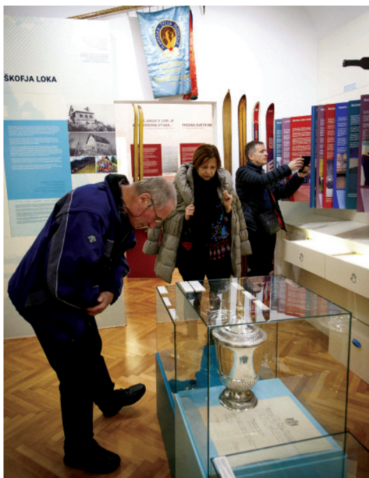
Obiskovalci so si na odprtju z zanimanjem ogledali razstavo.

Z odprtjem stalne razstave pa športna zgodba še ni zaključena. Delo Odbora za muzej športa se bo tudi v prihodnje nadaljevalo z zbiranjem gradiva. V Loškem muzeju bomo športne muzejske in digitalne vsebine nadgrajevali z novimi, tako preteklimi kot aktualnimi dogajanjem, in jih v različnih oblikah (občasne razstave, vitrine meseca, pogovorni večeri) predstavljali obiskovalcem.