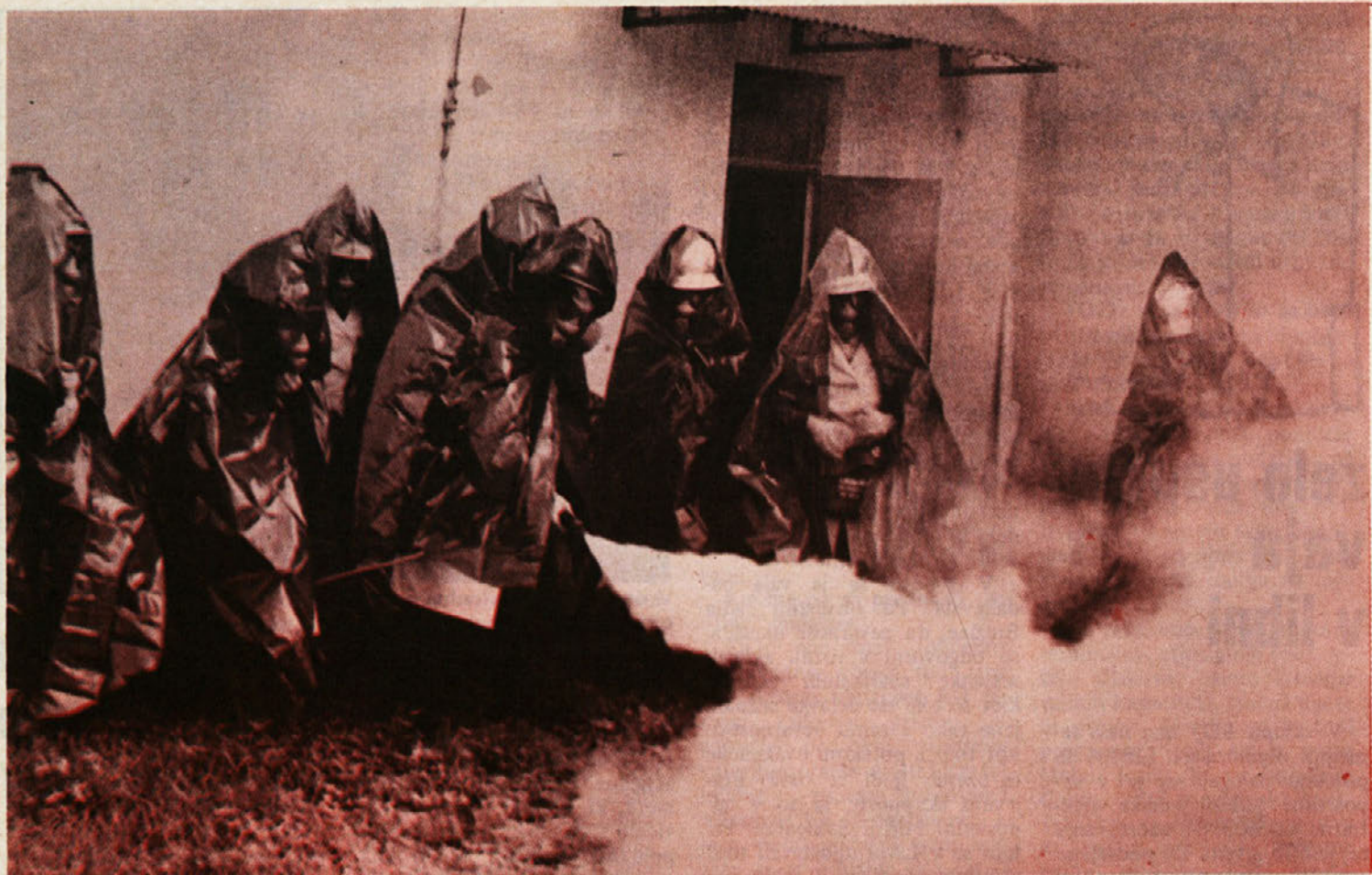
Gasilke iz Libne pri delu, ki je v taki opreми še mnogo zahtevnejše, kot sicer (vaja NNMP – POSAVJE '82).