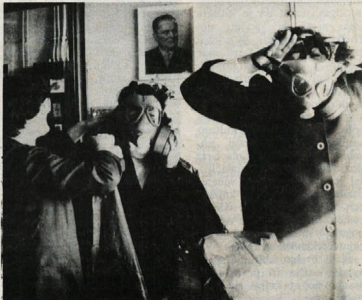
Pripadnice NZ se pripravljajo za svojo nalogo.