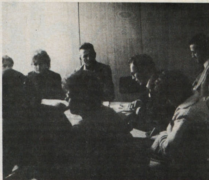
V času vaje so se redno sestajali vsi organi in družbenopolitične organizacije. Na posnetku pa sta tudi republiška opazovalca vaje.

V soboto se je vaja nadaljevala. Po obvestilu radia Brežice, da nevarnost narašča, so odgovorni v tozdu sklicali sestanke sindikalnih skupin, kjer so bile vse delavke seznanjene tako s samo nevarnostjo, kot tudi s potekom evakuacije ogroženih ljudi iz tistih krajevnih skupnosti, ki so v neposredni bližini nuklearke. Pri tem so v Libni upoštevali tudi psihično napetost, ki lahko nastopi v podobnih trenutkih. Obvestili so delavke, ki imajo na ogroženih predelih svojce, kako je potekalo evakuiranje, kje se nahajajo njihovi domači in podobno. Ko je prišlo do zaklanjanja, so delavke Libne disciplinirano in hitro odšle v – zaklanjalnik, v za to pripravljen prostor, ki so ga pred tem pripadniki NZ hermetično zaprli. Objekti so bili varovani, v pripravljenosti pa so bile gasilke in enota PMP. Po obveznem zaklanjanju je ekipa gasilk pogasila požar, ki je nastal na električni inštalaciji, ekipa PMP pa je nudila prvo pomoč štirim delavkam, med temi sta bila