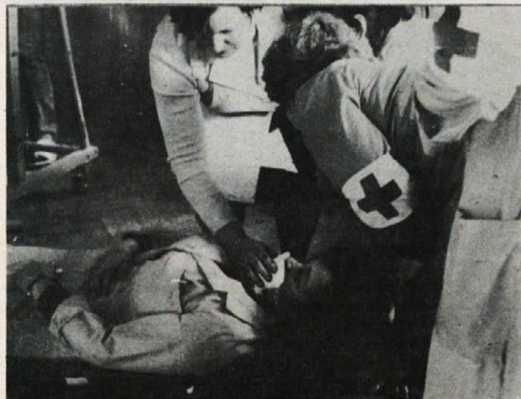
Ekipa PMP je imela veliko dela, znajti pa se je bilo treba tako pri „navadni“ poškodbi, kot v primeru, ki je zahteval dekontaminacijo.

Po končani akciji so v Libni temeljito analizirali potek te, ocenili svoje delo in prizadevanja in poiskali vzroke za, sicer manjša odstopanja, ki jih brez konkretne vaje ni bilo niti moč predvideti. V poročilu pa je zabeleženo med tem tudi premajhna povezava na vseh ravneh s krajevnimi skupnostmi, še nepopolna materialna opremljenost, kar pa je predvideno s srednjeročnim planom ter nujnost še nadaljnjega usposabljanja enot Civilne zaščite. Ob naštetem pa velja še enkrat poudariti, da so delavke Libne ter vodstvo vaje v tozdu z vso resnostjo in odgovornostjo izvajali dane naloge.