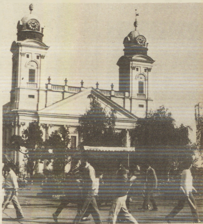
V Debrecenu stoji tudi največja reformatska cerkev na Madžarskem.