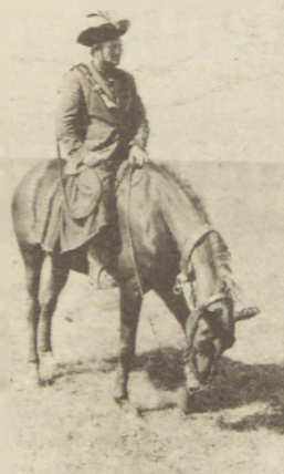
»Čičko«, konj in pusta

Ura je tri. Noč enega zadnjih avgustovskih dni. Pred nekaj urami je še deževalo. Hladno je. Na poti iz Murske Sobotice preko Dobrovnik, Prosenjakovec do Hodoša se avtobus napolni. Zamudna procedura omogoči, da nas na meji pričakajo prvi jutranji žarki. Še zadnji pogled na domačo zemljo. Dobrodošli na Madžarskem!