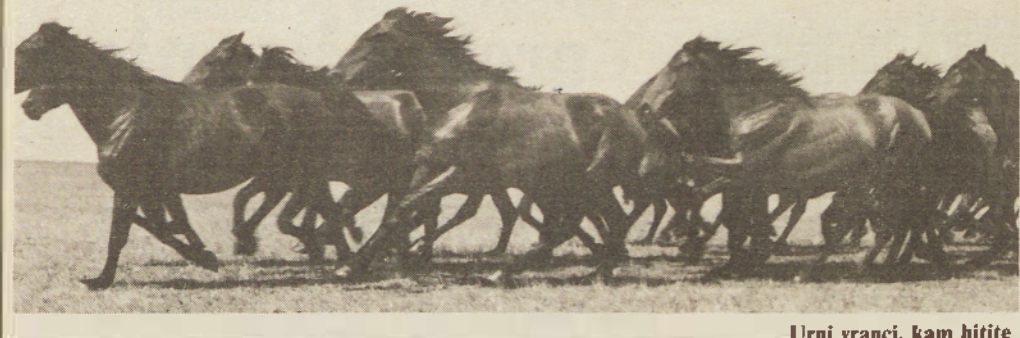
Urni vranči, kam hitite

Nedaleč stran stoji muzej Deri, v katerem so razstavljene arheološke, etnografske in še nekatere druge zbirke, zgodovinski