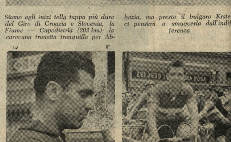
Siamo agli inizi della tappa più dura del Giro di Croazia e Slovenia, la Fiume - Capodistria (202 km); la carovana transita tranquilla per Abazia, ma presto il bulgoro Krstoec ci penserà a smuoverla dall'indifferenza.