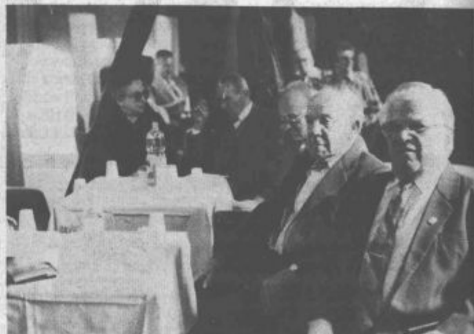
Na redni letni skupščini so se borci zbrali v četrtek, 11. aprila. Bilo so kritični do razmer v katerih živijo danes.

kaj jim prinaša jutrišnji dan, in tudi, kot se je izrazil, zaradi stik "odhajajoče" generacije, ki postaja breme za državo, kljub temu, da so v svoji aktivni dobi veliko prispevali k tej družbi. Še posebej, jedeljal, k stanovanjski izgradnji. Pa danes, je vprašal. Danes je država stanovanja prodala. Kje je denar od prodaje? Gotovo je, da se v nova stanovanja ne vrača. Če bi se, ne bi bilo toliko mladih brez njih. Tudi certifikati, je rekel, vsak dan izgubljajo na vrednosti, v Sloveniji pa kot da bi radi, da nam spet