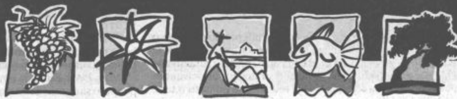
dnevi refoška dnevi mediterana dnevi solinarstva dnevi ribištva dnevi oljkarstva

Posebni popusti za upokojujence. Posebna ponudba za družine.