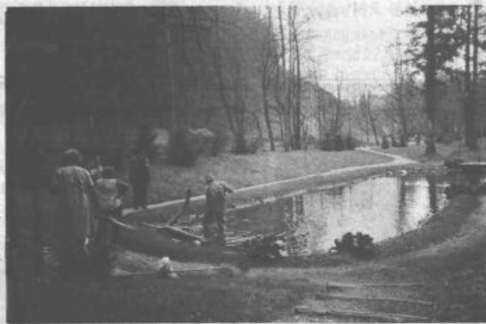
Mnogi so krepko poprijeli za delo in gaj se dolgi zimi navkljub že bohoti v svoji pomladni lepoti

Zelo odmevno celodnevno prireditev načrtujejo ob kresu 22. junija, med ostalim, kar se bo vse leto dogajalo v gaju in okrog njega, pa razumljivo kaže omeniti vsakoletno jesensko mednarodno razstavo, za katero že imajo zagotovilo bistveno večjega števila razstavljalcev kot na prejšnjih izvedbah in že te so vedno navdušile. ■/p