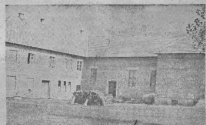
Združni dom v Žerovincih

pa je stranišče neprimerno urejeno in ne ustreza higieniškemu minimumu. Okrog doma so kupi gromača, ki so bili pred leti navaženi in so sedaj porasli s travo. Dvoriščna stran je neizravnana in po dvorišču so razmetana drva.