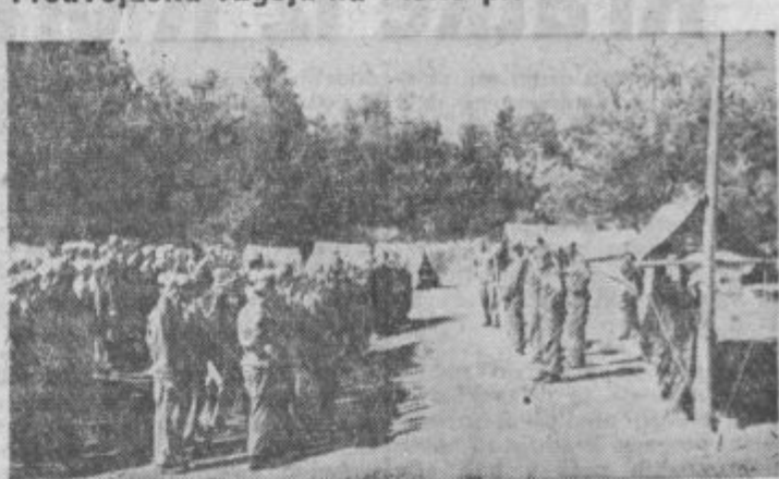
Te dni se konča tečaj predvojaške vzgoje mladincev s področja občine Ormož. Okrog 300 tečajnikov je bilo pod šotori na Otoku, kjer so dobili osnovno znanje za bodoče službovanje v JLA.