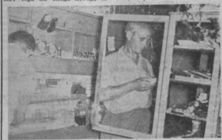
Sanitarni inšpektor pri svojem delu v Ivanjkovih

inspektor, so kaznovani poslednje gostiln in trgovin. Pregled trgovin in gostiln se je pričel v Ivanjkovih, v gostišču Jeruzalemcem in Ivanjkovih. Ob vhodu v gostišče ni odstranjena trava. Notranjost gostilne je bila lepo urejena in stene so bile okrašene s privlačnimi slikami. Za točilno mizo je bila gostilničarjeva žena in je imela svojega nedoletnega otroka v sosedni gostilniški sobi, ki je bila na stečaj odprta.