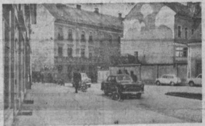
Prostor pred »Belim križem« je dobil z zgradbo Merkurijeve »Opreme« novo lice