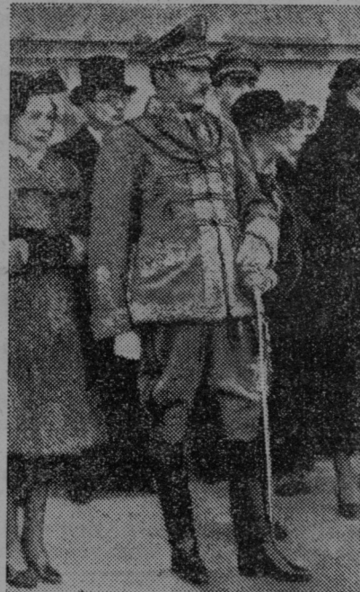
Albanija je slavila pred kratkim 25 letnico samostojnosti. Na sliki vidimo albanskega kralja Zogu pred svojim gradom v Tirani med veliko vojaško parado.

najbolje dokazala, ko je bila na vladi. Toda po vladi hrepeni, kakor počena zemlja ob suši hrepeni po dežju. In ker se ta želja, ki je prva in vodilna želja, noče uresničiti, je vsa nesrečna in neutolažljiva. JNSarski demokratizem pa je v dejanstvu istoveten z najgršim nasilništvom, ki ga je uganjala JNSarska diktatura. Ako se trudi »Domovina«, da bi oprala JNS pred našim ljudstvom, se trudi zaman. Zamorca ni mogoče oprati, da bi postal bel.