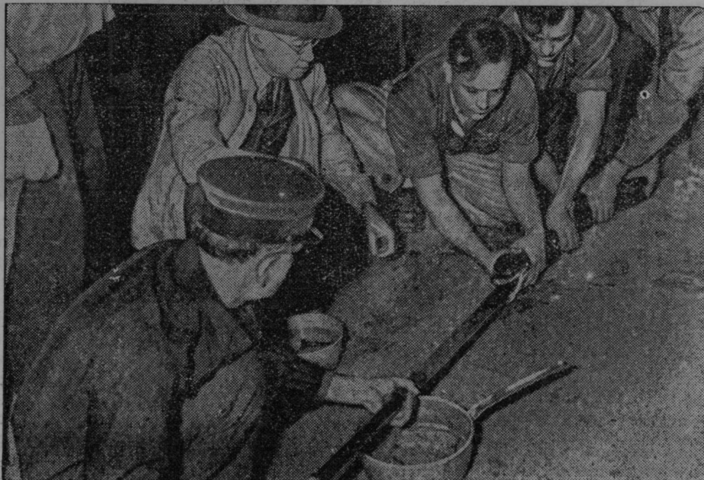
V živalskem vrtu v Čikagi v Ameriki krmijo nasilnim potom orjaško kačo, ki se brani hrano.