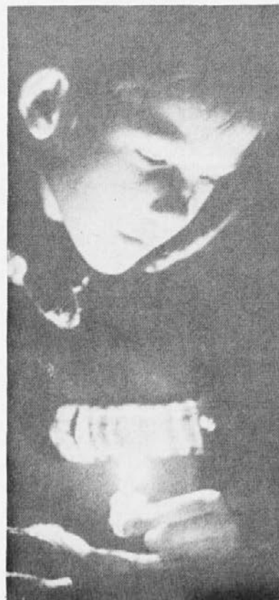
Tudi skromna svečka prinaša toplino božiča . . .