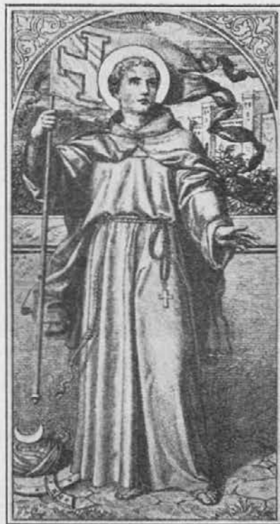
Sv. Janez Kapistran, čegar spomin se obhaja 28. marca.

Zato pa proč s polovičarstvom, ki je tako sramotno in zaničevalno! Otresimo se ga popolnoma ter bodimo celi možje in odločni in kremeniti značaji!