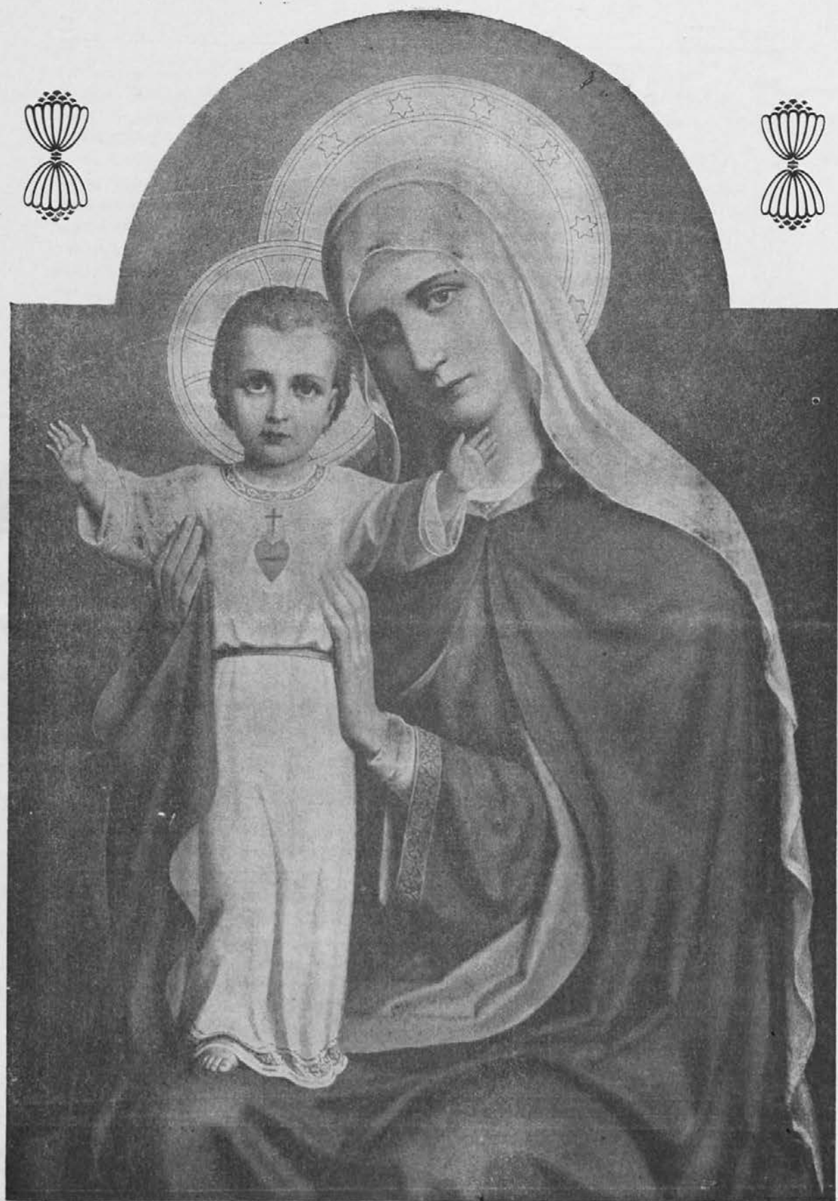
Marija, mati našega Izveličarja.