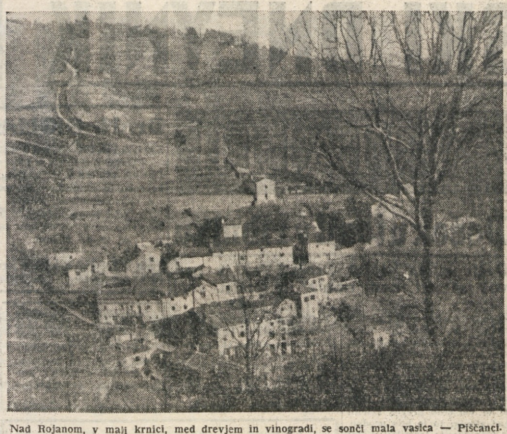
Nad Rojanom, v mali krnici, med drevjem in vinogradi, se sonči mala vasica — Piščanci.