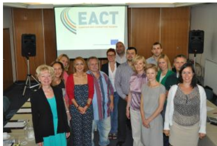
Udeleženci delavnice EACT

Ljubljana – V organizaciji Komisije za preprečevanje korupcije je v sredini avgusta potekala peta delavnica tristranskega projekta EACT na temo medijskih kampanj na področju preprečevanja korupcije.