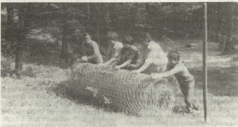
Okolje so zaščitili z zaščitno mrežo