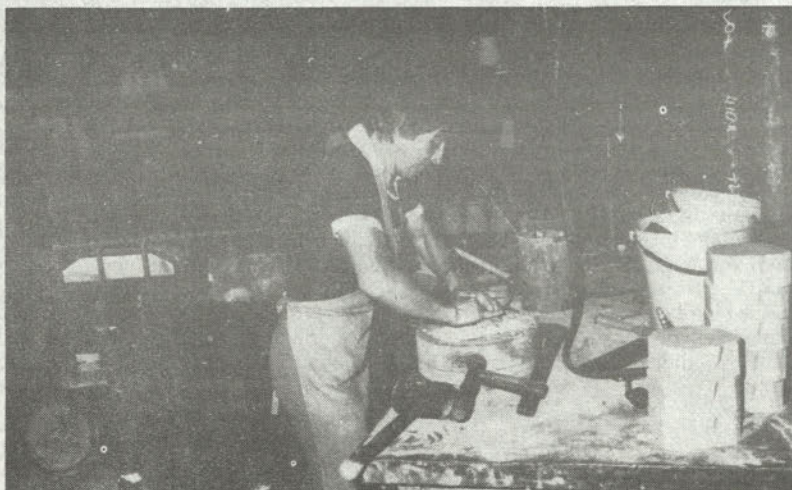
Sodelavka pri oblikovanju peščenih jeder v jedrarni

Zaradi neuspelega referenduma o reorganizaciji so v planu delovne skupnosti podane kot ena DS brez bivše DS za komercialne posle, ki se v planu prikazuje kot TOZD V – trženje.