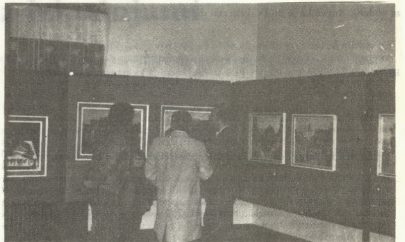
Razstavljeni dela likovnih amaterjev SOZD SŽ