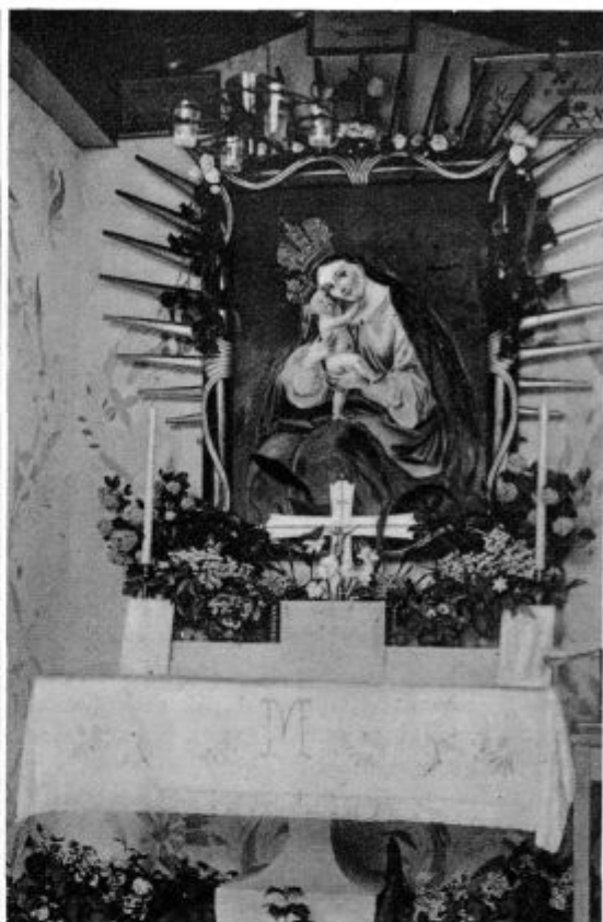
Blugoslov Marijine kapelice na polju pri Preski

prej odbrane priče. Upam, da to pojasnilo zadostuje, da pustimo Bogu, naj dela, kakor sam hoče in naj se razodeva, kakor se sam hoče. Gorje Bogu, če bi hotel postati suženj človeških otrok! Gorje mu, če bi mu ljudje predpisovali, kaj in kako naj dela!»