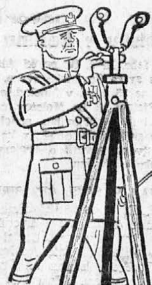
GENERAL ARCHIBALD WAVELL glavni poveljnik britanske-nijske vojske

KAHIRA, 7. febr. Reuter. Predsednik avstralske vlade, Menzies, ki je zdaj v Kahiru, je izjavil, da bo avstralska vojska skoro štela 500.000 vojakov.