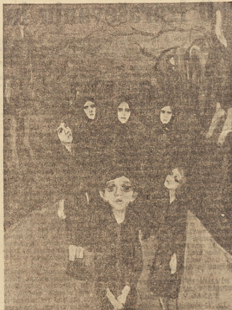
D. Pavletič — Lorenčak: Zločin v Frankolovem (olje), 1961