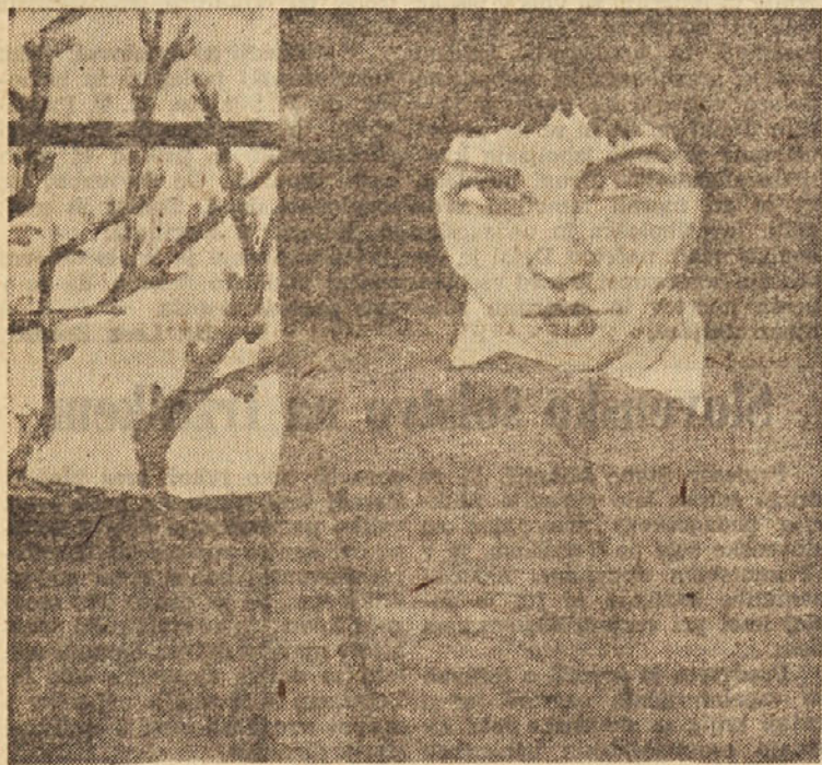
D. Pavletič — Lorenčak: Pomlad (olje), 1959