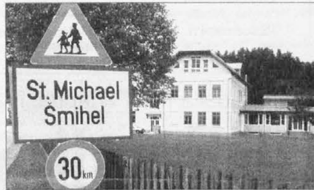
Dvojezični napis na Koroškem

Tudi Slovenci v sosednji koroški deželi se soočajo s pomanjkanjem sredstev. Deželo vodi Haider, dunajska vlada pa ni Slovincem najbolj naklonjena. Druge pomoči so odmerjene. To je bil eden izmed razlogov, da sta se vodstvu laično-levega ZSO in katoliško obarvanega NSKS odločili, da ukineta vsak svoj tednik in ustanovita skupni tednik Novice. Slovenci v Italiji smo storili nekaj podobnega z Zadrujo Primorski dnevnik,