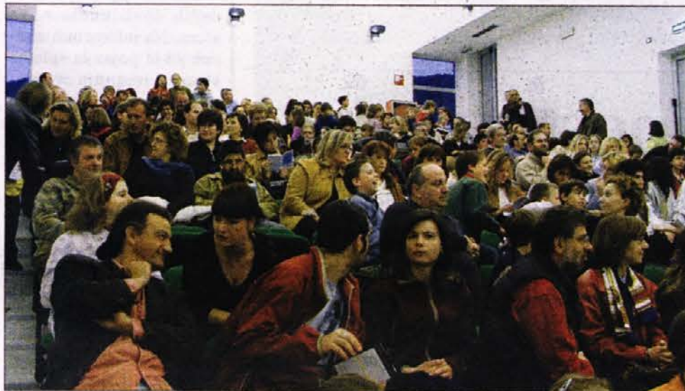
A fianco parte del pubblico che ha seguito la presentazione nel teatro di S. Pietro, sotto un'immagine del video e un momento degli interventi