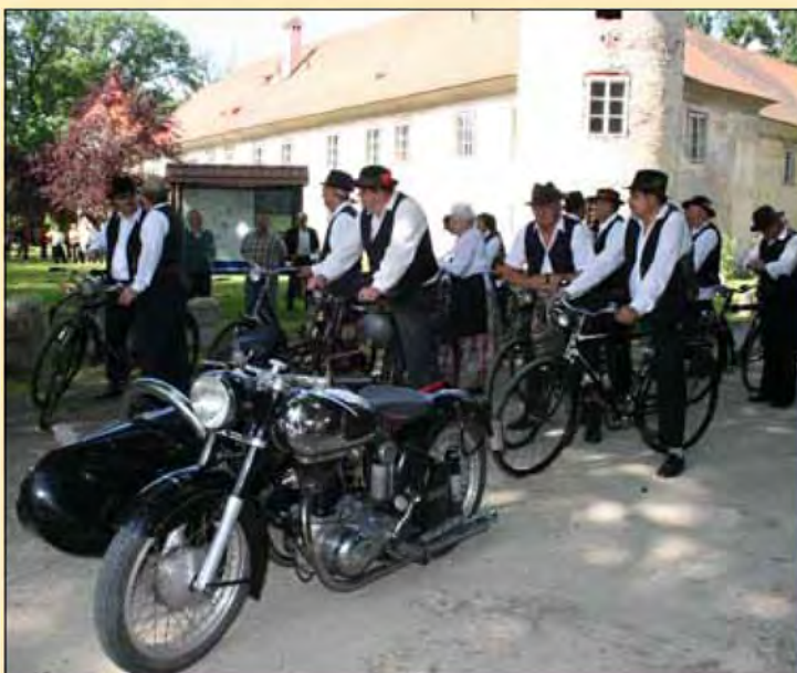
Začetek 7. rally-ja starodobnikov pred beltinskim gradom