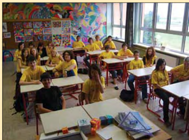
Živetij je res lepo - 9. d