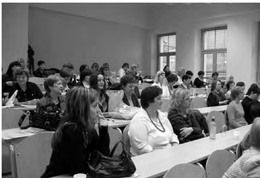
Na strokovnem posvetu v Idriji.

Ker letos podružnice v Sloveniji praznujemo 50-letnico delovanja, je bil že prejšnji posvet uvod v to praznovanje. Na posvetu so poleg številnih praktikov sodelovali predstavniki vseh treh