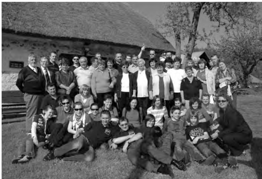
Zadovoljni obrazi udeležencev.

Na koncu dneva smo bili zadovoljni oboji, Zdolčani in Marki, na žalost pa smo se slednji morali odpraviti domov. V spominu nam bo ostala prečudovita, s soncem obsijana pokrajina in veseli ter dobrosrčni ljudje.