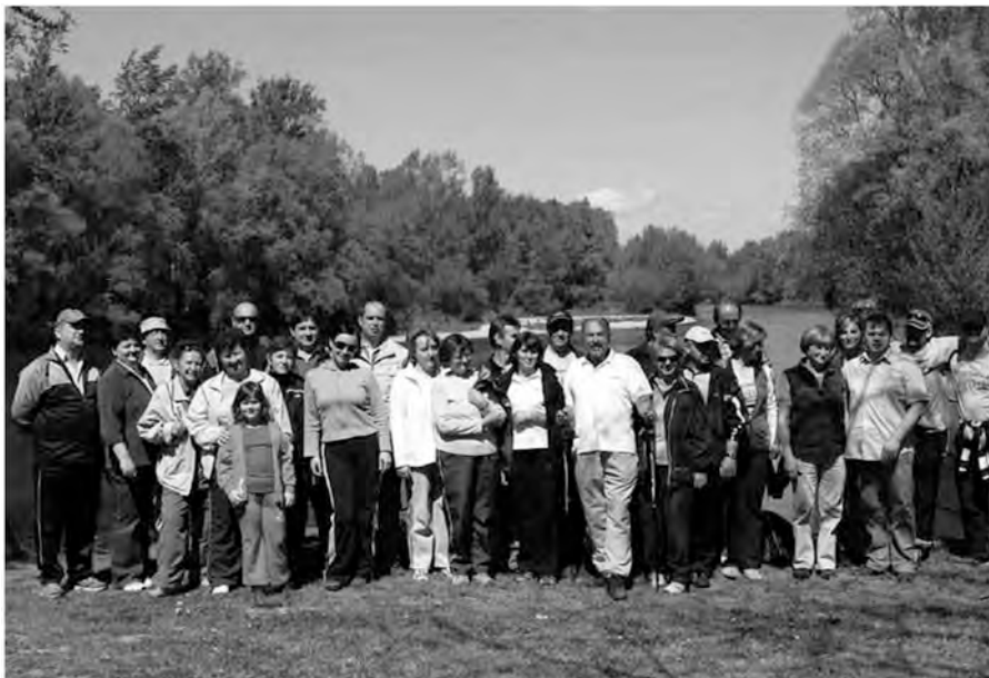
Pohod ob dnevu zemlje.

Poleg obeležitve Dneva Zemlje je pohod tudi odlična priložnost za druženje in opazovanje narave v poplavnem murskem logu, ki je dragocen na-