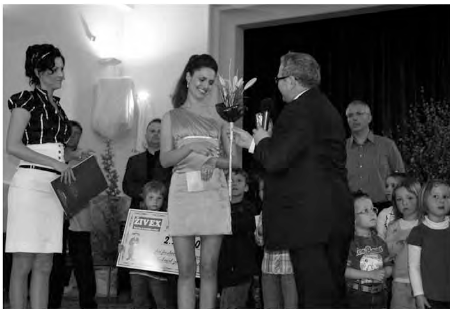
Zahvala ob zaključku prireditve.

Snemalna ekipa je oddajo iz Beltinca posnela v Kulturnem domu v torek, 22. aprila, že ves teden prej pa smo snemali zunanje kadre, panoramo in