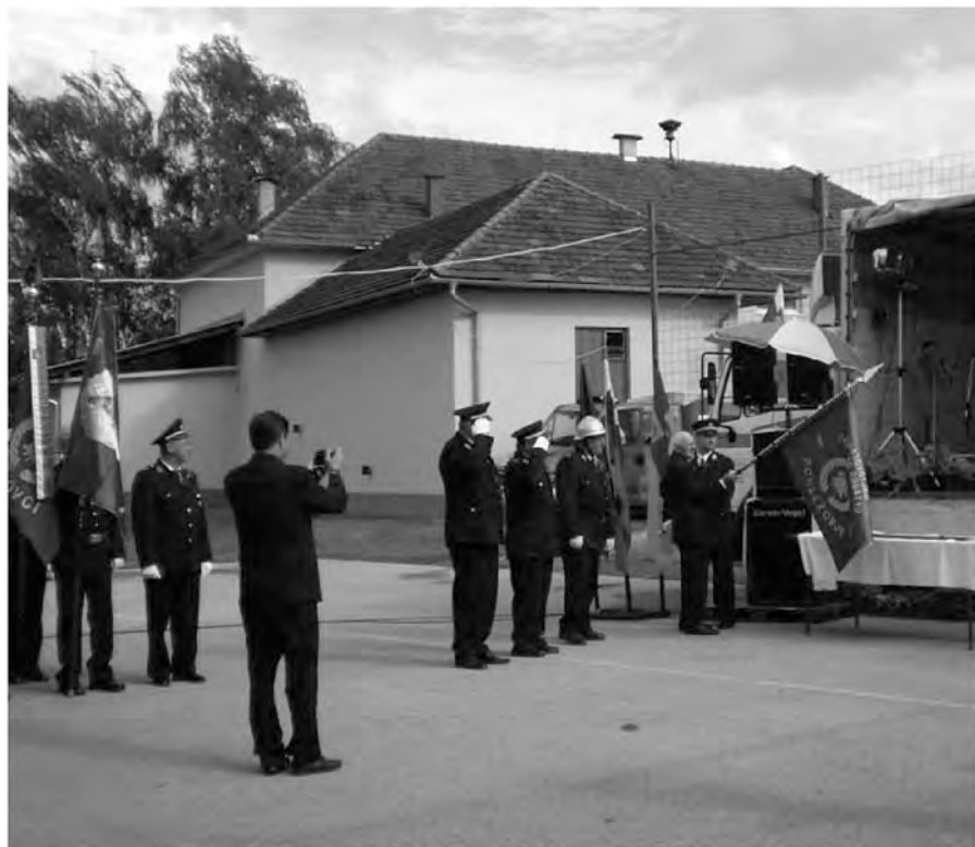
Razvije novega praporja

Tako je minilo slavnostno razvije novega prapora v našem društvu. Sledila je veselica z ansamblom Skok do zgodnjih jutranjih ur. Ko smo odhajali vsak proti svojemu domu, smo bili resda utrujeni, toda vseeno še zmeraj dobre volje. Ponosni na novo pridobitev in z lepimi spomini v srcu smo zaključili to prireditev.