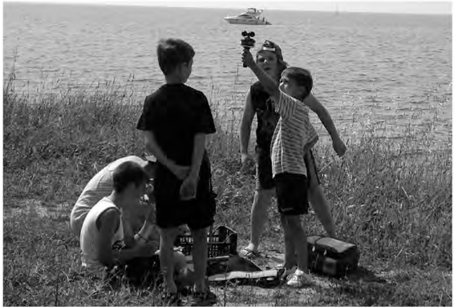
Ob plavanju so potekale še druge dejavnosti naših tretješolcev.