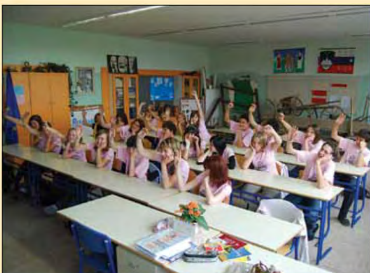
Znanje je pomembna vrednota - 9. c