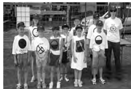
Pionirji PGD Lipovci

MOČ" se naslednje leto vidimo v Lipovcih, kjer bomo poskušali poseči po boljših rezultatih.