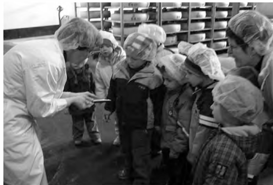
Ali ima sir že dovolj velike luknje?