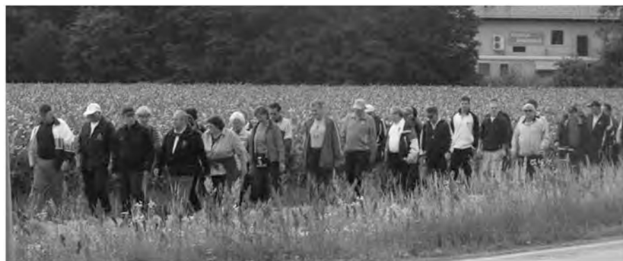
Volitve v našem bloku. - KD Ivan Kaučič Ljutomer