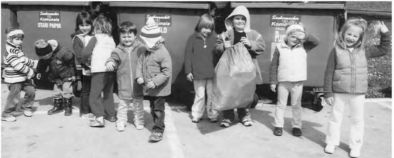
Živimo z naravo.