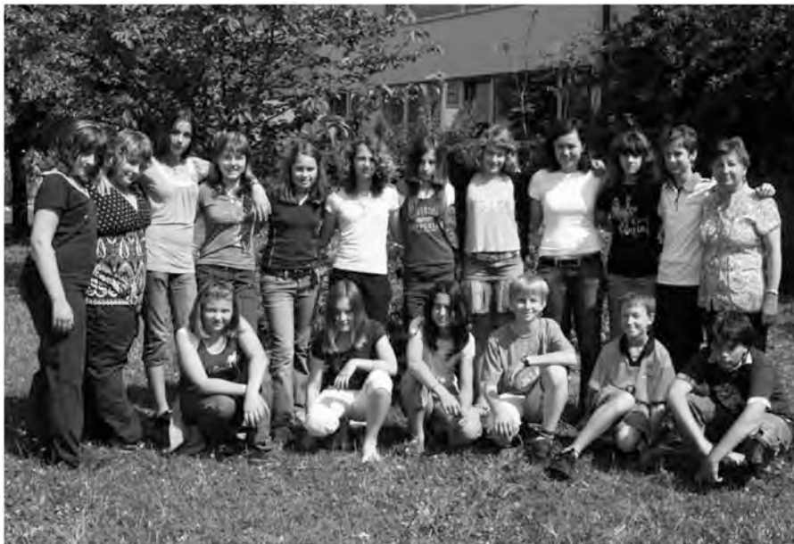
Prostovoljci v projektu.

Z druženjem so bili oboji zadovoljni, zato bodo učenci pri projektu z ve-