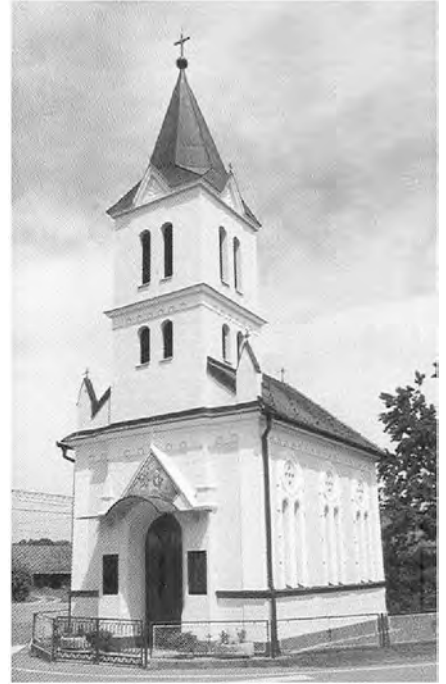
»Slavljenka – zavidljivih 100 let.«

a pri Jezusovem srcu se duša umiri. In pesem kot molitev privre nam iz srca, spet žalost v stran prežene in upanje nam da!«