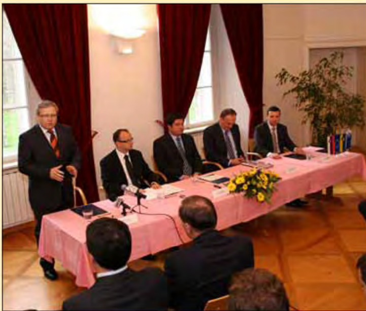
Podpis pisma o nameri izgradnje regionalnega distribucijskega centra Panonia