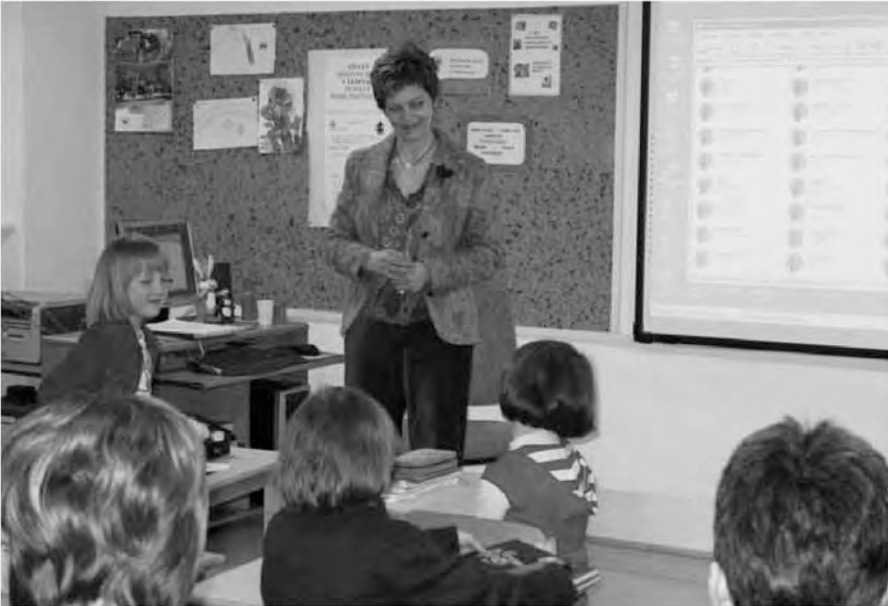
Pri učni uri z interaktivno tablo v kombiniranem oddelku POŠ Ledine nad Idrijo.

Ob iskanju podatkov o doseganju točk na nacionalnih preizkusih znanja so učiteljice običajno postregle s podatkom, da so njihovi učenci dosegli višje ali pa vsaj enako število točk kot njihovi vrstniki na matični šoli.