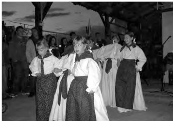
Naše nove noše.

Društvo se nenehno širi, saj prihajajo vedno novi člani, tudi iz drugih krajev. Sonce nenehno sije na nas, pa čeprav tega ne vidite, lahko samo čutite in se nam pridružite.