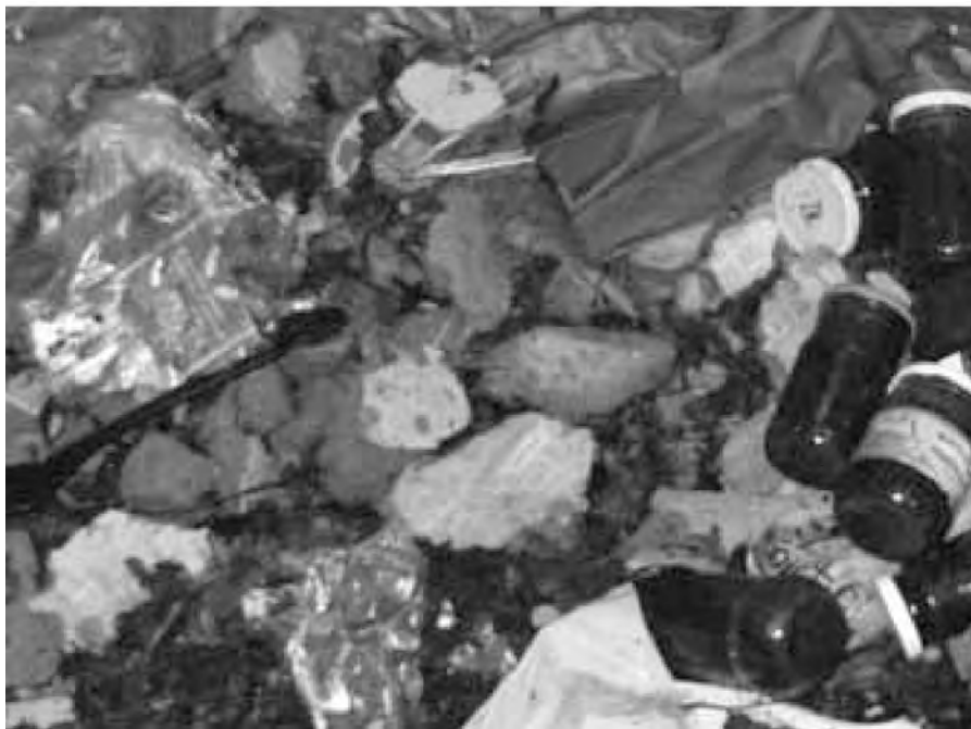
Res vse to potrebuje Slopenco za svoj obstoj?

Vsi ti omogočajo uresničitev misli iz pisma indijskega poglavarja Seatla amerišskemu predsedniku Lincolnu, v katerem prerokuje, da se bomo belci utopili v lastnih iztrebkih in bo v gozdu toliko človeškega smradu, da bodo ptice odletele. Uresničila se bo njegova prerokba: »RESNIČNEGA ŽIVLJENJA JE KONEC. ZACHENJA SE BOJ ZA OBSTANEK...« Zato si želim, da bi lahko tudi naši potomci zjutraj vstali, šli v Slopenco in ji skupaj s ptički »vouščili dober den!«