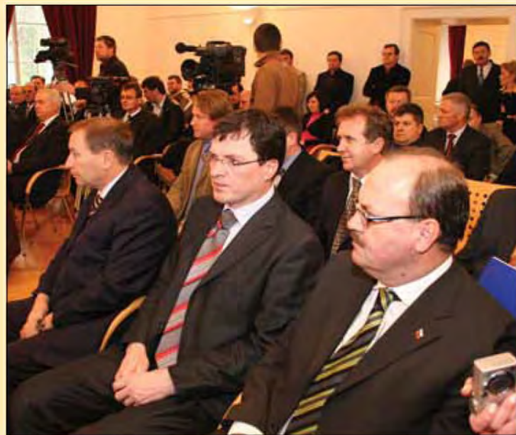
Slavnostnega podpisa pisma o nameri se je udeležilo mnogo pomembnih gostov.