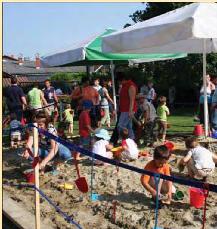
Mačje gradbišče - izdelovanje mačjega mseta v peskovniku