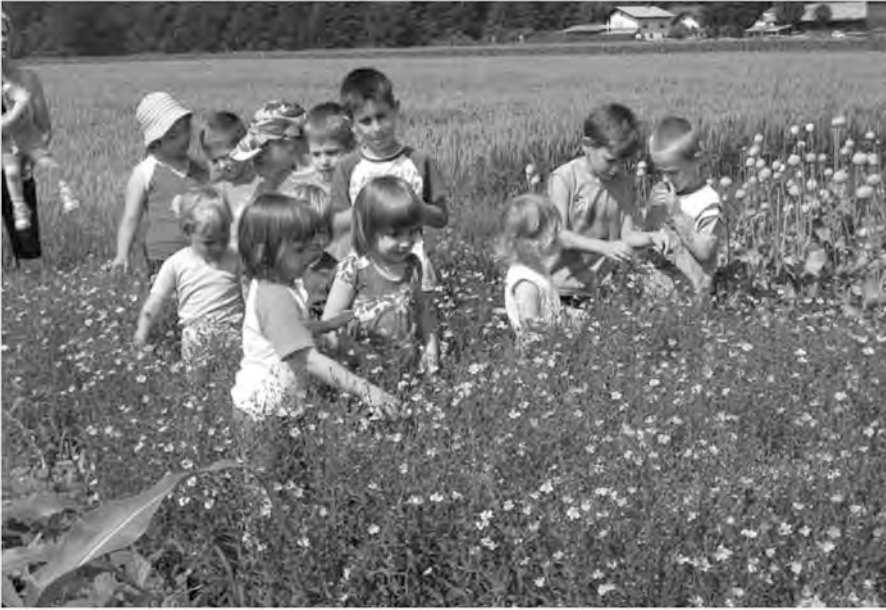
Otroci na njivi.

Kakih petdeset, šestdeset let nazaj so skoraj pri vsako hiši pridelovali lan, iz katerega so izdelovali debelo domače platno. Iz njega so potem šivali brisače, prte, vreče, ponjave, za starejše moške in dečke pa široke debele hlače. V današnjem času je rastlina z lepimi modrimi cvetovi že skoraj pozabljena.