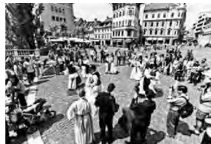
Zaplesali smo tudi na Prešernovem trgu. (Sebastjan Balazic)

bomo opravili skupno deset nastopov, učili domačine naših plesov, sodelovali s skupinami iz Portugalske, Madžarske, Uzbekistana ter Indije. Več o našem gostovanju si lahko preberete na: HYPERLINK »http://www.marko-beltinci.net« www.marko-beltinci.net