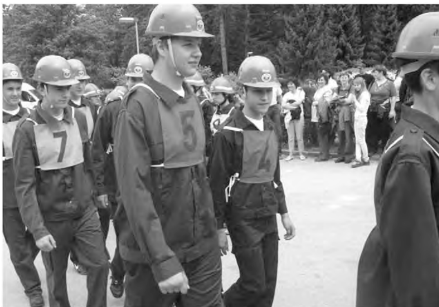
Tekmovalci korakajo na tekmovalni prostor.

Po razglasitvi, kjer smo se lahko pripričali, da se slovenskemu gasilstvu ni bati za prihodnost, kar se članstva tiče (prav prijeten je pogled na tako veliko množico mladih gasilcev), smo se zapeljali skozi Kotlje na Ivarčko jezero. Starejši smo se sprehodili po lično urejenih sprehajalnih poteh okrog jezera, prebrali nekaj »misli za dušo«, napis-