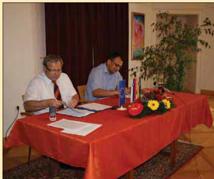
Slavnostni podpis pristopa k izgradnji kanalizacije v občini Beltinci