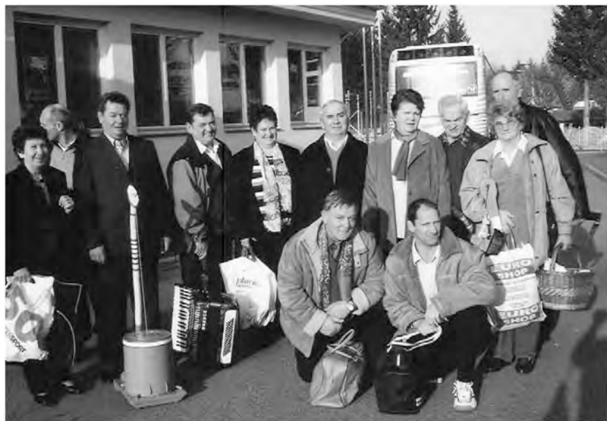
Nastopajoči v Monoštru.

li naš vsakdan, da bi ob naši predstavi ljudje vsaj malo pozabili na morebitne težave, saj te tako ali tako ostanejo, pa da bi se malo družili in nasmejali. Dosti prostega časa in dobre volje je vložnega v to delo in če vidiš, da je ljudem všeč, je to poplačano. Na žalost se naša domača publika bolj slabo udeležuje predstav, mi pa bi si želeli prav nasprotno. Veseli bi bili, da bi prihajali na prireditve in si vzeli vsaj malo časa tudi za nas – nastopajoče člane KUD-a Števan Kúhar Bratonci.