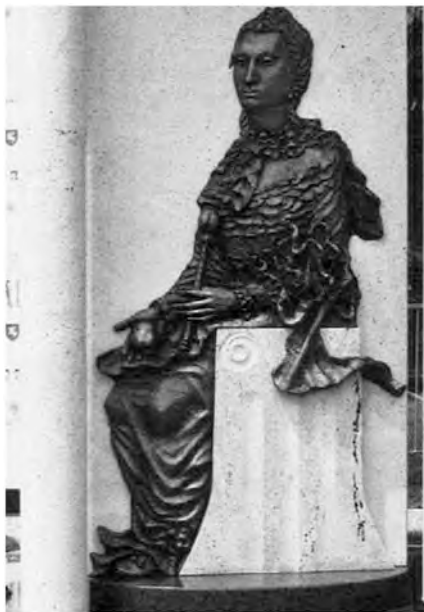
Cesarica ima v levi roki žezlo, v desni dlani pa drži krompir.