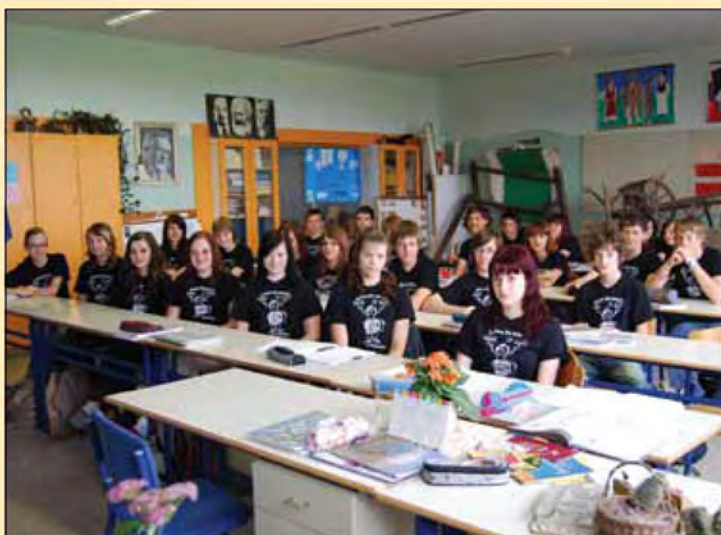
Na mladih svet stoji - 9. a