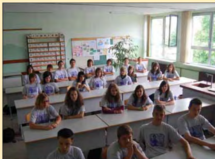
Zazrti v prihodnost - 9. b