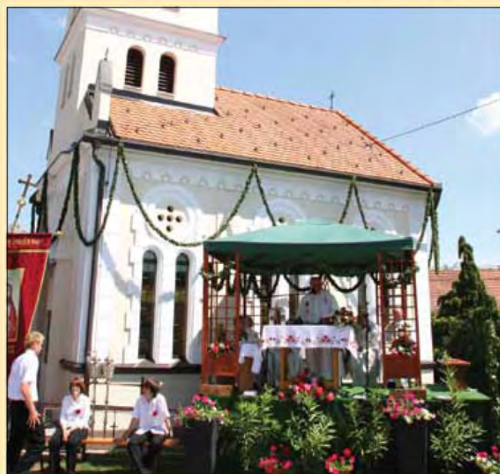
Stoletnica gančke kapele