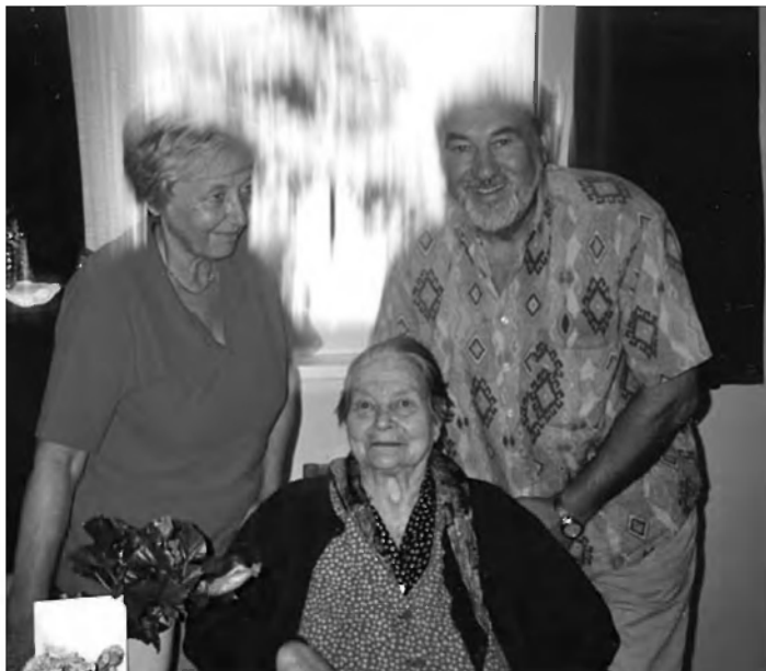
Besedilo: Mija Grebenc Jelaska

Zahvalila se je za naš obisk, za cvetje in vizitko, ki jo je postavila na vidno mesto. Ob slovesu sva ji s predsednikom društva Francijem Ivancem zaželela zdravja, še veliko lepih trenutkov in prijetno bivanje v lepo urejenem domu na Vrhniki.