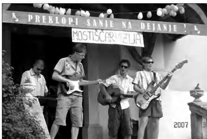
»Kingstoni« na zaključni prireditvi.