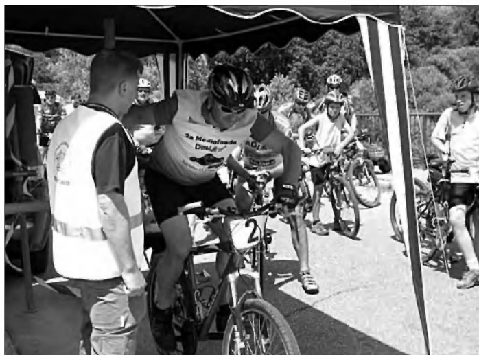
Start moške kategorije