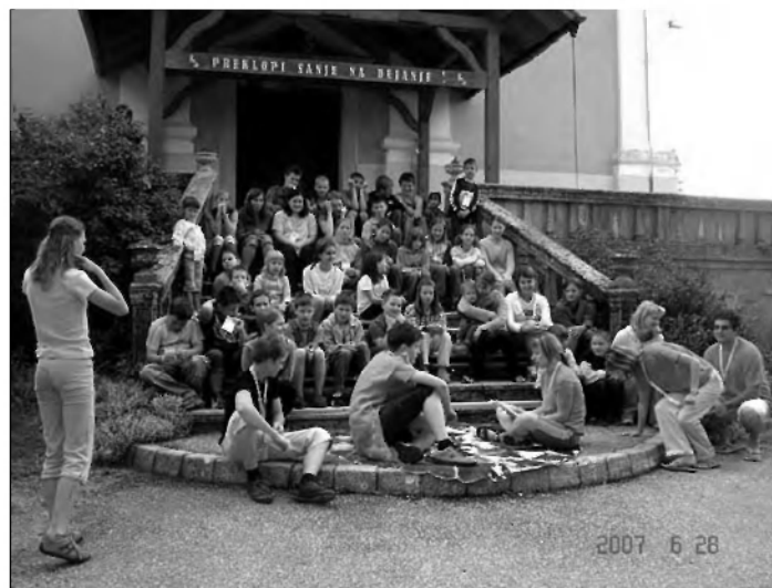
Jutranji intervju s koliščarji.

Sobota pa je bila še bolj razgibana. Po katehezi smo peš odšli v Rob, kjer sta nas pričakala gasilski poveljnik in pomočnik. Predstavila sta nam gašenje, nevarnosti ... in na koncu smo imeli še vodno rajanje, saj smo se špricali z gasilsko cevjo. Popoldne so skupine krožile po treh otokih (lokostrelci, frizerski salon, tatoo salon in urejanje nohtov) in se uredile za popoldanski nastop. Popoldne smo imeli namreč živ vklop na Most TV z Mostiščarvizijo, na katero smo povabili starše. Vse skupine (Bobri, Medvedje, Ščuke, Čaplje), ki so se vse dni borile za točke v velikih igrah, so se morale izkazati tudi na pevskem področju. Seveda je bil potreben tudi zanimiv nastop in ne samo petje. Na koncu nas je obiskal še ansambel "Kingston". Po razglasitvi rezultatov in razdelitvi frizbijev smo se pogostili še na pikniku.