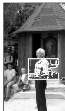
Kratek nagovor in zaprosilo za blagoslovitev