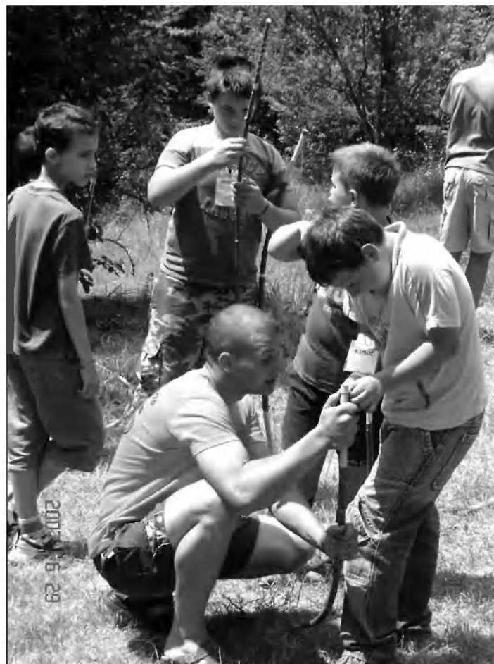
Animator vedno pomaga (izdelovanje lokov).