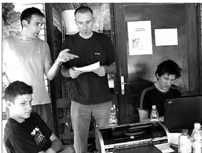
Začasni računalniški center za objavo rezultatov