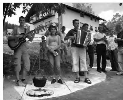
Ansambel iz dežele Trubarjeve