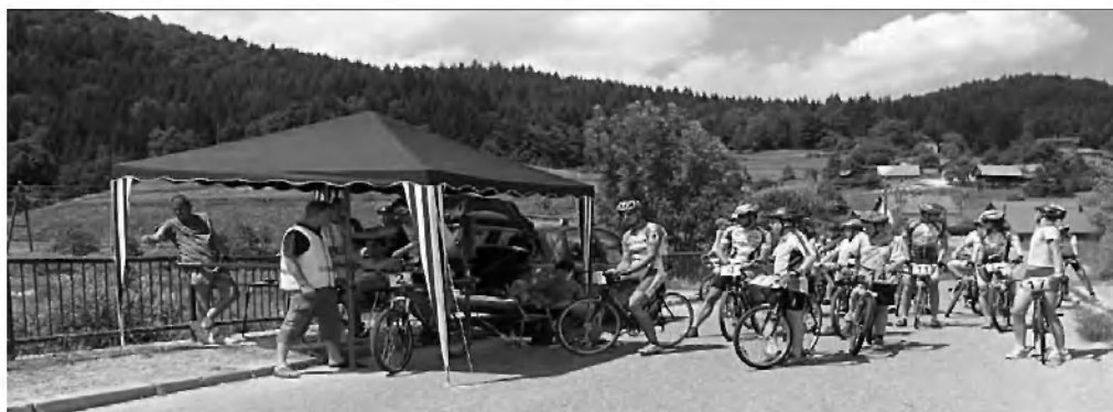
Startno mesto na mostu v Kneju