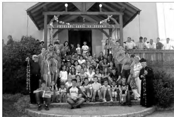
To smo mi ...