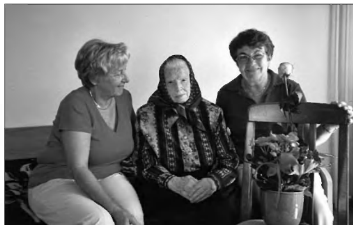
Besedilo: Mija Grebenc Jelaska

Predednik društva Franc Ivanc je v svojem imenu in imenu društva zaželel jublantki vse najboljše in izrazil željo po ponovnem obisku na isti dan naslednje leto.