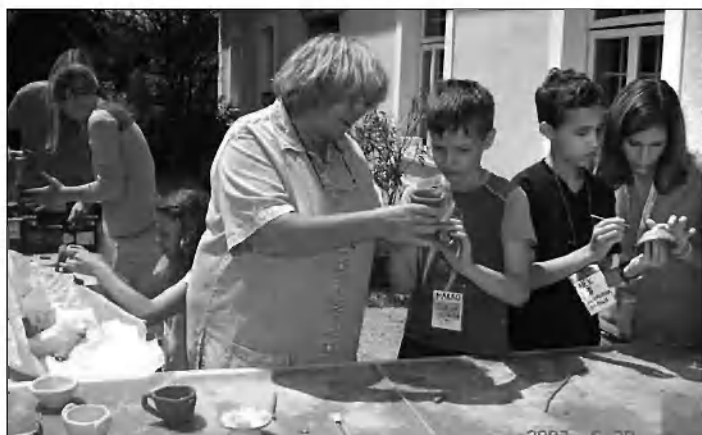
Izdelati znamo tudi posodo.