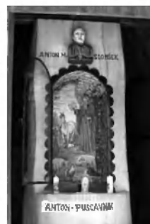
Deblo stare lipe