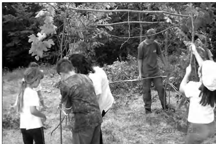
Tekmovanje skupin v postavljanju lastnega kolišča.