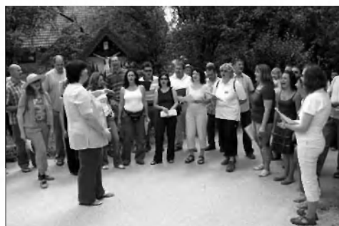
Pevski zbor »Češnje« iz Lavrice