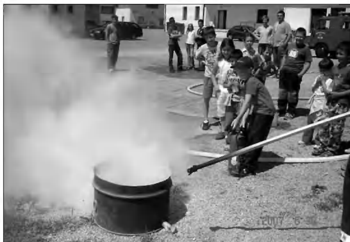
Tudi gasiti smo se učili.