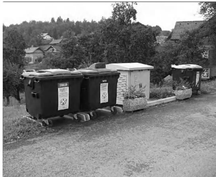
Besedilo in fotografija: Jože Jeršin

Slika pove vse! Vaščanom Malih Lašč iskrena pohvala za vzorčno urejen ekološki otok.