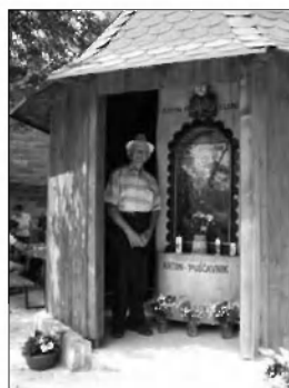
»Idejni in izvedbeni oče kapelice«