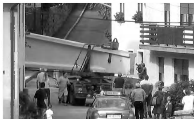
Zahteven prevoz konstrukcijskih elementov po Stritarjevi ulici v spremstvu vozila Policije in naših občanov.