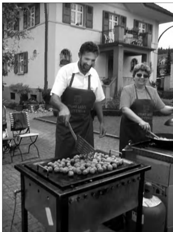
Kolesje dogajanja je tudi občinsko svetnico potegnilo v svoj tir