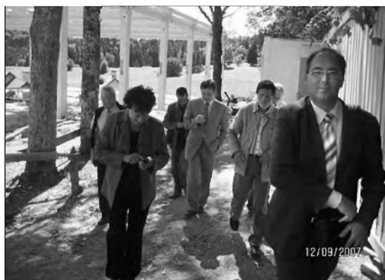
Ekipe investitorja in izvajalcev, projektantov, nadzora in uporabnika spramlja delo na gradbišču.