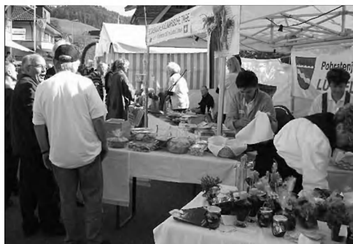
Sejem bil je živ

ki po enajstih letih že ima svojo zgodovino in postaja tradicionalno. V imenu vseh udeležencev letošnjega obiska se iskreno zahvaljujemo.