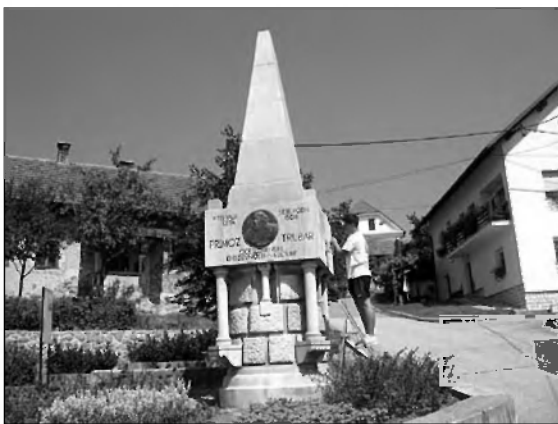
Obnovljena sta bila Trubarjev spomenik na Rašici in ...

Pripravili smo tudi program za gledališki abonma (poseben prispevek) in upamo, da bomo z izborom predstav zadovoljili čim širši krog ljudi. Med poletnim časom smo izvedli tudi Velikolaški poletni festival. Prizadevali si bomo, da bomo festival v naslednjem letu še bolj približali našim občanom.