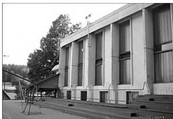
Na tem mestu bo zrasel nov objekt.