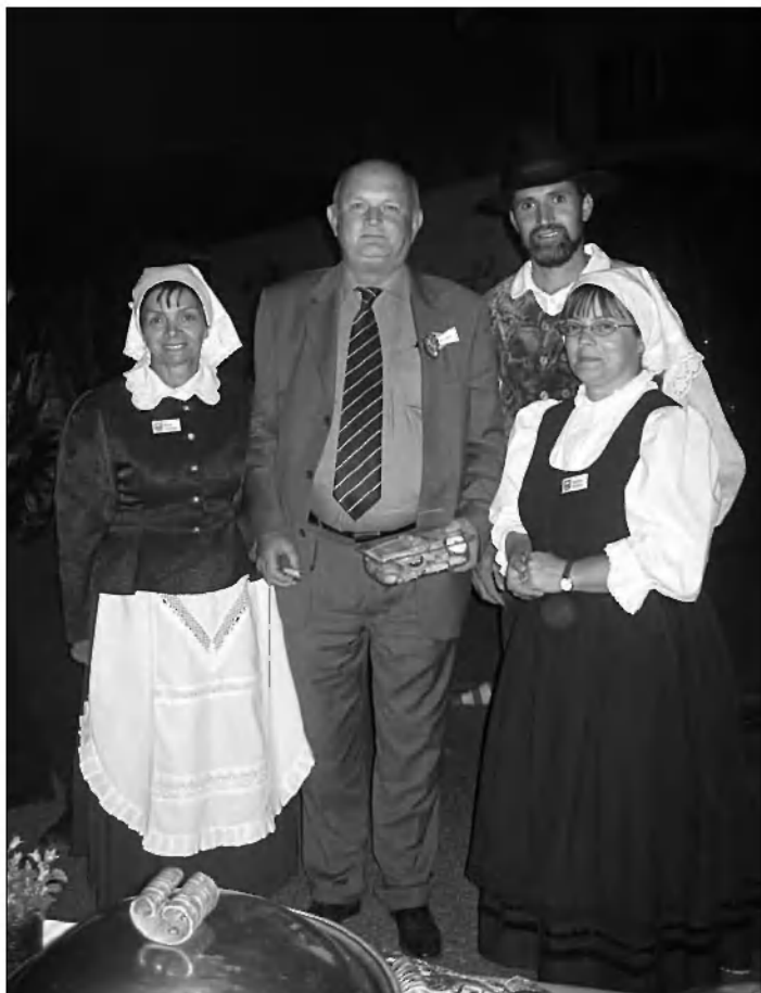
Ustavil se je tudi začasni odpravnik poslov slovenskega veleposlaništva iz Berna