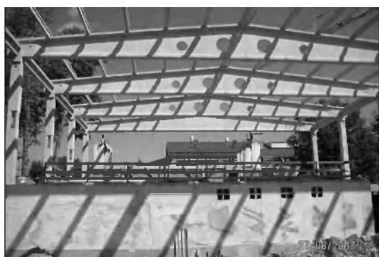
Nov objekt je že dobil svoje nove dimenzije ...