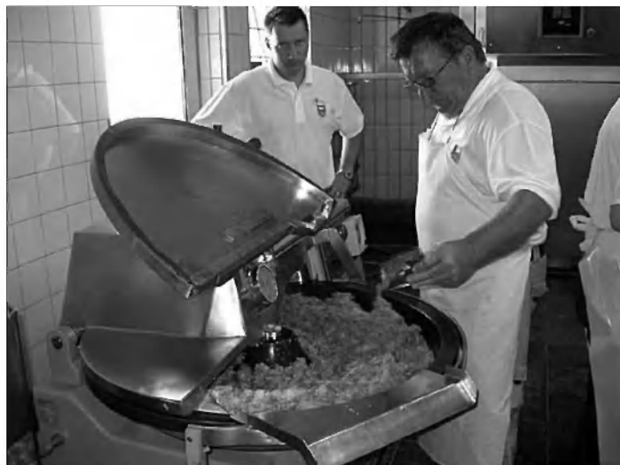
Priprava mase za čebularje