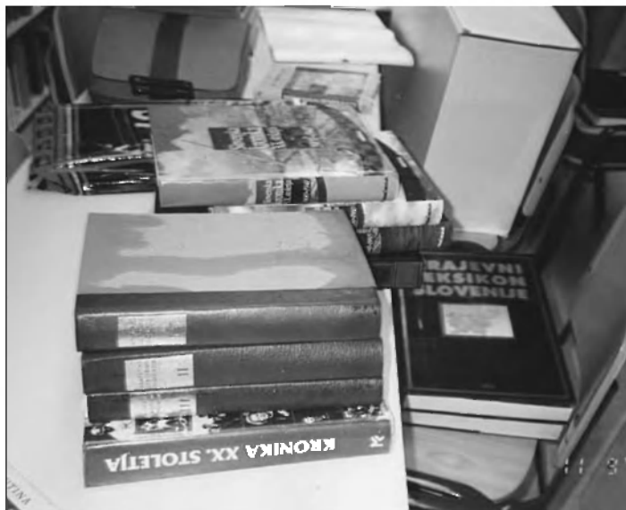
Knjige v šolski knjižnici so bile poplavljenе

Trubarjevino, vključili se bomo v občinske proslave, šolsko glasilo Lešniki bomo posvetili Trubarju, organizirali kviz na temo »Ali poznamo Trubarja?« in podobno.