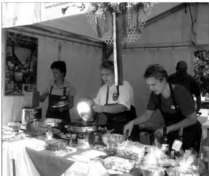
Dobro nam je šlo od rok