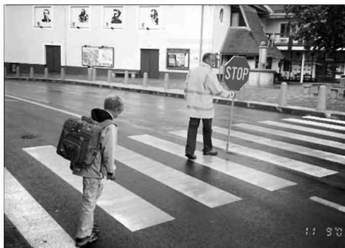
Spremljavo otrok na magistralni cesti

Vsak je svoje sreče kovač. Človeška sreča je odvisna od človeške modrosti, mišljenja, zmernosti v željah, preoblikovanjem osmišljanja življenja in drobnih pozornosti. Ne bomo sovražnik sami sebi. Vsak dan, ko je človek jezen, je zanj izgubljen. Rimski izrek »carpe diem« uči in sporoča, da moramo »porabiti, užiti, iztrgati« prav vsak dan.