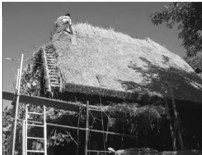
Stritarjeva kašča v Podsmreki je dobila novo slamnato streho.