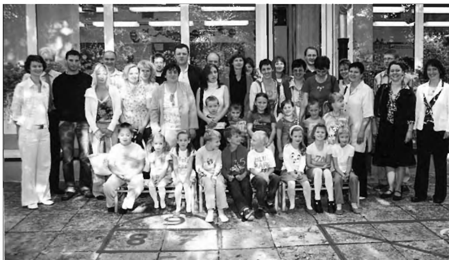
Fotografija 1.a razreda

In kaj je novega, drugačnega v Trubarjevem šolskem letu na naši šoli?