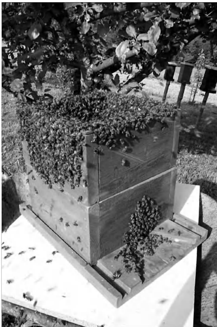
Naselitev čebel v »Podkladnik«