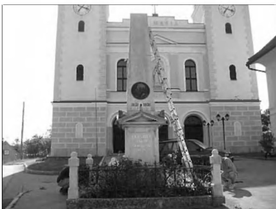
Levstikov spomenik pred župnijsko cerkvijo v Velikih Laščah.