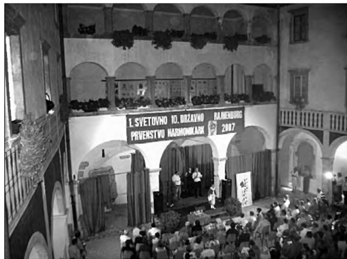
Oder je pripravljen

Besedilo: Franci Pečnik, predsednik KUD Marij Kogoj (za udeležence iz občine Velike Lašče in občine Grosuplje)