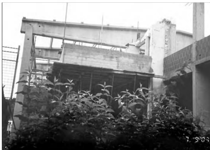
Fotografija nove gradnje

Novost, ki jo uvajamo v letošnjem letu, je sprememba urnika dela in svetovanja svetovalnih delavk na šoli. Vsak četrtek bodo imeli starši in otroci možnost, da med 11. in 19. uro obišejo svetovalni delavki na šoli. To spremembo uvajamo zato, da omogočimo srečanje s starši, ki odhajajo zgodaj v službo in se pozno vračajo domov.