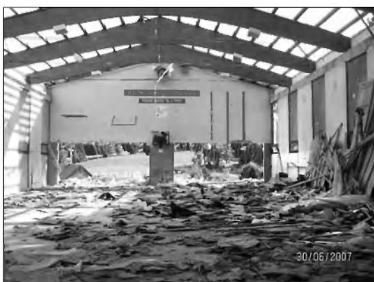
Pričelo se je rušenje ...