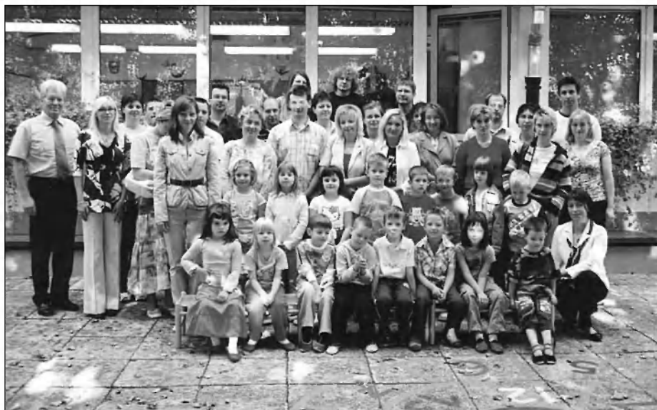
Fotografija 1. b razreda