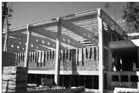
... in smrečico na vrhu konstrukcije.