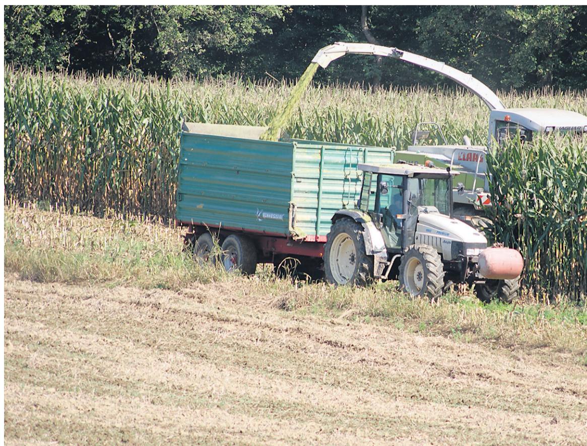
Med kmetijskimi subvencijskimi rekorderji v Sloveniji ni kmetov.

S kmetijskega ministrstva so nam posredovali podatke o izpla-