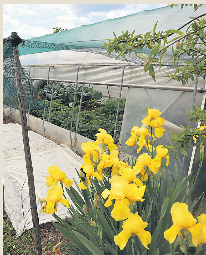
Rastlinjak potrebuje bočno zračenje, poletno senčenje pa je tudi dorodošlo.

V rastlinjaku lahko tudi pozimi gojimo veliko rastlin. Pomembno je, da ga tudi pozimi redno zračimo. Izkoristimo vsak sončen dan in ga takoj, ko se temperature dvignejo nad 0 °C, odpremo in temeljito