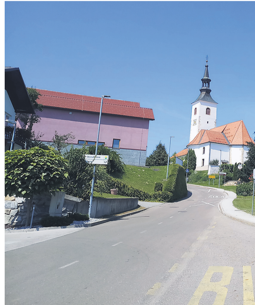
Civilna iniciativa za ambulanto Destrnik je samo še poglobila razdeljenost občine na dva

Zbor občanov, ki so se ga udeležili vsi akterji zgodbe, sicer ni