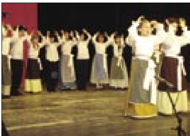
Selektorka je trno povalila števanovsko skupino