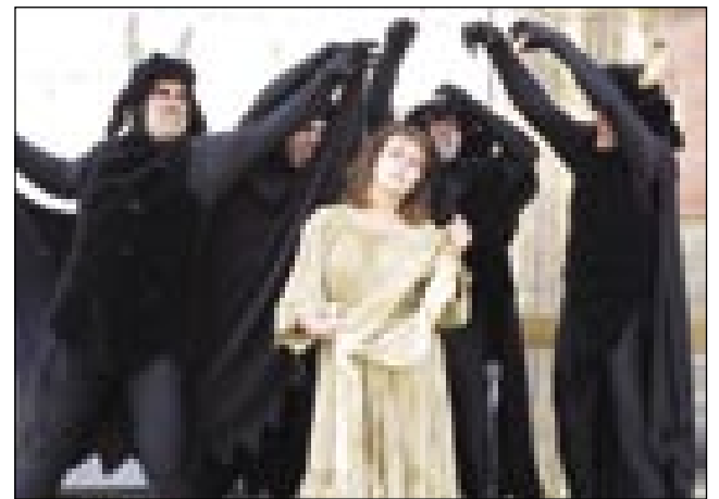
Grejšna düša v pekli

zaprejo poštijie, niške ne more nej nut nej vö. Na den 5000 lüdi leko vidi pasijon. Če se