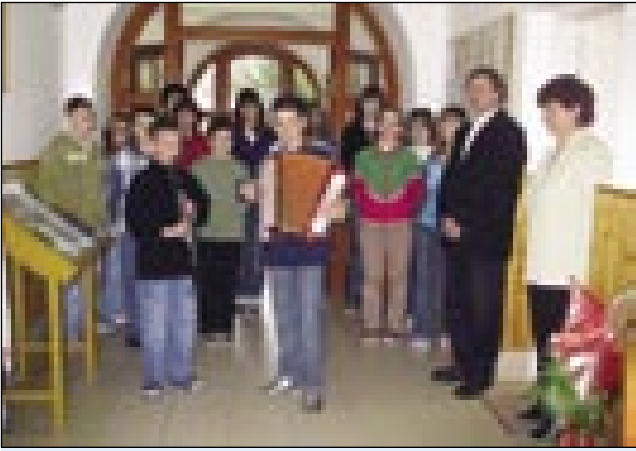
Učenci na gornjeseniški šoli so pripravili prisrčen sprejem

3. aprila, drugi dan delovnega obiska v Porabju, je državna materialnem in izobraževalnem pogledu dobila od Slovenije. Po-