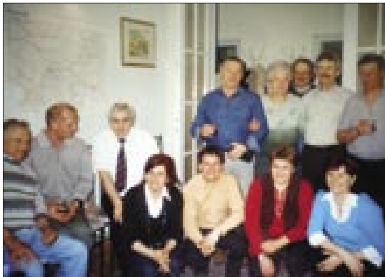
Po volitvaj smo nazdravili staromi-nauvomi vodstvi

stvu in po svetu, na Vogrskom pa od Zveze Slovencev na Madžarskem. Vsakšo leto pa vse menje dobimo od Javnoga