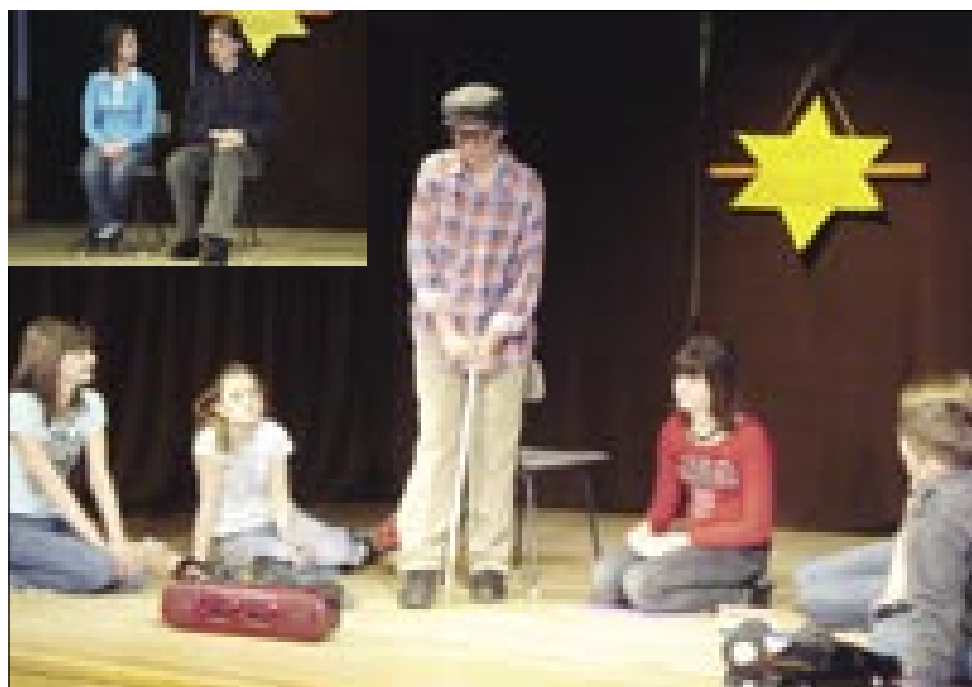
Senički otroci so se predstavili z narečno predstavo Mladost našega dedeka , gimnazijci pa s predstavo v knjižnem jeziku Teta puberteta (mala fotografija)

Po koncu te predstave od otroštva pridemo do pubertete, ki