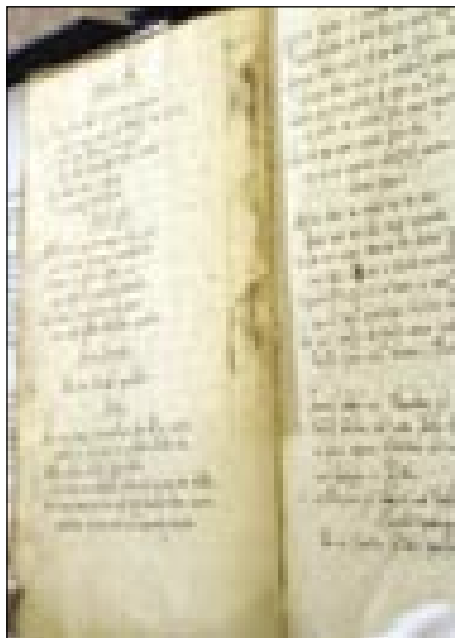
Na originalni pasijon majo skrb v kapucinskem klauštri

Kristušovom trpljenji. V starom varaši de 800 lüdi špilalo zvüna na vedrini, če nede deš. Igro je napiso kapucinski pater Lovrenc Marušič 1721. leta v slovenskoj rečji. Tistoga ipa je dosta lüdi mrlau na Slovenskom pa po cejlöj