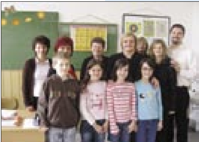
Z učenci in učiteljicami na števanovski šoli

že tretje po vrsti), se je srečala z dobrimi znanci. Obiska so se posebej razveselile učiteljice, ki so bile spremljevalke otrok v Piranu.