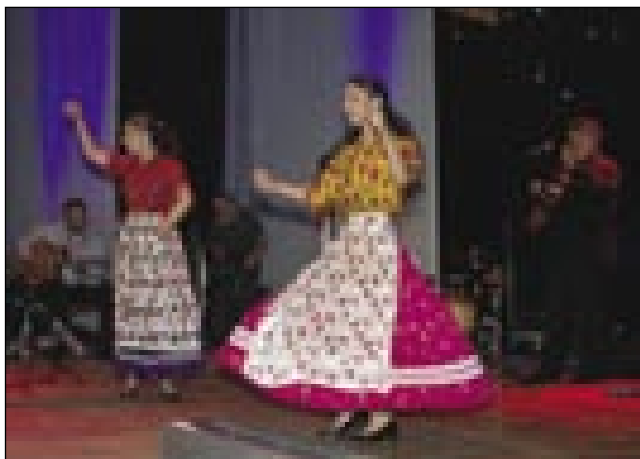
Plesalke v romskom gvanti

»Ciganj« pride iz latinskoga »Zingarus«. Vandraški Romi so živeli na kaulaj pa v šatoraj, drugi so meli prausne rame. Zvün lade pa postele drugoga nej bilau v iži. Moški so zvekšoga nosli takše gvante kak vogrski pavri, ženske so mele farbas-te indašnje gvante. Nosile so