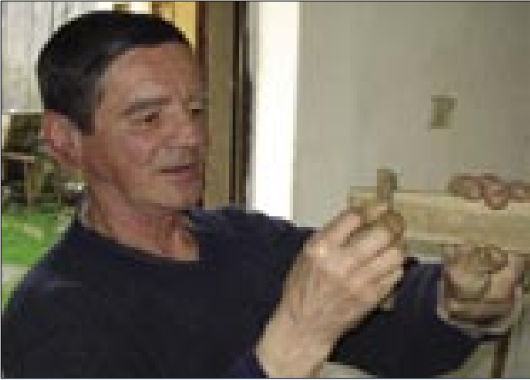
Pintarin Djani kaže, kak trbej doge hobliti

Kak pravijo, pintarge so kovači lesa. Dosta pa dosta se trbej včiti, dočas se človek vönavči tau meštarijo.