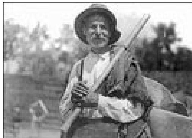
Ciganj, šteti redi kopanjö

pevci so ciganjski goslarge. V Evropi znamenüje »ciganjska muzika« tisto igranje, šteto se je pred dvejstau lejtami začnilo na Vogrskom. Banda nosi vogrske gvante, igra na gosline, bajs pa cimbele. Najbaukši muzikaši vsikdar brezi natlinov igrajo, žmetne pesmi tö, kak na priliko Brahmsove Madžarske plese. Muzika je bila skoro edina paut za Ciganje, ka vö s smastva pridejo. O vogrski Ciganjaj ne moremo gučati kak o ednoj skupini. Vsi so malo ovaški, ne moremo praviti, ka vsi takše gvante nosijo ali vsi takšo šteti gejo. Pri ništernaj je najvekša vrejdnost tau, če nekaj s stau forintami dobro angla. Pri drugaj majo stariške mauč nad mlajšami samo do zdavanja. Če oča svoje čeri ne da pojbi za ženo, go té vkradne, pa samo te pride nazaj, gda se že dejte narodi. Te ma odpüstijo. Ovak pozovejo cejlo žlato na gostüvanje ali krstitke. Tau so pravi ciganjski svetki.