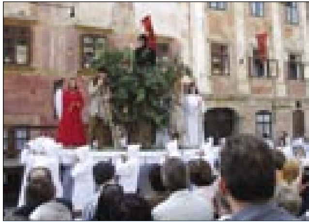
Odre z igralci so nosili na plečaj

Od 28. marca do 19. aprila v Škofji Loki paulek Ljubljane bi radi osemkrat nutpokazali pasijonsko igro o prvom greji in