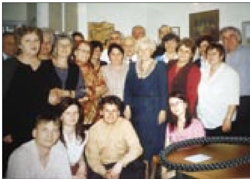
En tau članov društva

Na konci smo nazdravili nauvomi vodstvi pa si želeli, naj bi društvo ešče dugo-dugo delalo, da bi leko, daleč od rojstnoga kraja tö ohranili svojo identiteto. Nejsmo se mogli fejst veseliti, zatok, ka v društvi mamó mrtveca. Umrla je