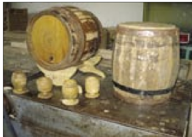
Taše male bečke je bola težko napraviti kak velke

»Zato ka sta trdiva lesa. Bukev je tō trdi lejs, samo tau je baja, ka tisti brž prki