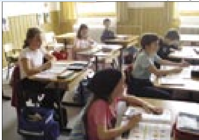
V obnovljeni učilnici števanovske šole