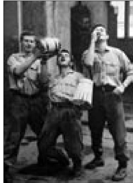
Pri soldačiji (na srejdi) je svojomi prejdjnomi tō napravo malo bečko, zato je leko za en keden domau šeu

»Tak, ka gda smo hoblili, te smo eden šablon nücali. Meli smo vse fela, od maloga do velkoga. Če smo